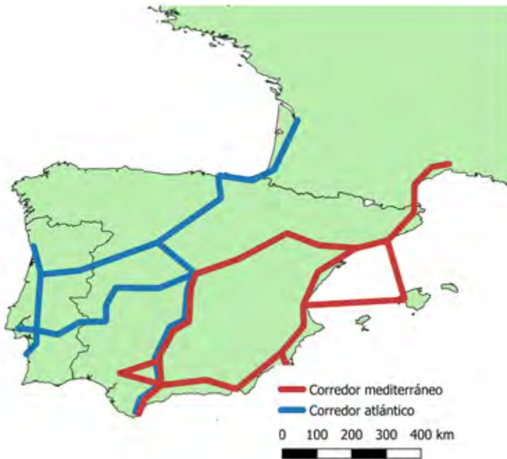
Figura 1. Los grandes corredores europeos en la península ibérica.

El diseño peninsular del corredor atlántico dibuja tres ejes: el que recorre Portugal de sur a norte y se adentra en Francia por el norte de España (Sines-Lisboa-Aveiro-Oporto-Valladolid-Vitoria-Bilbao-Burdeos); aquel que partiendo del puerto de Sines se dirige a Madrid para, desde ese punto, conectar con el norte peninsular (Sines-Madrid-Valladolid-Vitoria-Bilbao-Burdeos), y, finalmente, el que partiendo del sur de España la recorre meridionalmente hasta Valladolid para, desde allí, conectar con Francia (Algeciras-Antequera-Madrid-Valladolid-Vitoria-Bilbao-Burdeos) 11 . En 2019 el Ministerio de Fomento elaboró una propuesta de modificación de este corredor consistente en la incorporación de nuevos nodos con una especial incidencia en las conexiones con los puertos (Gijón, A Coruña, Huelva, Las Palmas de Gran Canaria, Santa Cruz de Tenerife). La entidad pública Administrador de Infraestructuras Ferroviarias (Adif) ha realizado una propuesta consistente