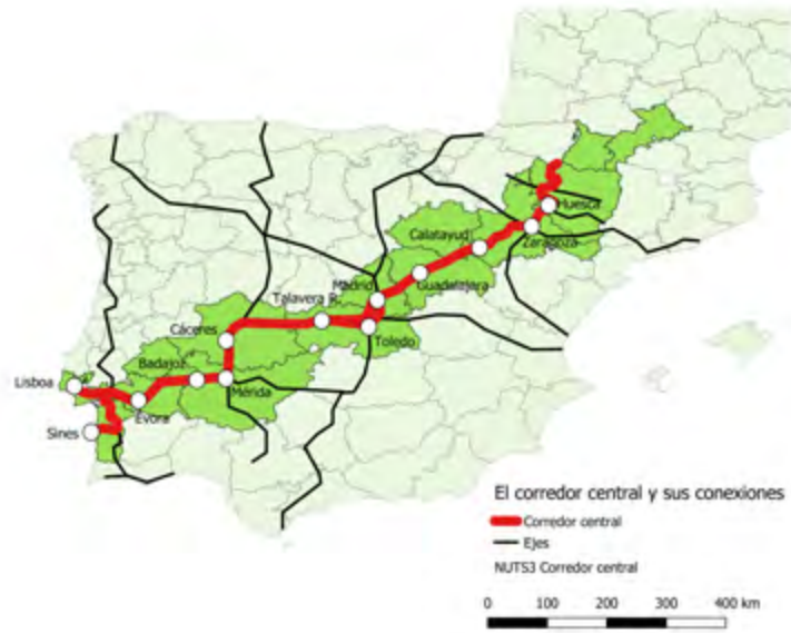
Figura 2. El corredor central y sus conexiones.

rodado cabe destacar la buena infraestructura existente concretada en la autovía A-66 (E-803) que, una vez finalizada en la primera década de este siglo, recorre este eje desde Sevilla hasta Gijón transitando por las ciudades de Mérida y Cáceres.