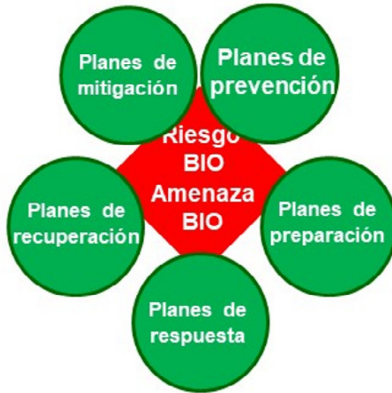
Figura 4. Planes integrados de preparación y respuesta frente al peligro bio

El impacto está relacionado con la capacidad de intervención y respuesta para realizar una adecuada gestión del incidente en los primeros momentos en los que se está generando. Lo cual significa la existencia de procedimientos operativos de respuesta coordinados entre los distintos servicios de intervención, sanitarios o no sanitarios (fig. 4).