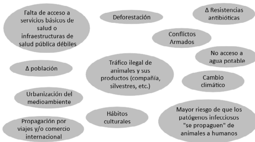
Fig. 3. Factores que afectan a la emergencia y/o reemergencia de las enfermedades

La globalización, la urbanización del medio, el no acceso al agua potable, entre otros factores, en los que se incluye el incremento de las resistencias antimicrobianas, determinan un incremento del riesgo biológico a nivel mundial (fig. 3). En relación con la resistencia a los antimicrobianos hay que tener en cuenta que supone una de las mayores amenazas para la salud y el desarrollo mundial. De hecho, la Organización Mundial de la Salud ha declarado que «la resistencia a los antimicrobianos es una de las 10 principales amenazas de salud pública a la que se enfrenta la humanidad» 15 .