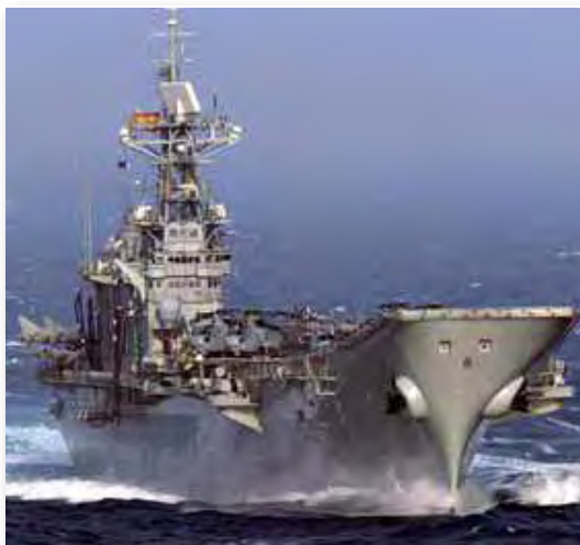
Príncipe de Asturias R-11

El estrecho de Ormuz y sus accesos tienen una especial relevancia desde el punto de vista de la seguridad energética. Según los datos de