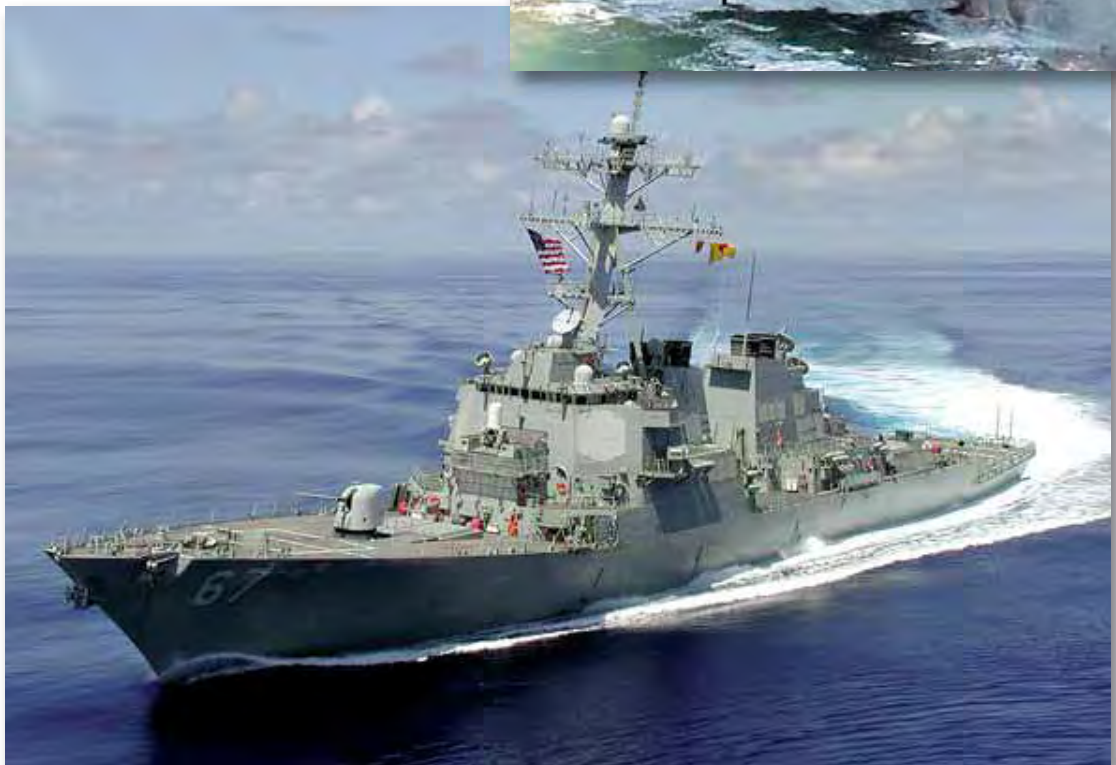
Destructor USS Cole antes y después del ataque de Al-Qaeda

dan los 500. Es decir, son muchos los países interesados en mantener abierta la navegación en las aguas del golfo de Adén, por verse afectados de forma directa sus intereses económicos, pero pocos los que tienen intereses en la cuenca de Somalia, lo que se traduce en menos medios disponibles para las operaciones en esta enorme área. Al ser la zona donde faenan las flotas atuneras españolas y francesas, son España y Francia los países que mayores medios ponen en juego. Ante una zona de tales dimensiones y la escasez de medios se ha hecho indispensable embarcar equipos de seguridad en los pesqueros, militares en los fran-