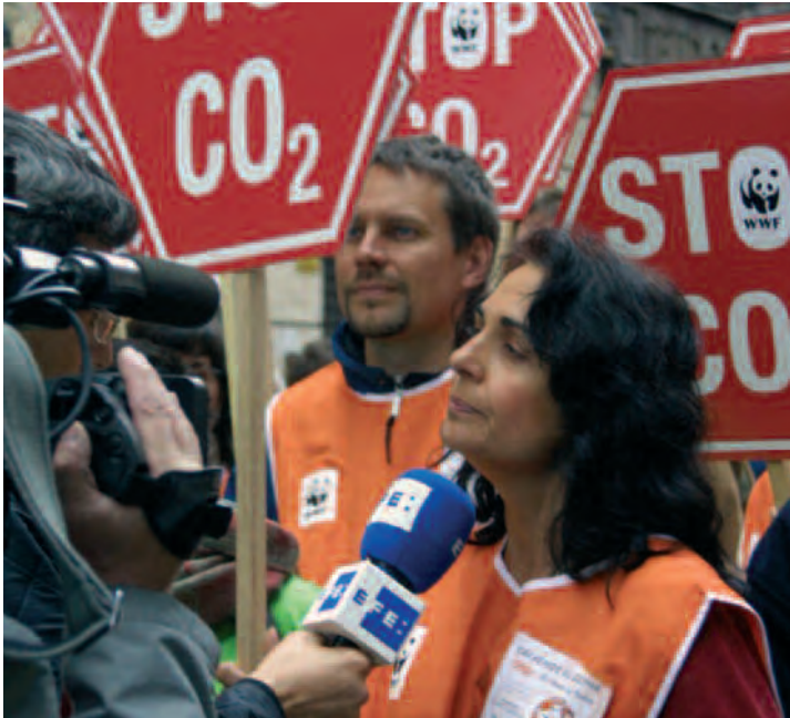
→ Manifestación del Día de la Tierra en defensa de un planeta vivo. En la imagen los responsables del Programa de Cambio Climático de WWF/Adena.