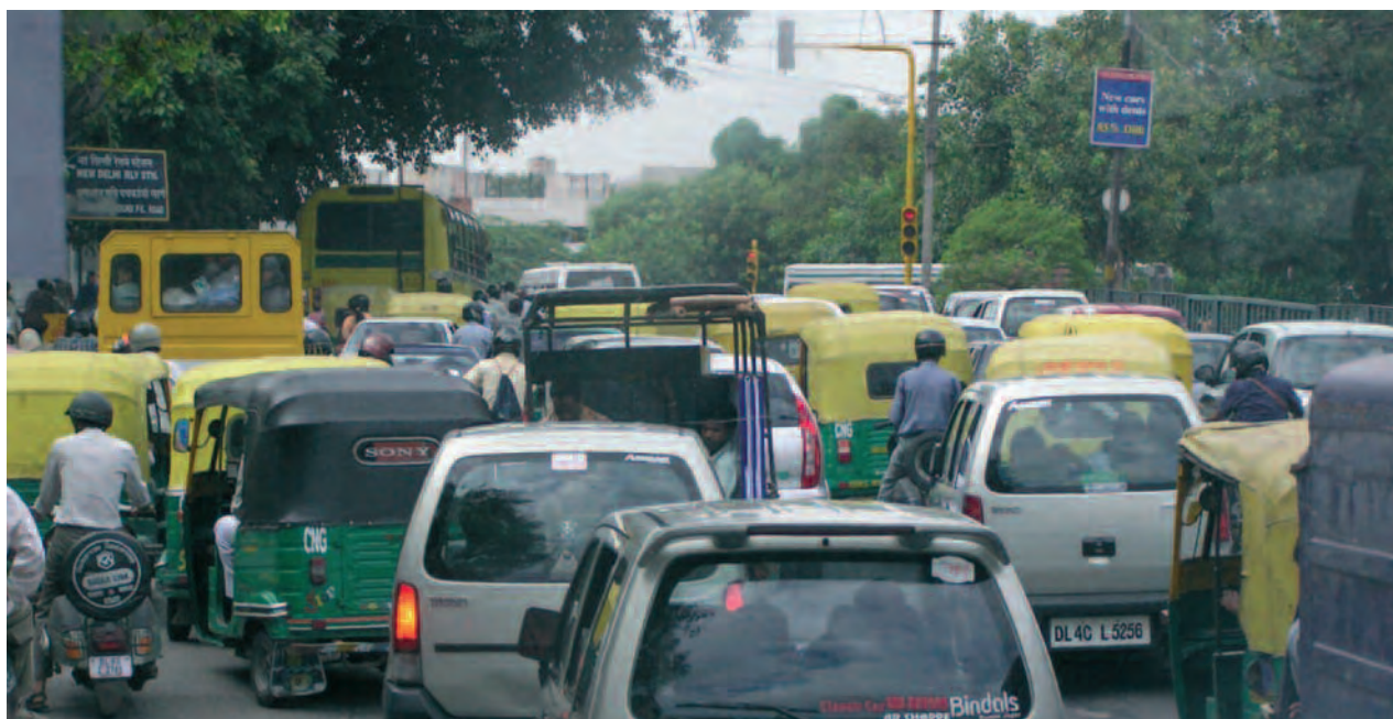
→ La demanda energética en el año 2030 será un 55% mayor que en la actualidad. La mitad de este aumento corresponderá a China y India. Foto del tráfico de Nueva Delhi (India).

bién por otros aspectos tan relevantes como la seguridad del suministro de energía, amenaza por la disminución de los principales recursos energéticos utilizados hasta ahora y el incremento constante de la demanda. Esta situación está llevando también a considerables incrementos de precio de los combustibles, sobre todo en el petróleo que ha superado en el último año la barrera de los 140 $/barril, impensable hace apenas un año, lo cual está causando impactos muy negativos en las economías de muchos países que tienen una alta dependencia energética de este tipo de combustibles.