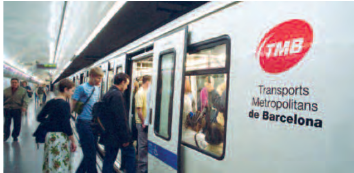
– El transporte es uno de los sectores clave en la lucha contra el cambio climático.

Para alcanzar estos objetivos, dentro de las seis líneas estratégicas de trabajo, el Gobierno se ha comprometido a presentar en los próximos meses un anteproyecto de Ley de Eficiencia Energética y Energías Renovables que facilitará ese