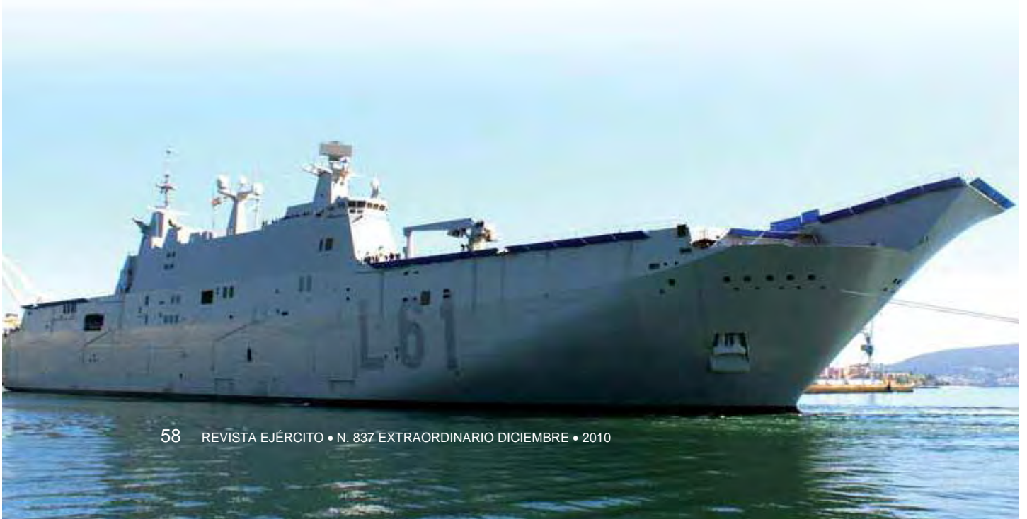
Buque de Proyección Extratécnica LHD Juan Carlos I (L-61)