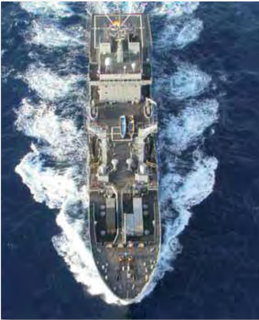
La Armada española participa actualmente en la operación Atalanta

que ha tomado la piratería en las aguas de Somalia no son comparables a otras zonas, no es un fenómeno exclusivo de Somalia.