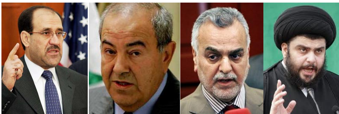
Los protagonistas internos: de izquierda a derecha, Al-Maliki, Allawi, Al-Hashimi y Al-Sadr

Ante esta postura del Primer Ministro iraquí Nuri Al-Maliki, el Presidente Obama anunció el día 21 de octubre de 2011 la retirada total a finales de ese año, completada cuando las últimas tropas cruzaron la frontera con Kuwait el 18 de diciembre. Atrás quedaron casi 4.500 soldados estadounidenses muertos, unos 30.000 heridos y mutilados, y más de un billón de dólares en gastos, además de un número enorme de civiles iraquíes muertos (por encima de los 100.000), víctimas principalmente de la violencia sectaria.