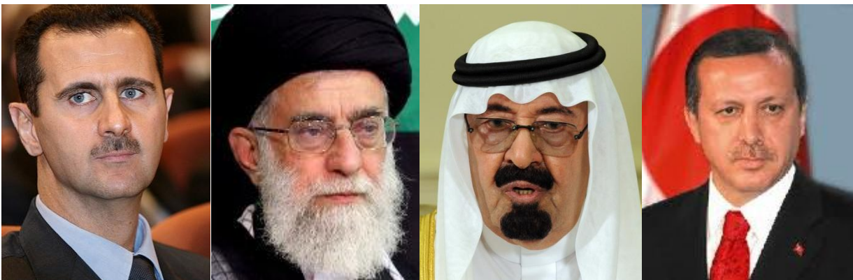
Los protagonistas externos: de izquierda a derecha, Al-Assad, Jamenei, Rey Abdallah y Erdogan

que iraquí, matiz que en el caso de líderes radicales como Al-Sadr es aún más acusado. Por ello, y a pesar de que analistas vinculados al Partido Republicano de EEUU mantienen la esperanza de que los chiíes de Irak no se dejen influir por Teherán 13 , la realidad parece apuntar todo lo contrario, esto es, un creciente ascendente de Irán sobre su vecino. De ser así, todo el sacrificio estadounidense en vidas de sus soldados y en recursos económicos habrían contribuido, paradójicamente, a crear una república hermana del Estado persa en las zonas chiíes de Irak, en un momento de máxima tensión con Irán por su programa nuclear.