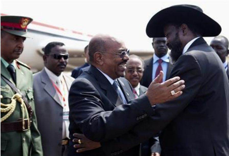
Salva Kiir (derecha) recibe a Omar al Bashir en el aeropuerto de Addis Abeba el 4 de enero, antes de su reunión para ratificar el nuevo acuerdo de paz.

El 5 de enero, tras dos intensas jornadas de debate entre las delegaciones de ambos países, los presidentes de Sudán y Sudán del Sur firmaron un nuevo y escueto acuerdo de paz, cuyo objetivo fundamental es desbloquear todos los compromisos adquiridos en septiembre de 2012 y, al menos, sentar las bases para resolver la disputa principal entre ambos países: la soberanía sobre la región de Abyei. Por este motivo, el informe sobre la reunión elaborado por el Panel de Alto Nivel de Implementación de la Unión Africana—que ejerce la mediación en este proceso y está liderado por el ex presidente de Sudáfrica, Thabo Mbeki— recoge, en muy pocas líneas, los resultados de los acuerdos referentes a las controversias fundamentales entre ambos países 2 .