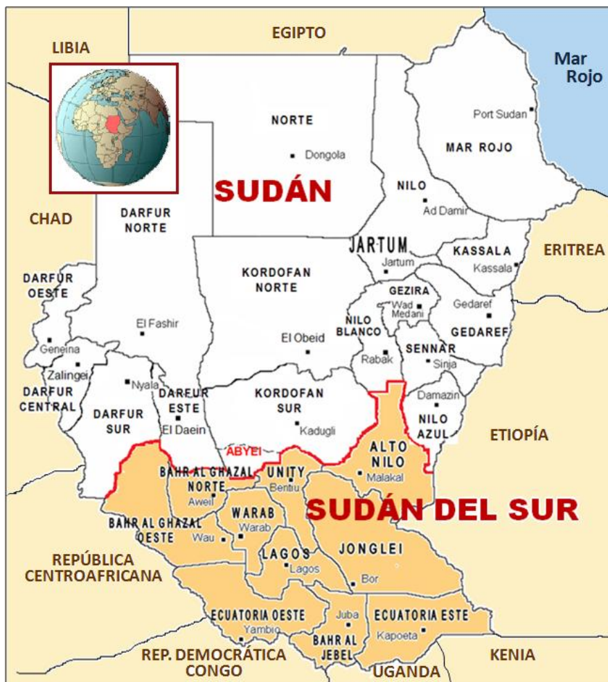
Plano: Sudán y Sudán del Sur después del 9 de julio de 2011

¿Avance hacia una paz duradera entre Sudán y Sudán del Sur? El 5 de enero, en Etiopía, los Presidentes de ambos países alcanzaron el último acuerdo de paz, pero su fiabilidad está – como siempre– en tela de juicio: todos los anteriores, desde la independencia del sur en julio de 2011, se han convertido en “papel mojado”. Sin embargo, dos parámetros –casi exigencias– condicionan este nuevo compromiso. Por un lado, la amenaza de la Comunidad Internacional, especialmente desde la Unión Africana y Naciones Unidas, de emprender acciones contra ambos países; y por otro, la paralización de la producción de petróleo, base fundamental y único sustento de la economía de Sudán y Sudán del Sur, que está causando un daño ya irreparable.