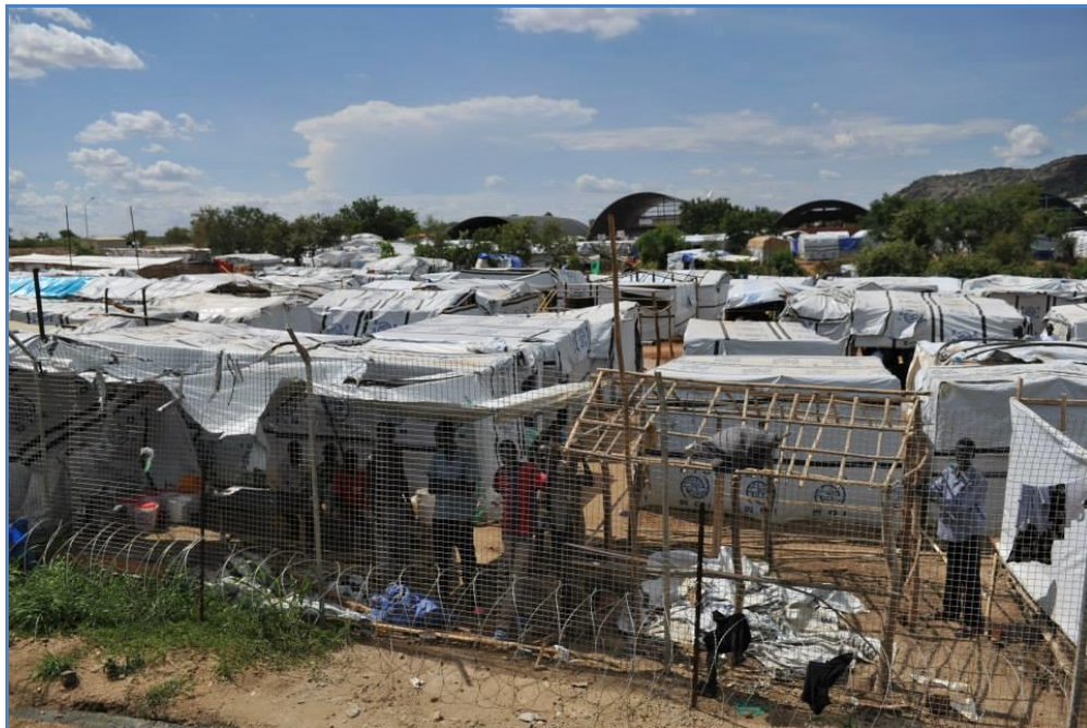
Más de 85.000 civiles se hacían en los campamentos de UNMISS

Mientras, la población indefensa –de todos los grupos étnicos– continuó refugiándose en las ocho bases que UNMISS despliega en todo el país. En marzo, estos campamentos improvisados ya albergaban a más de 85.000 civiles: «La política de abrir nuestras puertas – señaló Ban Ki Moon en Juba– como una opción de emergencia para salvar a inocentes es correcta y no tiene precedentes, pero supone un riesgo considerable para nuestro personal, para nuestras relaciones con las comunidades y para aquellos que tratamos de dar refugio». Una «opción sin precedentes» que ha salvado muchas vidas, pero que no ha impedido que continúen los ataques contra los que buscan refugio en los recintos de la Misión. El último y más brutal ocurrió en Bor, el pasado 18 de abril, donde dinkas armados asaltaron el campamento de Naciones Unidas, asesinaron a 58 e hirieron a más de 70 civiles de la tribu nuer 8 , sin que las fuerzas de UNMISS pudieran repelerlos.