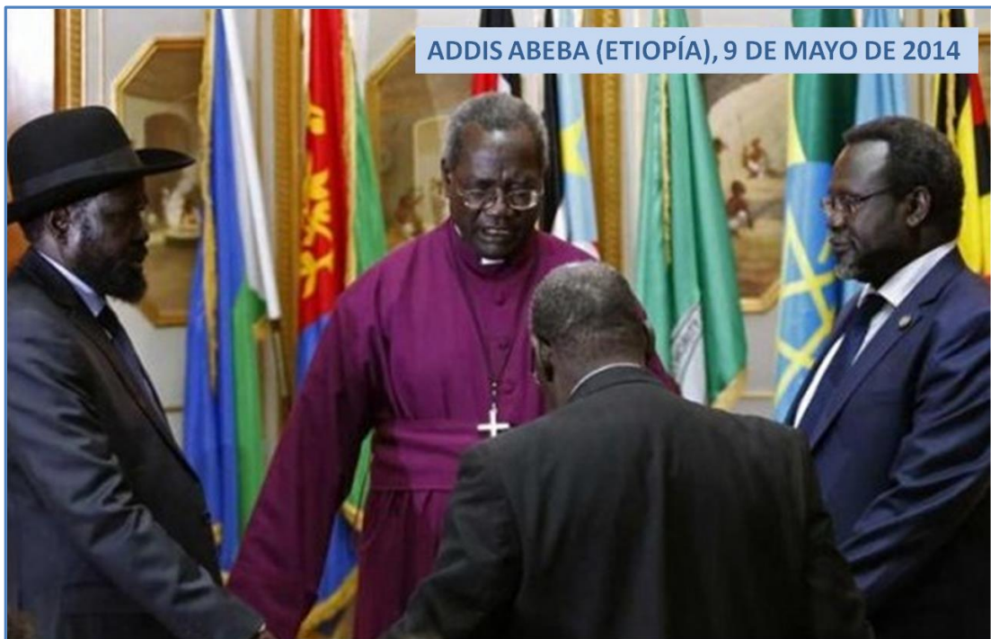
Salva Kiir (izquierda) y Riek Machar (derecha) durante la firma del segundo acuerdo de paz

Hasta la firma de este acuerdo, los intentos para alcanzar el fin de las hostilidades y consolidar un proceso político que ponga fin al conflicto han sido fallidos. El 23 de enero, gracias a la mediación internacional, el gobierno y las fuerzas insurgentes acordaron un inmediato cese de las hostilidades, la apertura de corredores humanitarios y la protección de la población civil. Sin embargo, las distintas facciones armadas nunca respetaron lo pactado y, lejos de aminorar, la venganza y las masacres tribales aumentaron en los meses siguientes.