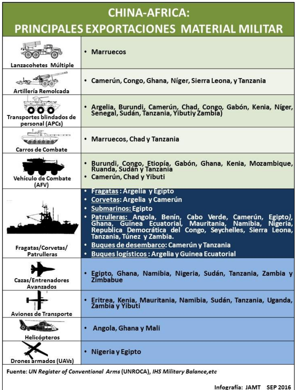
Figura 1: Principales Exportaciones de Material Militar

Un salto cualitativo lo ha marcado la aparición de imágenes de un Vehículo Aéreo No Tripulado (UAV 20 ) armado, de fabricación china (modelo CH-3), utilizado por las fuerzas