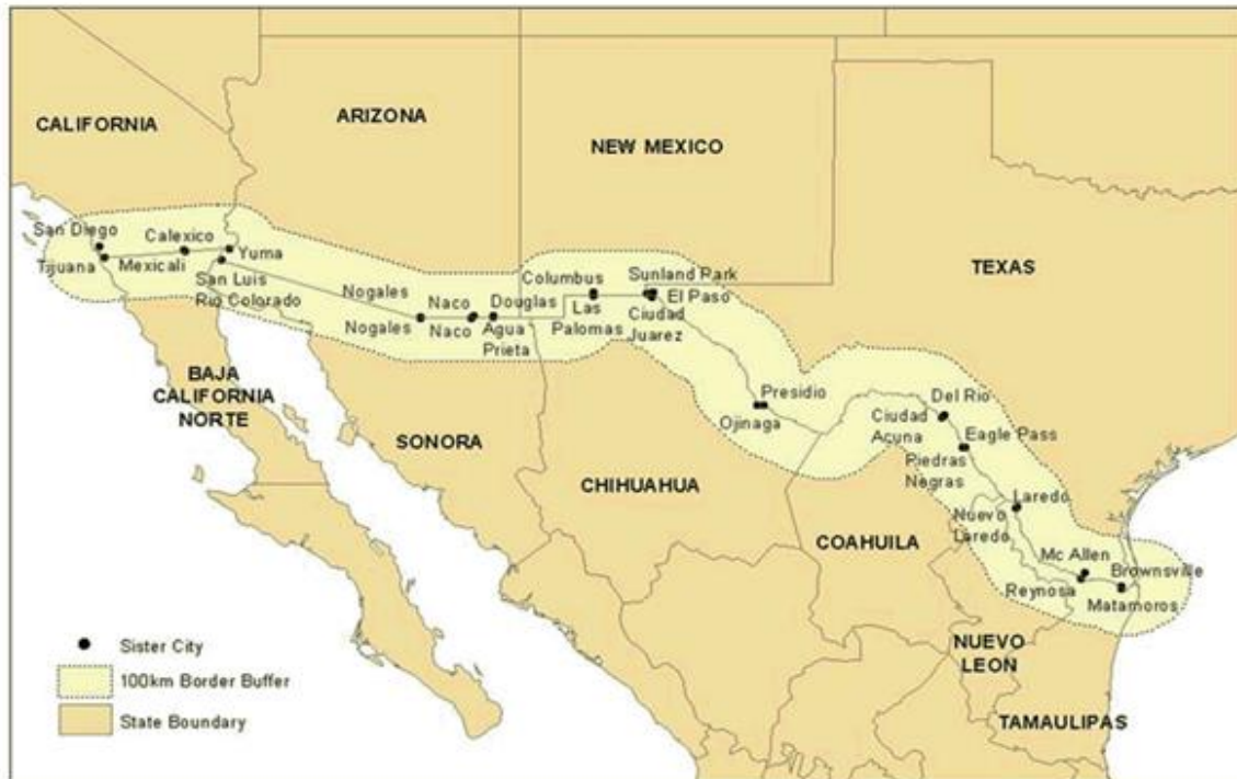
Imagen 1.- Ciudades Fronterizas.

En materia de seguridad, México está destinado a cooperar con EE.UU, en especial después del cambio que se produjo en la política de Washington a raíz de los ataques terroristas perpetrados el 11 de septiembre de 2001. Tras estos sucesos, la seguridad nacional se convirtió en la prioridad central de la política exterior estadounidense, reforzando la importancia de su frontera con México; temas directamente ligados a la seguridad como el combate al terrorismo, el crimen organizado y la migración irregular se posicionaron como fundamentales. Así, se produjo una “securitización” de la agenda internacional y una conexión directa con el fenómeno de la migración, de manera que a partir de entonces, los migrantes pasaron a ser vistos como una amenaza para el bienestar e incluso para la seguridad nacional, y México no ha sido ajeno a esa tendencia 7 .