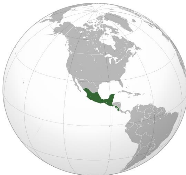
Imagen 2.- Mapa de Mesoamérica.

En la frontera sur de México se han producido cruces e intercambios permanentes propiciados por un origen multicultural común de diferentes pueblos indígenas y mestizos, el territorio llamado históricamente Mesoamérica. Esta región cultural comprende la mitad meridional de México , los territorios de Guatemala , El Salvador y Belice , así como el occidente de Honduras , Nicaragua y Costa Rica , como se aprecia en la imagen. Este espacio, que significa “América media”, se diferencia de otras regiones por la forma de vida de sus pobladores, su clima y su geografía.