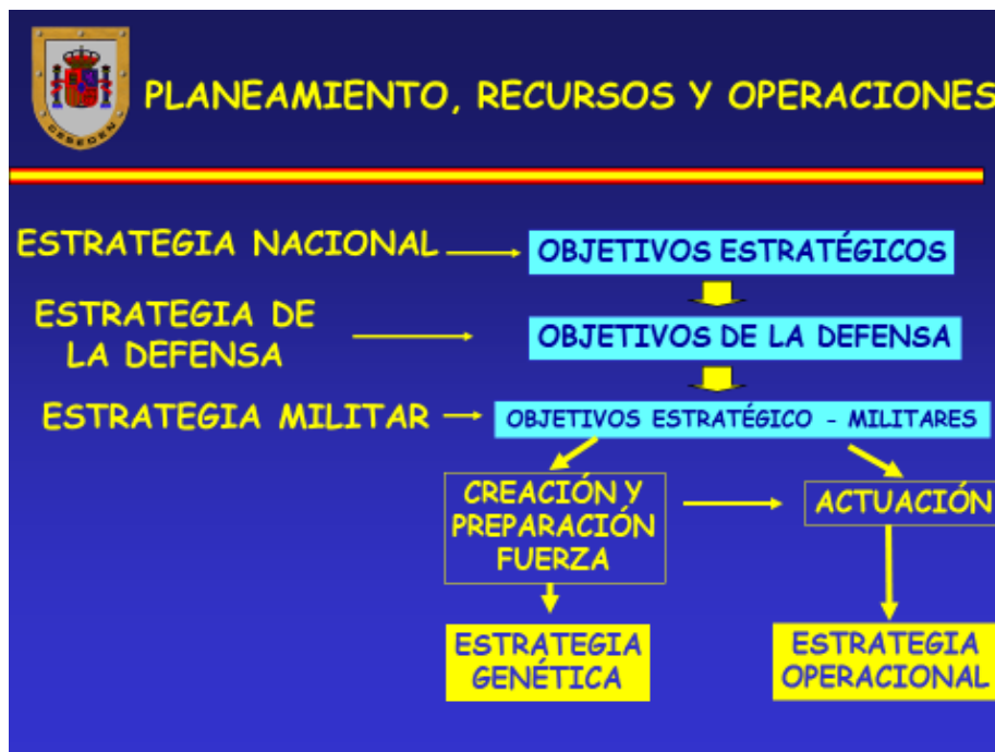
- Figura tres. Dimensiones de la estrategia militar. 21-

En cualquier caso resulta muy interesante el interés del mundo civil por la estrategia en el siglo XX cuando las telecomunicaciones han socavado las antiguas atribuciones del general en beneficio de la política toda vez la pérdida de autonomía de estos derivada de la geografía.