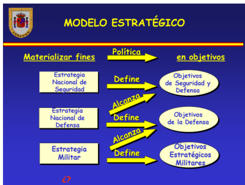
- Figura 2. Modelo Estratégico 5 -

Existe un encadenamiento entre los distintos niveles de decisión que produce su alineamiento. La estrategia define los medios militares para alcanzar los fines políticos. Para el nivel operativo, estos medios militares se transforman en objetivos a alcanzar, para lo cual define así mismo los medios operaciones que han de contribuir a su logro y que, igualmente, quedan fijados como objetivos tácticos, lo que obliga a ese nivel de decisión a definir los medios tácticos necesarios para alcanzarlos. Todo ello da coherencia al conjunto del sistema. Los medios se encuentran en el propio nivel, mientras los objetivos están en el nivel superior. Es la vocación de servicio estratégico, la concatenación estratégica.