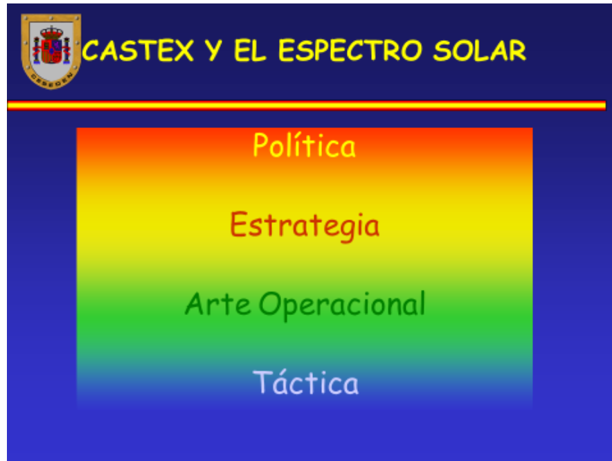
- Figura 1. Castex y el espectro solar 4 -

En fin, el nivel de decisión más bajo es el táctico, que proviene de un sentido próximo y básico: el tacto, de ahí la palabra contacto. Estamos ante la realidad cruda y tangible. El “ arte operacional ” sería la transición entre la estrategia y la táctica, que podríamos definir como el arte de ordenar las acciones tácticas para alcanzar o contribuir a la consecución de objetivos estratégicos.