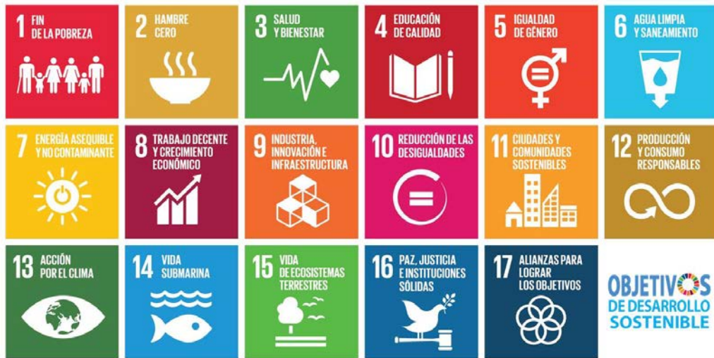
Figura 16.