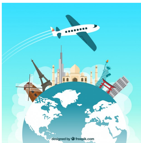
Figura 15. Fuente: "<a href='\"https://www.freepik.es/fotos-vectores-gratis/viajes\"'>https://www.freepik.es/fotos-vectores-gratis/viajes">Vector de viajes creado por freepik - <a href='\"http://www.freepik.es\"'>www.freepik.es</a>