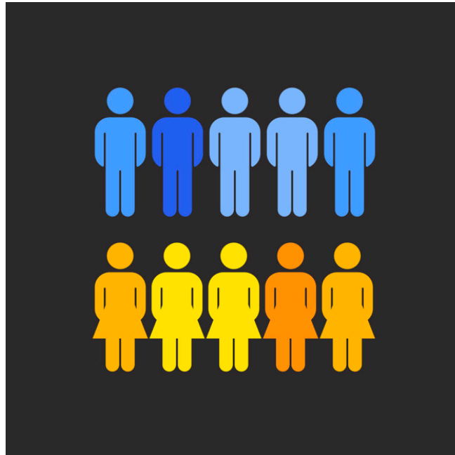
Figura 12.