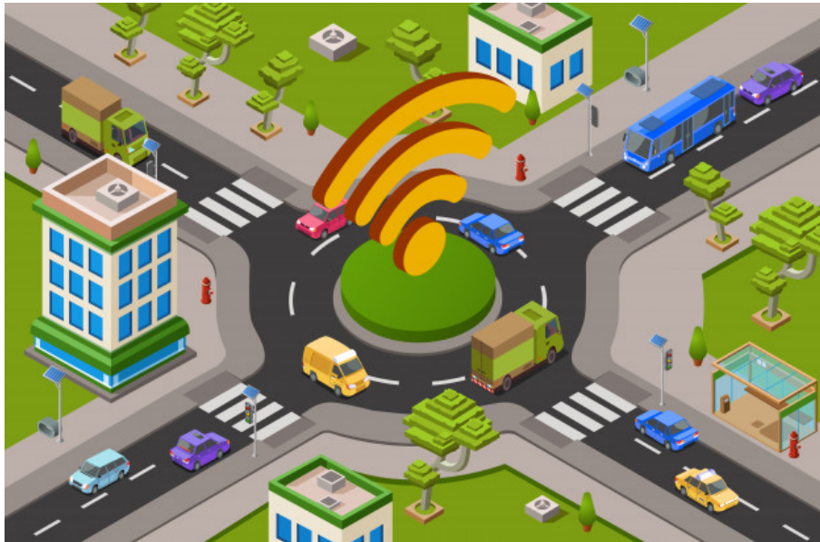
Figura 4. Fuente: " https://www.freepik.es/fotos-vectores-gratis/coche ">Vector de coche creado por vectorpouch - www.freepik.es </a>