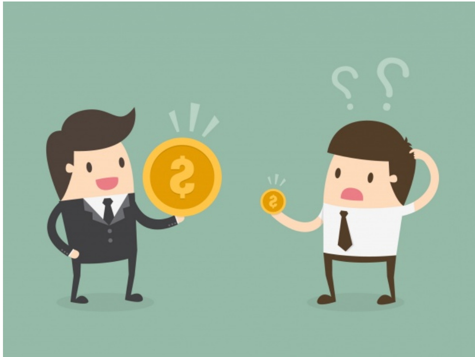
Figura 8: