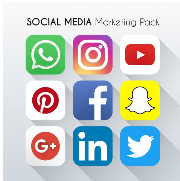
Figura 9. Fuente: " https://www.freepik.es/fotos-vectores-gratis/logo ">Vector de logo creado por quinky - www.freepik.es </a>