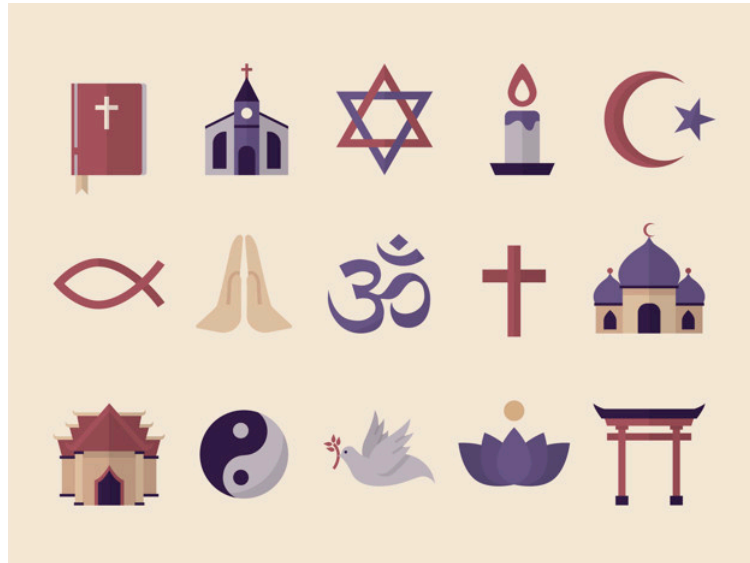
Figura 10.