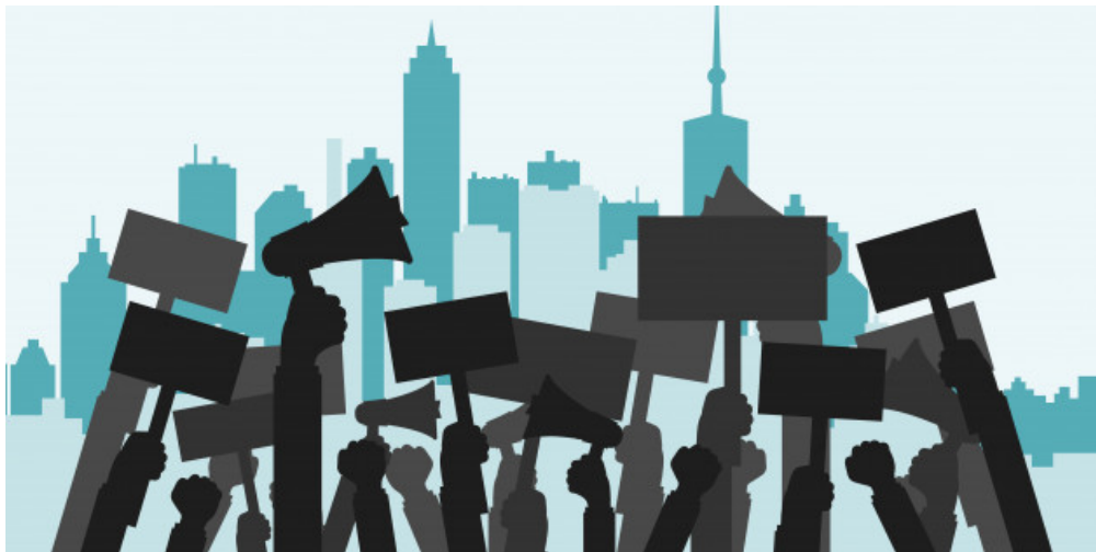
Figura 6.