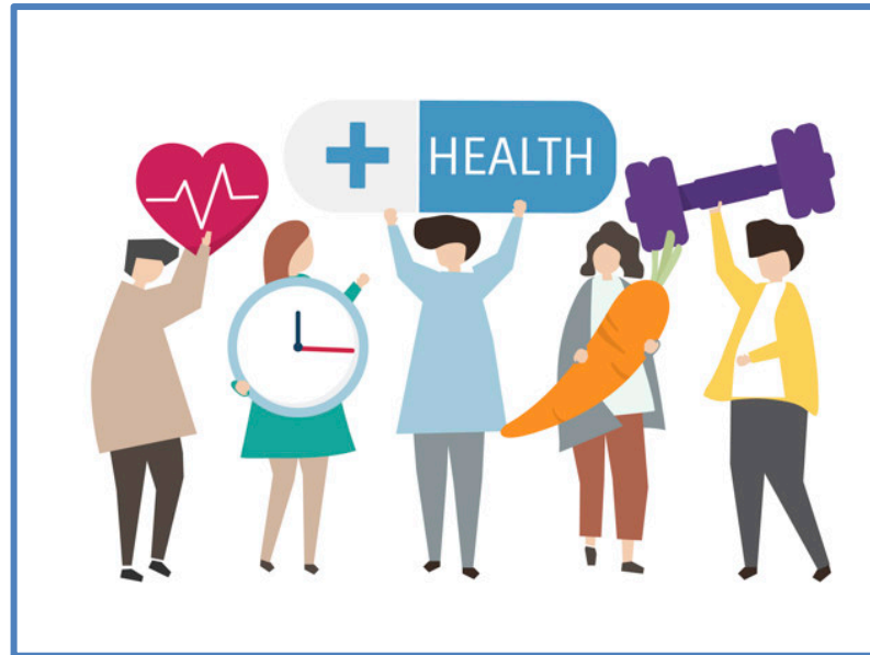
Figura 11: Fuente: https://www.freepik.es/fotos-vectores-gratis/comida ">Vector de comida creado por rawpixel.com - www.freepik.es </a>