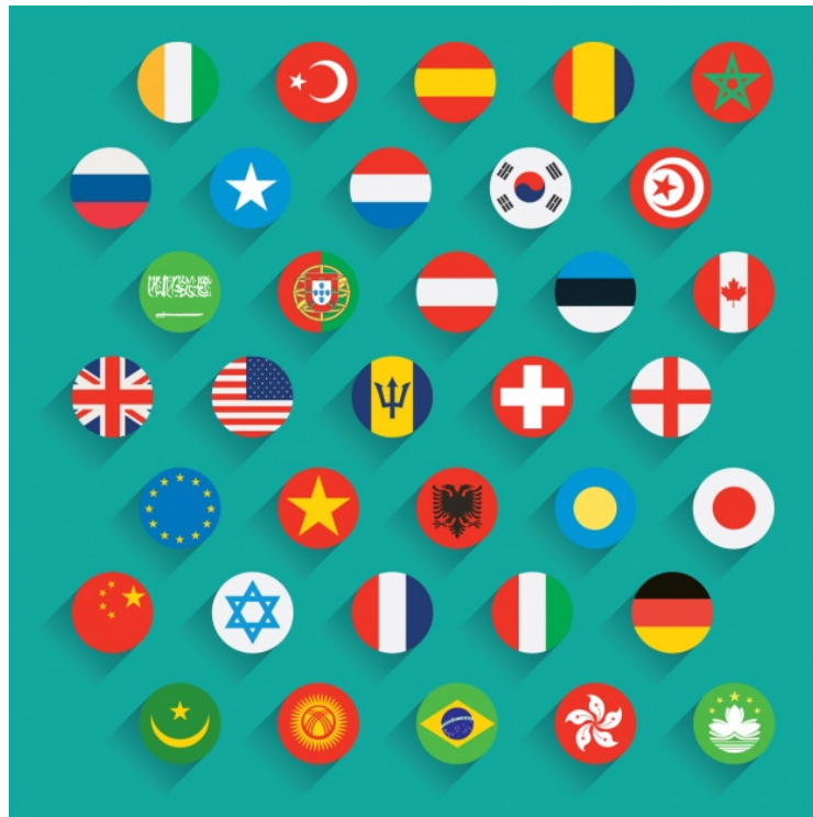
Figura 17: