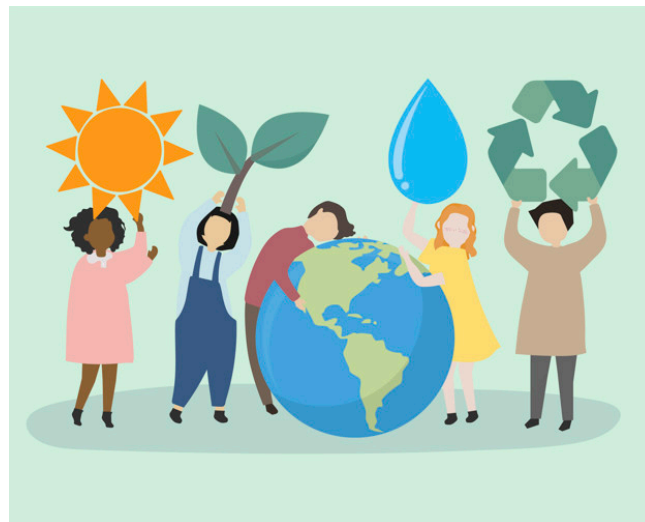
Figura 1: Fuente: https://www.freepik.es/fotos-vectores-gratis/fondo ">Vector de fondo creado por rawpixel.com - www.freepik.es </a>