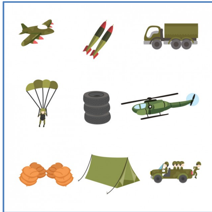
Figura 3. Fuente: https://www.freepik.es/fotos-vectores-gratis/camion ">Vector de camión creado por terdpongvector - www.freepik.es </a>