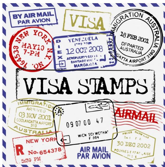
Figura 13. Fuente: " https://www.freepik.es/fotos-vectores-gratis/etiqueta ">Vector de etiqueta creado por vvstudio - www.freepik.es </a>