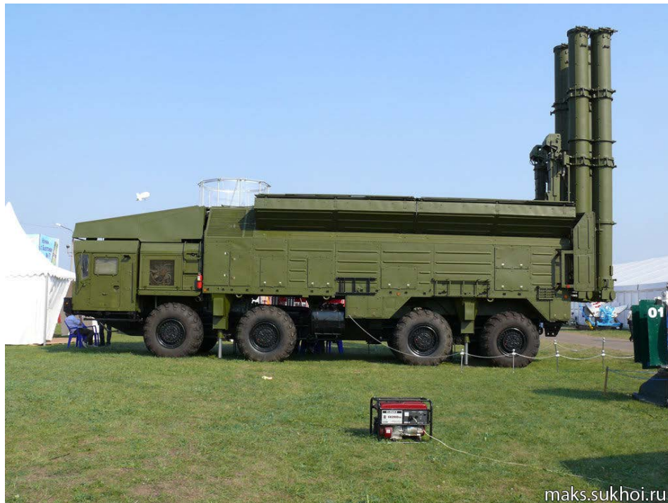
Figura 1: “Lanzador R-500 Iskander-K 9M728 (SS-C-7)” .

El escándalo saltaría en la prensa estadounidense en 2017 cuando se acusó a los rusos de poseer dos batallones de misiles de crucero 9M727/SSC8 desplegados, operativos con cuatro lanzadores por batallón y con capacidad de ser municionados varias veces. Dichos misiles estarían fuera del Tratado INF y su localización era verdaderamente difícil, debido a la movilidad de las unidades que lo poseían en dotación 18 .