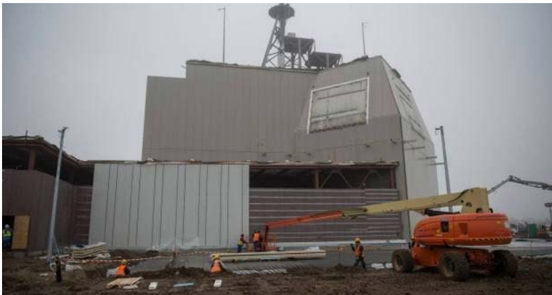
Figura 2: Construcción del sistema antimisil Aegis en Rumanía.

Al informe estadounidense respondería el ministerio de Exteriores ruso con una nota en la que se exponía que EE. UU. había realizado acusaciones sin proporcionar evidencias, para crear una imagen negativa de Rusia. Por su parte, se atribuía a los estadounidenses el haber realizado pruebas con tecnología que se podría aplicar a misiles de medio alcance o a fabricar vehículos aéreos no tripulados de ataque. Pero la más seria acusación se basaba en el despliegue de EE. UU. de los sistemas Aegis Ashore con lanzador MK-41 en Rumanía y Polonia, debido a que estos sistemas antiaéreos podrían disparar misiles Tomahawk 21 .