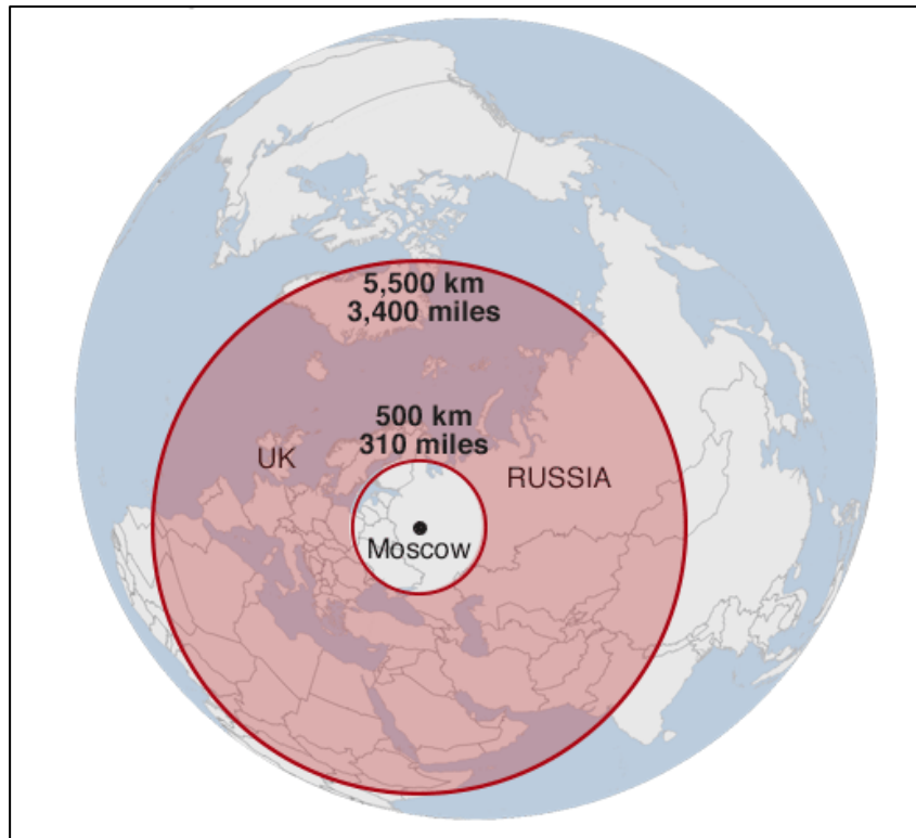
Figura 4: Alcances no permitidos por el tratado INF desde territorio ruso. Fuente: BBC, INF treaty: “Russia ‘will respond’ to new US missiles in Europe”, 24 October 2018, disponible en: https://www.bbc.com/news/world-europe-45971537 . Fecha de la consulta 26/12/2018

ha cerrado filas junto a su aliado norteamericano, posicionándose el secretario de Defensa británico, Gavin Williamson, quien afirma que Rusia se burla del Tratado INF 39 .