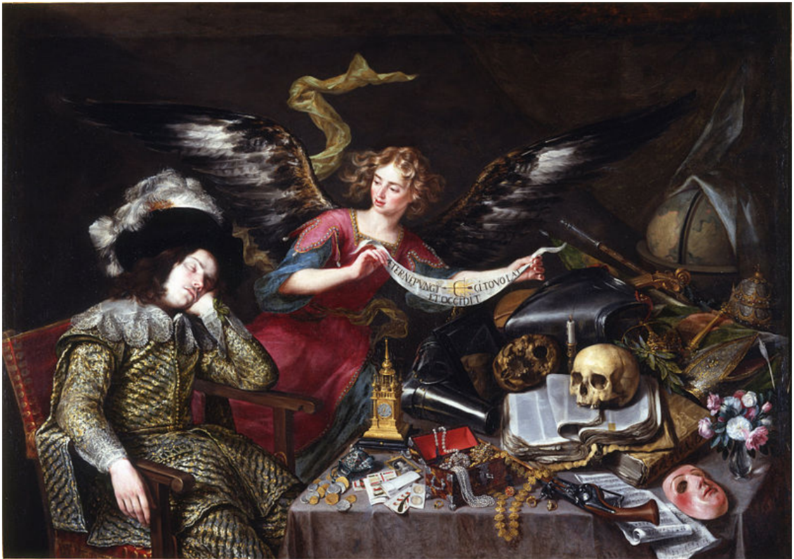
Figura 1: El sueño del caballero (Antonio de Pereda). Real Academia de Bellas Artes de San Fernando