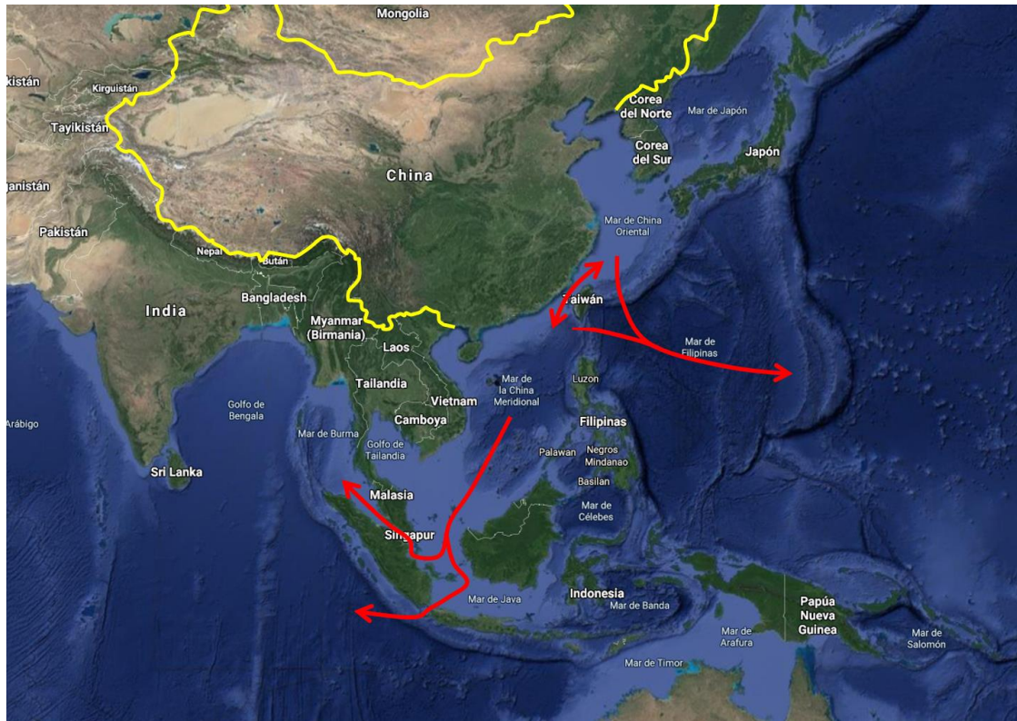
Figura 2. Geoestrategia china de acceso a los océanos Índico y Pacífico.

En 1989, con la crisis de Tiananmén, devino el primer gran contratiempo. El ELP intervino contra los manifestantes, dañando su imagen tanto dentro como fuera de sus fronteras. China ha sufrido desde entonces un riguroso embargo de armamentos por parte de las potencias occidentales. La supervivencia del régimen y el temor a la injerencia extranjera reforzaron su prioridad estratégica.