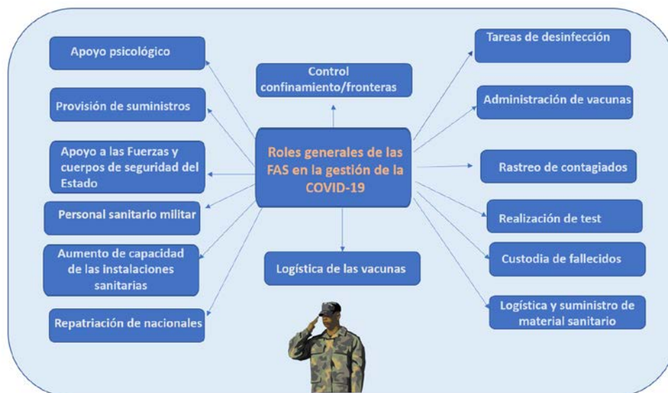
Figura 2. Roles generales de las FAS en la gestión de la COVID-19. Fuente. Elaboración propia.

Las FAS han demostrado en todo el mundo el valor añadido —de eficacia y versatilidad— que aportan frente a nueva situación de inestabilidad como la que ha generado la pandemia de la COVID-19. En este sentido, la OTAN tiene claro que, para continuar siendo una organización militarmente fuerte, las FAS de los países aliados deben transformarse para desarrollar nuevas capacidades para hacer frente a un entorno de seguridad. Es necesario revisar, incluso la propia estructura militar de la OTAN, así como sus fuerzas, capacidades y doctrina para responder a los riesgos potenciales, de los cuales, la pandemia de la COVID-19 es un claro ejemplo 24 .