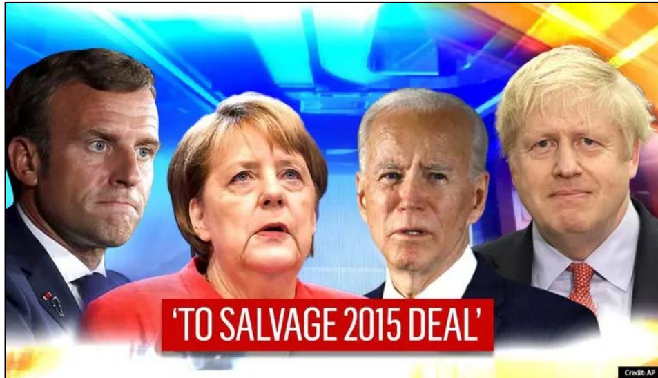
Figura 2. Imagen de los líderes europeos junto al presidente Biden para salvar el acuerdo nuclear. Fuente. “Iran Nuclear Deal: UK, France, Germany, US Diplomats To Hold Talks On JCPOA Revival”, Republicworld.com , 18th February, 2021. Disponible en: https://www.republicworld.com/world-news/rest-of-the-world-news/iran-nuclear-deal-uk-france-germany-us-diplomats-to-hold-talks-on-jcpoa-revival.html (Consultado 25/04/2021).

La nueva orientación estadounidense constituye una gran incertidumbre para Israel, donde se considera que no tiene sentido intentar volver a un acuerdo que ha fallado con la falsa esperanza de un resultado mejor. Para Netanyahu, la única solución es el mantenimiento de una política de intransigencia hacia las armas nucleares, además de compartir con los Estados del Golfo la necesidad del mantenimiento de las sanciones contra los iraníes. Sin embargo, las agendas israelitas y de los países del Golfo no son exactamente iguales. Por su parte, Arabia Saudí atraviesa tiempos convulsos que han debilitado su estatus y teme a una situación de conflicto abierto 35 .