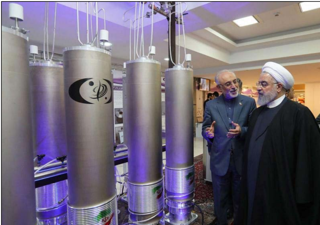
Figura 1. El presidente iraní, Hassan Rohani y el presidente de la agencia iraní de energía atómica, Ali Akbar Salehi, junto a centrifugadoras de uranio. Fuente. “Iran nuclear deal: Why do the limits on uranium enrichment

A finales de año, los iraníes ya se encontraban enriqueciendo uranio con centrifugadoras avanzadas, no incluidas entre las permitidas en el PAIC. Los países europeos del Grupo P5+1 intentaron evitarlo emitiendo un serio comunicado de advertencia a los iraníes, por el que podrían poner en funcionamiento el «mecanismo de disputas» del acuerdo, por el que se pueden aplicar de nuevo las sanciones si algún miembro permanente del Consejo de Seguridad de las Naciones Unidas no considera que estas deban ser levantadas 11 .