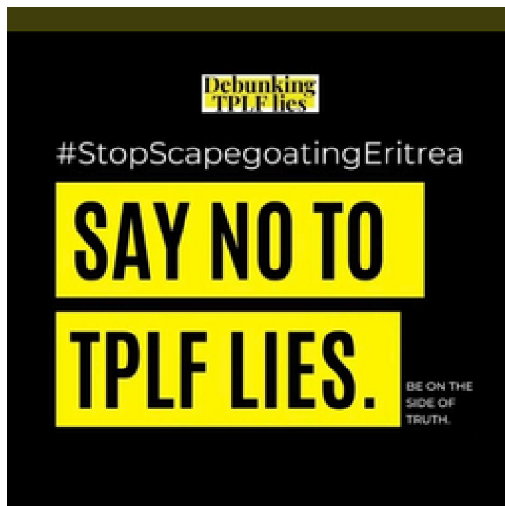
Figura 6. Ejemplo de meme calificando la información del partido de Tigray de mentiras.