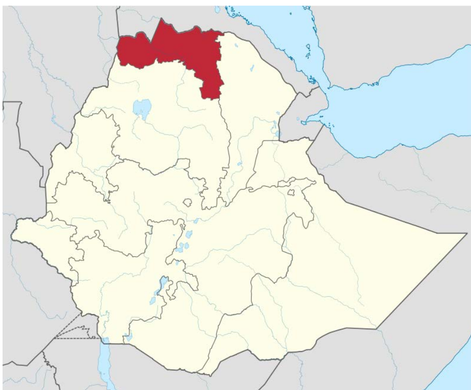
Figura 4. Región noreste de Tigray en Etiopía. Como se puede observar hace frontera con Eritrea, al norte.

Desde el principio del conflicto observadores internacionales han acusado de Eritrea de injerencia, llegando Estados Unidos, importante aliado de Etiopía, a declarar en el mes de enero que «todas las tropas eritreas debían abandonar Etiopía de manera inmediata» 12 .