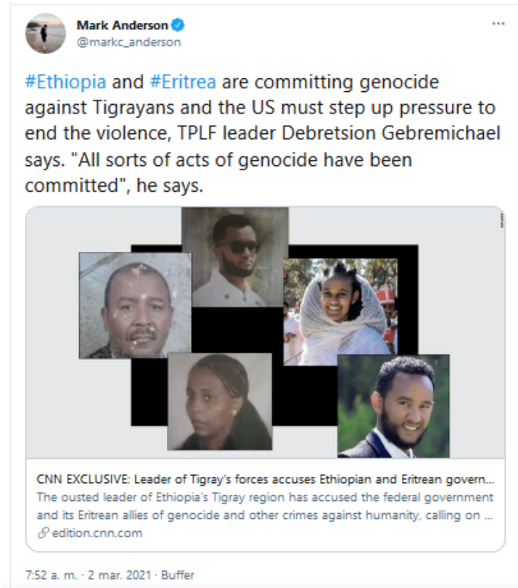
Figura 5. Ejemplo de meme informativo acusando a los gobiernos de Etiopía y Eritrea de genocidio.