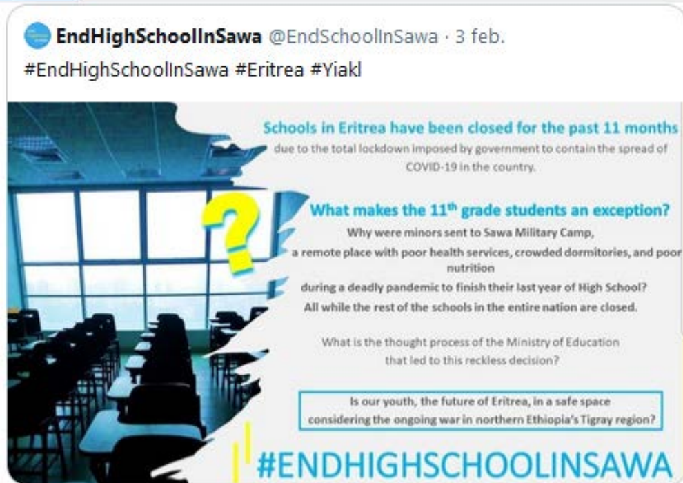
Figura 2. Otro ejemplo de la campaña social que priva a los y las jóvenes de completar sus estudios.