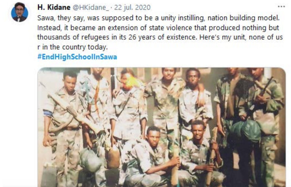
Figura 1. Ejemplo de la campaña social en contra de la militarización de Eritrea.