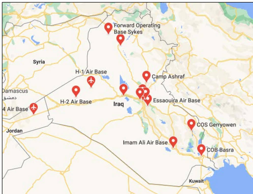
Figura 6. Situación de las bases estadounidenses en Irak.

La situación de las fuerzas norteamericanas en Irak constituye una significativa capacidad de combate, centrada sobre el nudo de comunicaciones de Bagdad, en las que se apoyan las posiciones avanzadas en Siria. La Base Avanzada de Operaciones de Skyes en Tall' Afar cierra el corredor de movilidad de la zona norte del puente terrestre.