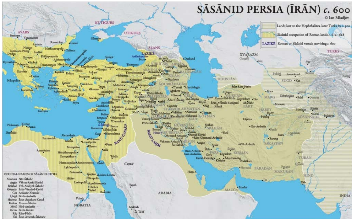
Figura 1. Imperio sasánida hacia el siglo VI.

Trasladando estos conceptos hasta los tiempos recientes, Irán poseía una estructura que facilitaba su expansión hacia el oeste debido a que en la década de los ochenta había creado la organización Badr, durante la guerra con Irak, como un conjunto de milicias chiíes en el territorio iraquí y en cuya formación participó activamente el expresidente iraní, Mahmoud Ahmadinejad. La dirección de esta organización se apoyaba en la Fuerza Quds, de los Guardianes de la Revolución Islámica iraní o Pashdarán.