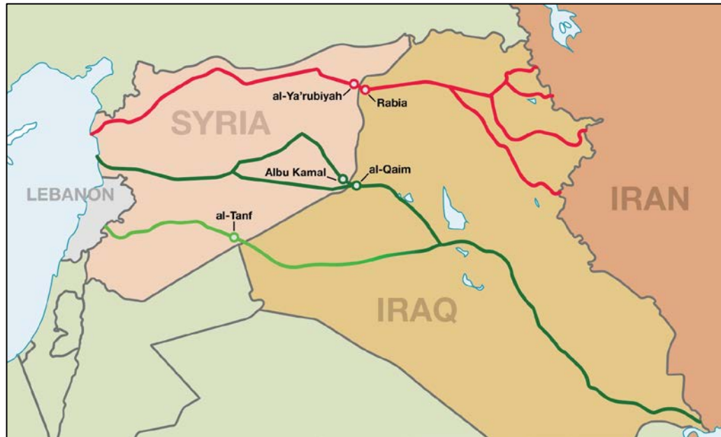
Figura 2. Rutas principales del puente terrestre iraní en el Oriente Próximo.

y, por último, serviría para reafirmar la identidad chií en toda la región a través de una vía de comunicación en la que se intercambiasen todo tipo de productos y se pudiesen enlazar a las comunidades afines dispersas por todo el Oriente Próximo 14 .