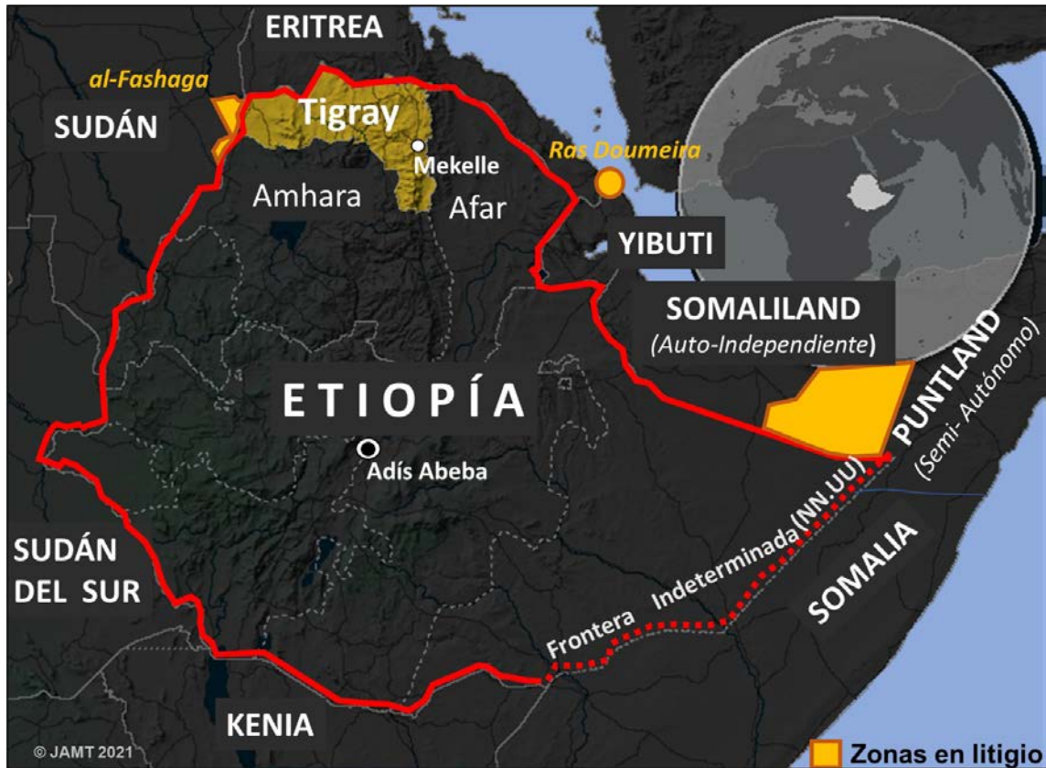
Figura 2. Mapa de Etiopía: Ubicación de Tigray.

A partir del 2015, debido al enorme malestar social, se sucedieron una serie de protestas y revueltas, encabezadas por la etnia mayoritaria oromo . La hegemonía del EPRDF duró hasta el nombramiento en 2018 del primer ministro Abiy Ahmed, primer oromo en acceder al cargo, que inició un proceso de transición democrática y apertura, con reformas políticas y económicas. Estas reformas no consiguieron acabar con las divisiones y la violencia étnica que, de hecho, han aumentado y provocado que Etiopía se encuentre actualmente sumida en una grave crisis 8 .