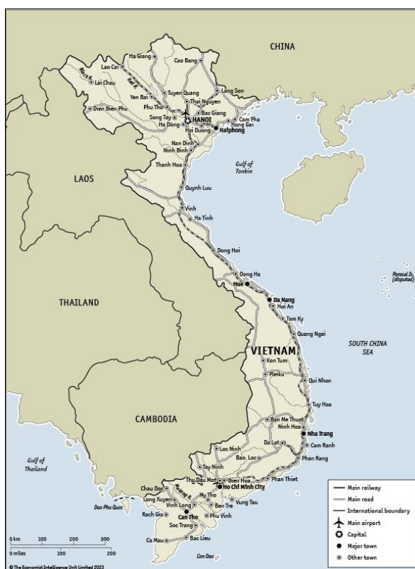
Figura 1. Mapa actualizado de la República Socialista de Vietnam y sus principales centros y vías de comunicación

modernizar Vietnam respetando la ortodoxia política pero liberalizando la economía, con la esperanza de conseguir un crecimiento en consonancia con el de algunos países cercanos —China en particular— y abrir la nación al exterior, intención materializada simbólicamente en su entrada en la Asociación de Naciones del Sudeste Asiático (ASEAN, por sus siglas en inglés) en 1995. Vietnam se ha convertido en uno de los países desarrollados del área, pero con desigualdades y pobreza, algo paradójico en un Estado oficialmente comunista 2 .