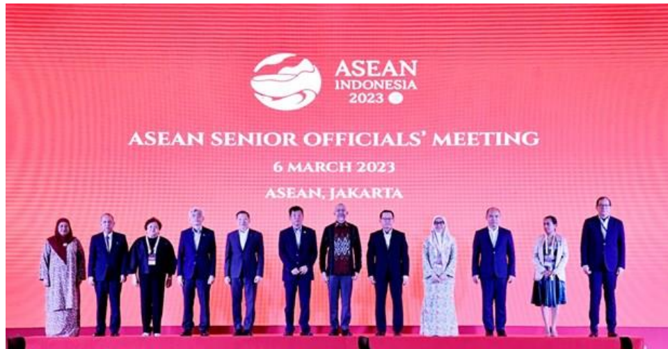
Figura 8. Los representantes de los países del Sudeste Asiático que conforman ASEAN posan en la reunión celebrada el pasado 6 de marzo en Indonesia

En clave interna, en Vietnam parece prioritaria la represión de la corrupción instalada en la Administración, una posible fuente de protesta social contra el régimen; esta lucha también se interpreta como una forma enmascarada de purgar las diferencias dentro del PCV. La corrupción será una cuestión prioritaria para el nuevo Gobierno del presidente Thuong, en la estela del todopoderoso secretario general, Trong. Permanece la incógnita de si este último optará a un cuarto mandato en 2026. Puede que los inversores extranjeros que ahora se instalan en Vietnam también perciban al país como un socio no fiable en el caso de que sigan estallando escándalos de corrupción. Para estas empresas existe una amplia oferta de países donde establecerse en la región, empezando por China.