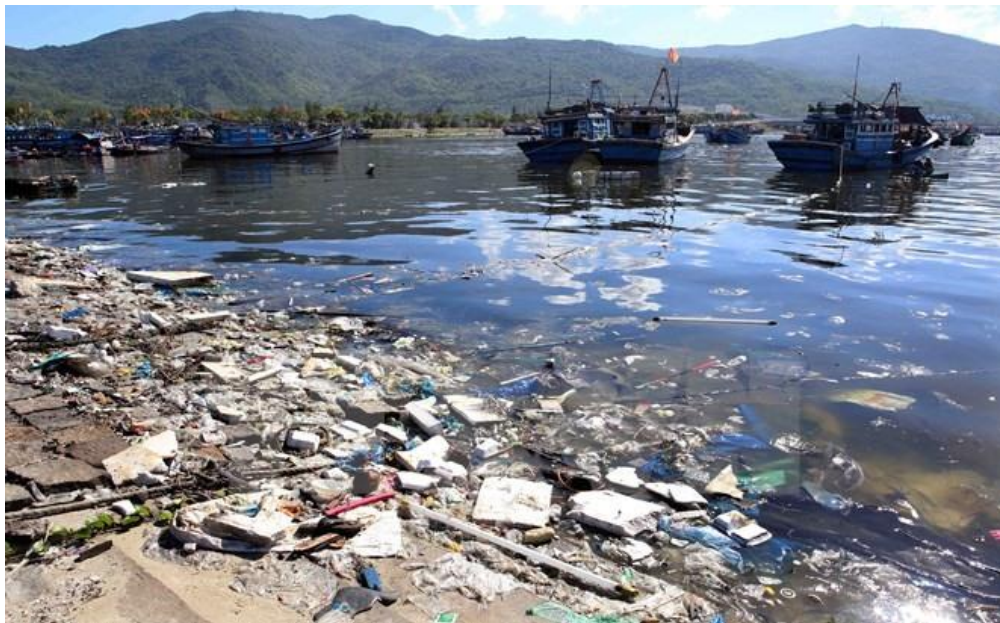
Figura 5. Los 3.500 kilómetros de costa vietnamita son de los más contaminados a nivel global y constituyen un problema que exige una resolución urgente por parte del Gobierno

Tailandia y Camboya, antes de desembocar en el gran delta del sur de Vietnam, uno de los mayores del mundo. Existe una creciente inquietud entre los países afectados por el comportamiento de China, embarcada en la construcción de enormes presas en el inicio del cauce. Vietnam es el país más preocupado por ser el último en recibir estas aguas y teme una «diplomacia de la llave de paso», que sería devastadora para la agricultura y el abastecimiento de energía eléctrica en la principal región productora del país, con Ho Chi Minh a la cabeza: la antigua Saigón, considerada la capital económica de Vietnam 20 .