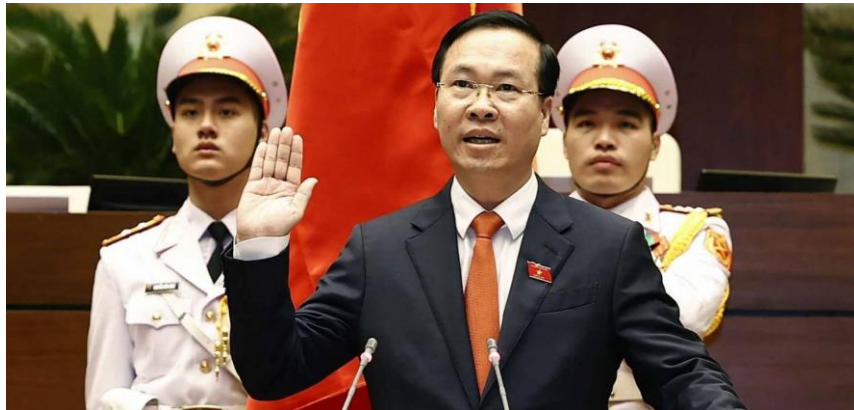
Figura 2. El nuevo presidente de Vietnam, Vo Van Thuong, jurando su cargo ante la Asamblea Nacional el pasado 2 de marzo