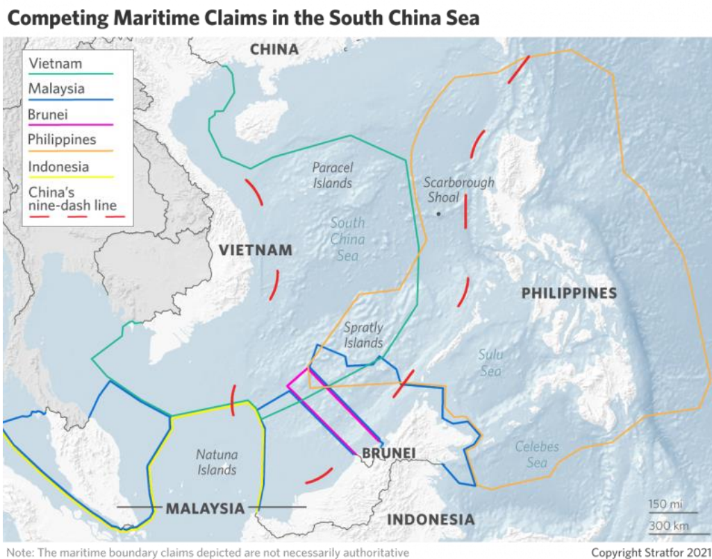
Figura 6. Contenciosos en el mar del Sur de China, con la soberanía sobre las islas Paracelso como principal punto de fricción entre Vietnam y China

Vietnam reclama para sí la soberanía de las islas Hoang Sa y Truong Sa, conocidas en Occidente como Paracelso y Spratly, perdidas en una breve guerra con China en 1974. La disputa aumenta de tono en algunas épocas. La última y más grave crisis se produjo en 2014, cuando la empresa estatal china National Offshore Oil Corporation realizó prospecciones petrolíferas a 120 millas náuticas de la costa vietnamita. Ambos países desplegaron buques de guerra sin mayores consecuencias, pero sí fueron graves los fuertes disturbios contra intereses chinos que estallaron en Hanói: dos ciudadanos chinos fueron asesinados y las autoridades chinas evacuaron a otros miles de ellos 24 .