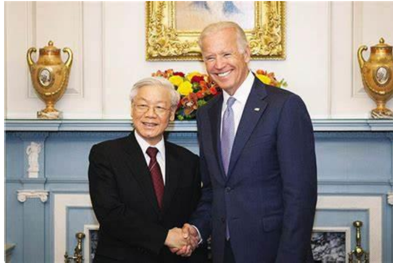
Figura 7. El secretario general del PCV, Phu Trong, estrecha la mano de Joe Biden en una visita a Washington en 2015, cuando Biden era vicepresidente de Estados Unidos

a las estadounidenses y además se tachó a Vietnam de Estado poco fiable y manipulador de divisas 30 .