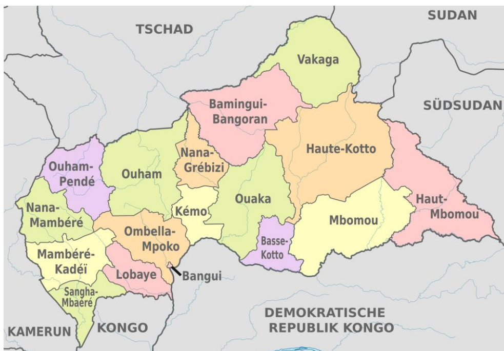
Figura 1. Mapa administrativo de la RCA.

En términos geográficos, RCA constituye una meseta situada en el África Central. Su localización no costera le obliga a abastecer su comercio mediante el río Ubangui, un afluente del río Congo. Limita con Camerún, el Chad, la República Democrática del Congo, el Congo, Sudán y Sudán del Sur.