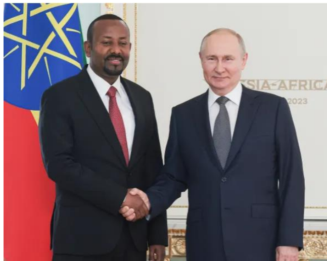
Figura 4. Abiy y Putin. Russia-Africa Summit, julio 2023.

Cabe contemplar la posibilidad de que Rusia, que no se ha pronunciado al respecto, apoye a Etiopía en este conflicto. La relación entre ambos países es buena, como también lo es con los hutíes, y la tensión en el mar Rojo perjudica profundamente a los países occidentales.