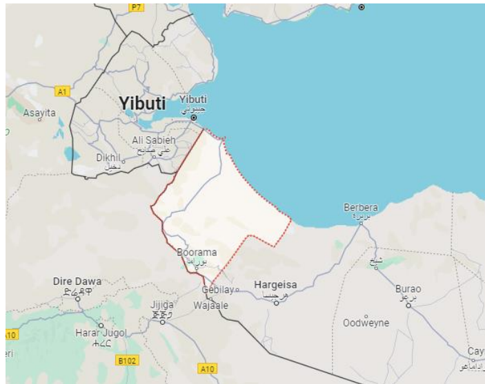
Figura 3. Localización de Awdal, región delimitada en rojo.

En caso de ser esto cierto, explicaría aunque quizá solo en parte, por qué parece resultarle a Abiy insuficiente o rechazable la salida al mar que desde Yibuti lleva tiempo utilizando a un alto precio. Yibuti le cobra a Etiopía más de mil millones de dólares al año en derechos portuarios, una suma enorme para un país con sanciones económicas y donde casi una quinta parte de su población depende de la ayuda alimentaria 19 . La posible compra de un puerto a Somalilandia mejoraría estas condiciones.