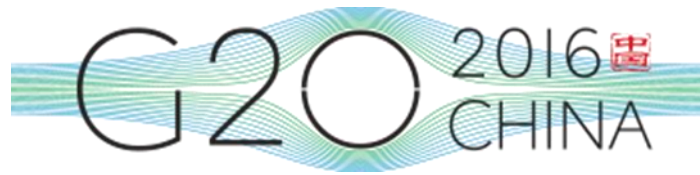
Ilustración 1 Logotipo Presidencia china G20 2016

Este año la presidencia del G20 ha recaído en la República Popular de China que ha organizado la cumbre de jefes de estado en la ciudad de Hangzhou los días 4 y 5 de septiembre.