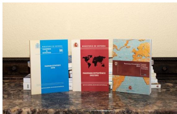
Figura 6: Colección Panorama Estratégico

Además de esta intensa acción en la difusión de la cultura de defensa en los diversos colectivos de la sociedad española, el IEEE también va consolidando una buena posición en el mundo académico y entre los expertos de seguridad y defensa, con la continuación de trabajos de investigación y análisis dedicados a la conformación de un pensamiento estratégico español. En este sentido, cabe destacar la colaboración con otros centros de pensamiento, tanto en la organización de seminarios como en la elaboración de publicaciones conjuntas. También se amplía la línea editorial con el comienzo de nuevas colecciones de publicaciones como el Panorama Estratégico en 1997 y el Panorama Geopolítico de los conflictos en 2011.