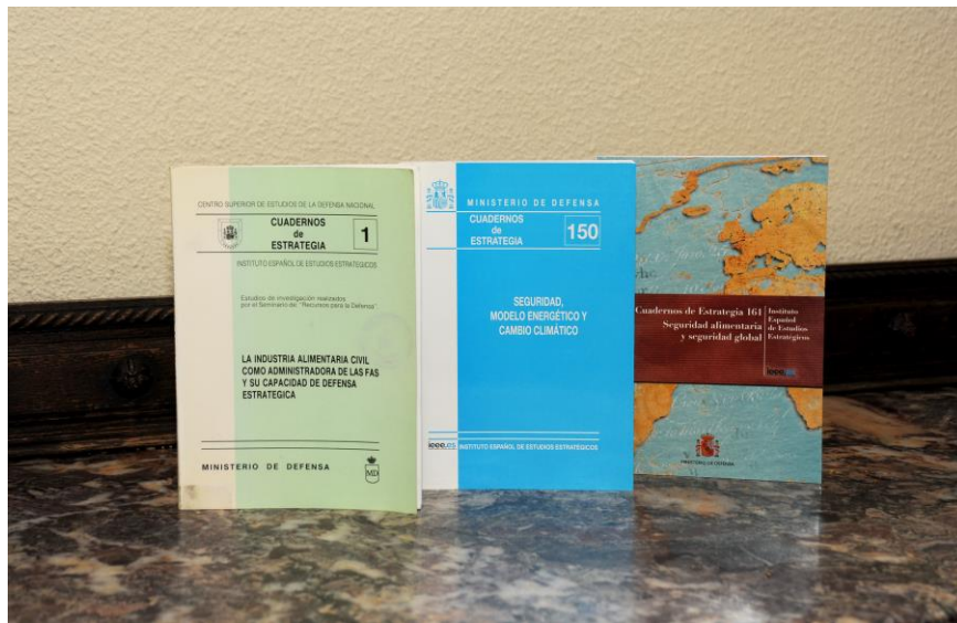
Figura 3: Serie Cuadernos de Estrategia