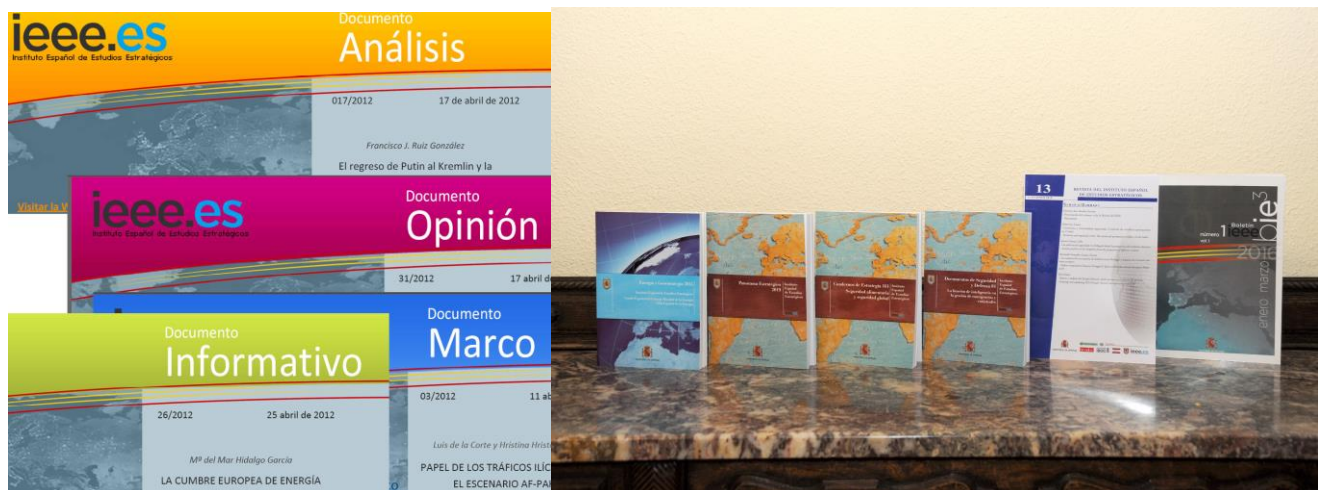
Figura 8: Publicaciones del IEEE

En esta etapa se produce el auge de los documentos de los analistas del IEEE y de colaboradores externos, disponibles en una web renovada y que se difunden a través del boletín semanal que cuenta con más de 30 000 suscriptores. Además, desde 2016 se crea la publicación bie 3 con el objetivo de recopilar todos estos documentos publicados diariamente en la página web del IEEE y ofrecerlos en una publicación de carácter trimestral, dentro del Programa Editorial del MINISDEF con su correspondiente ISSN.