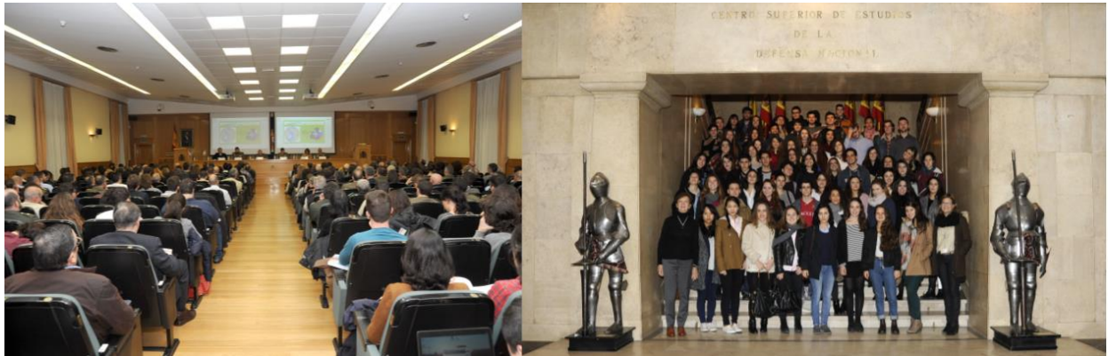
Figura 11: asistentes a un acto organizado por el IEEE (izda.) y visita de alumnos de la AUM

También continuamos estableciendo relaciones con las universidades para la realización de jornadas, publicaciones, cursos de verano y prácticas curriculares. Se fomentan asimismo las colaboraciones con centros de investigación nacionales e internacionales dedicados a temas de paz, seguridad y defensa, por su valor como multiplicador del pensamiento estratégico y como foros especializados en cultura de defensa.