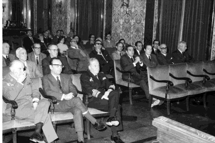
Figura 2: Seminario organizado en el CESEDEN

En sus primeros años, la actividad del IEEE se basa en la realización de conferencias y la publicación de actas de jornadas en colaboración con distintas universidades españolas. También se realizan estudios y publicaciones de carácter estratégico de uso interno. Poco a poco, el Instituto va ampliando sus funciones encargándose de la redacción del balance anual de situación en el Mediterráneo, la organización de seminarios, la edición de publicaciones relacionadas con la defensa nacional así como la redacción de diccionarios de términos militares.