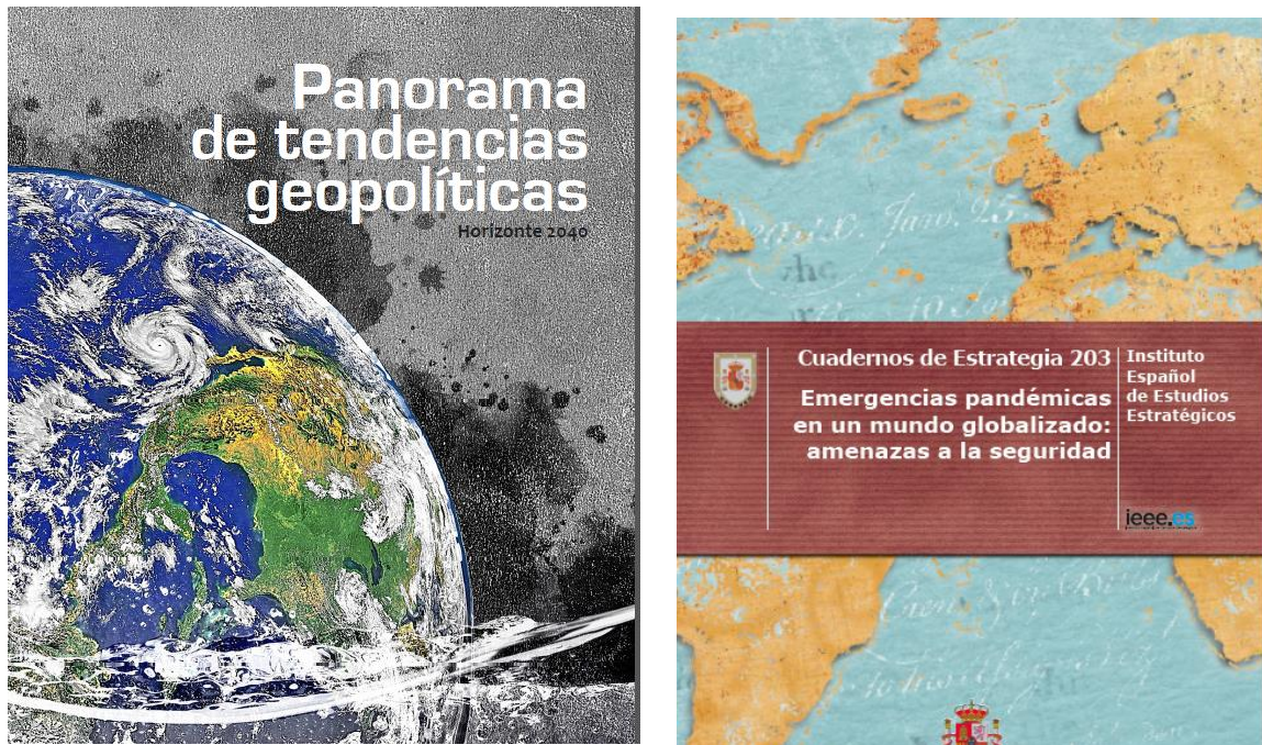
Figura 12: ejemplos de publicaciones recientes del IIEEE

Hemos visto que en los 50 años de vida del IIEEE, el mundo y la sociedad han cambiado mucho. El IIEEE ha ido recogiendo todos esos cambios en sus actividades y publicaciones, en un proceso de adaptación continua, porque si algo caracteriza al Instituto, y que ha quedado patente durante todos estos años, es que es una institución dinámica. Pero, ante todo, el IIEEE es un medio que ofrece a los ciudadanos la oportunidad de agregar a su cultura cívica la dimensión de la seguridad y la defensa. El IIEEE es una organización abierta a la participación de la sociedad a la que sirve. Todos juntos, analistas y colaboradores externos, seguiremos realizando estudios estratégicos, intentando vislumbrar el camino al que se dirige un mundo cada vez más complejo, observando cómo cambia el panorama geopolítico y analizando las consecuencias de los hechos que se sucedan.