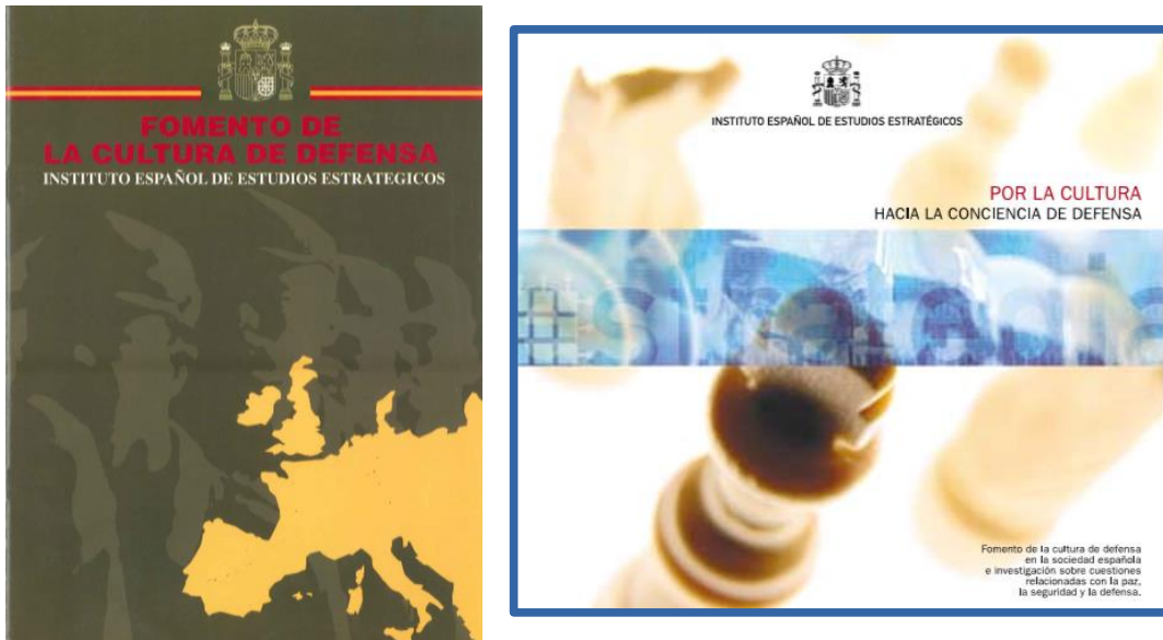
Figura 4: Material promocional del IIEE de 1997 (izda.) y 2004 (dcha.)

Durante esta etapa, la actividad del IIEE está enfocada, principalmente, a emprender acciones que contribuyan al fomento de la cultura de defensa. Para ello cuenta con un equipo multidisciplinar, integrado por personal civil y militar, hombres y mujeres. Es una etapa caracterizada por la apertura a la sociedad a todos los niveles, con la realización de múltiples y variadas acciones contempladas en todos los ámbitos del único Plan de Cultura de Defensa que ha existido en el Ministerio de Defensa y que se aprobó en— un lejano ya— 2003.