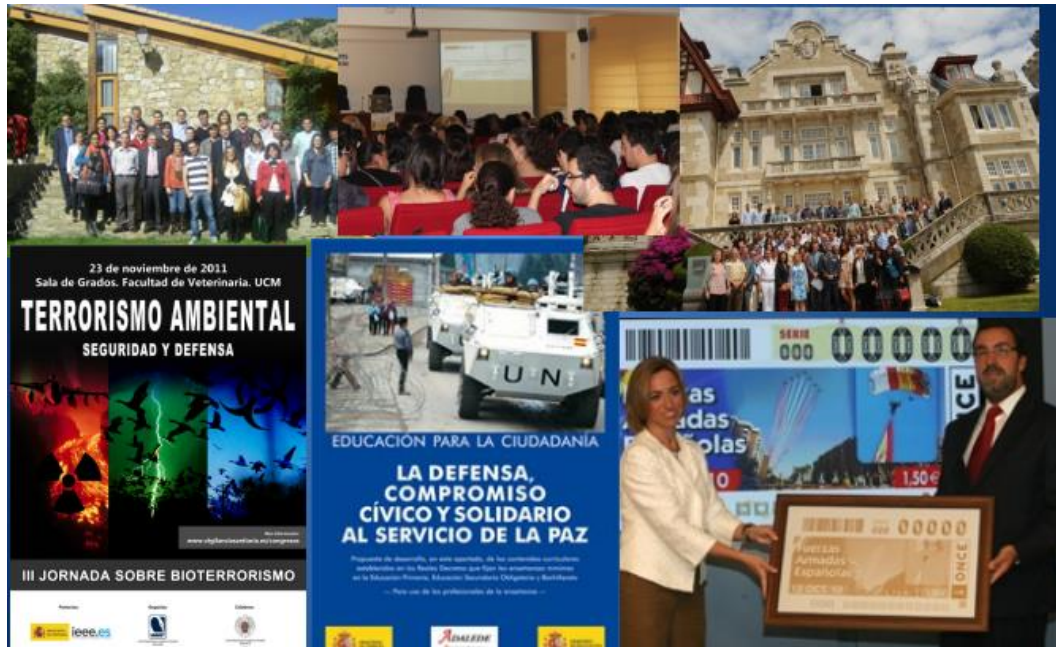
Figura 5: Actividades realizadas por el IEEE para el fomento de la cultura de defensa

El IEEE también establece convenios con distintos sectores de la sociedad —como la Fundación ONCE y el CERMI— y con otras administraciones públicas, como Comunidades Autónomas, con el propósito de llegar al mayor número de colectivos posibles, diseñando herramientas ad hoc para cada uno de ellos.