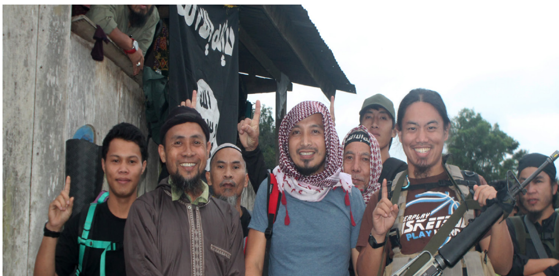
Figura 3. Isnilon Hapilon (segundo por la izquierda) Rumiyah, número 10, página 38.