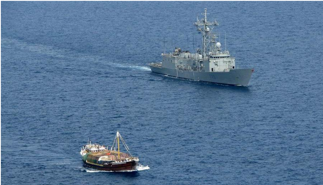
La fragata Navarra escoltando un dhow con un cargamento del PMA –Programa Mundial de Alimentos-

A lo largo de la historia han variado los métodos y manifestaciones de la piratería pero no su esencia: el atentado que representa contra un buque o aeronave -o contra las personas o cosas que se hallaren a bordo-, impidiéndole el legítimo ejercicio de los derechos reconocidos por el Derecho Internacional del Mar.