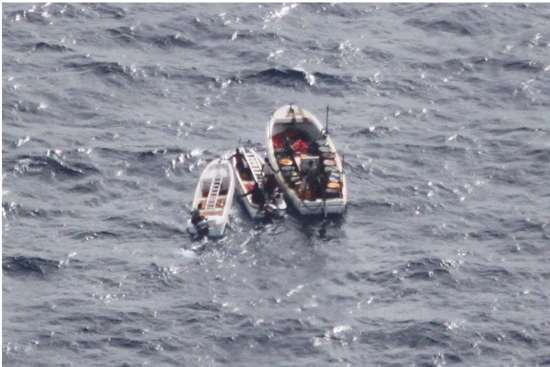
Indicios evidentes de grupo dedicado a la piratería

En la labor de prevención y disuasión que realiza la operación ATALANTA en aguas del Océano Índico, es muy frecuente la interceptación de embarcaciones que presentan claros indicios de dedicarse a la piratería, antes de que den inicio a un determinado ataque o abordaje o respecto de las que no se conoce si ya han participado en alguno de esos actos.