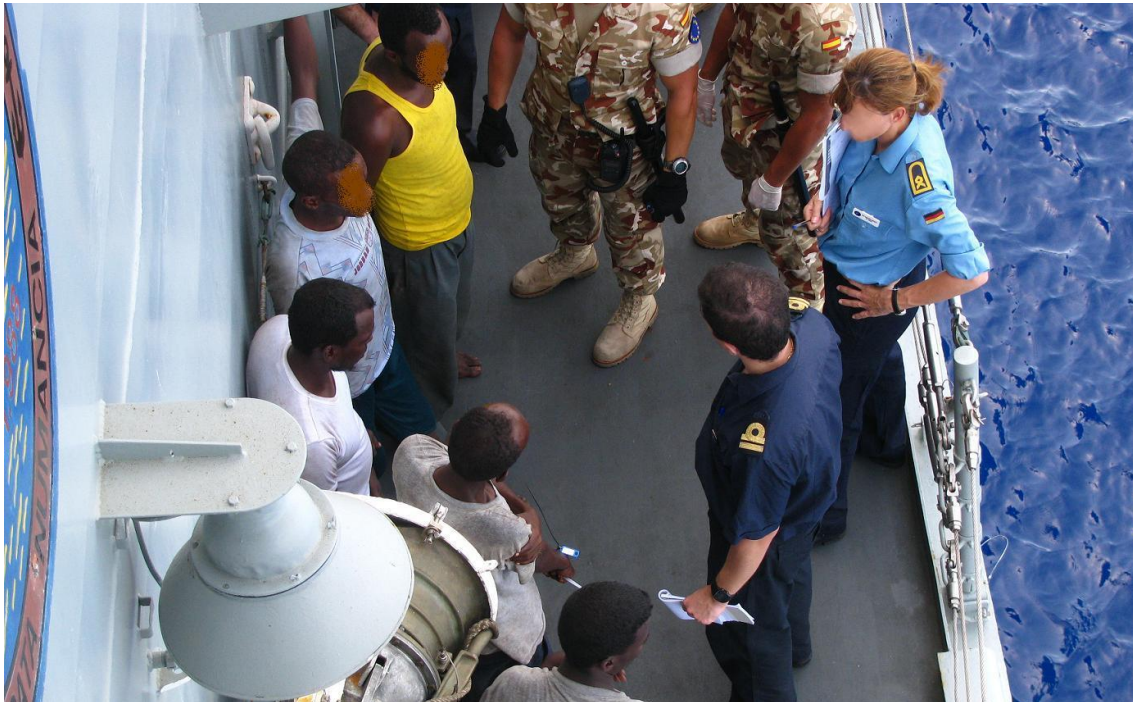
Interrogatorio en el Índico a bordo de la fragata NUMANCIA

En concreto nos referimos a aquellos casos de detenciones efectuadas por un buque de guerra español, en los que por producirse el delito fuera de aguas jurisdiccionales españolas, ser el puerto de arribada también extranjero y poseer tanto los presuntos delincuentes como las víctimas nacionalidad extranjera, no existe otro vínculo con España más que el del pabellón del buque de guerra que efectúa la captura, por lo que pudiera resultar aconsejable la cesión de jurisdicción a favor de los órganos judiciales de otro Estado.