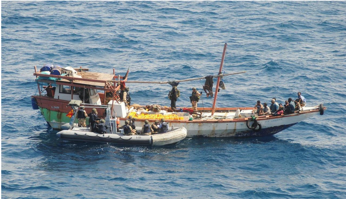
Fuerzas del GALICIA liberando el pesquero keniano SHERRY

Naturalmente, a la hora de determinar la competencia de nuestros órganos judiciales y del enjuiciamiento de cada uno de estos delitos, deberán tenerse en cuenta no sólo nuestras normas internas en su conjunto, sino también la regulación contenida en los instrumentos internacionales vinculantes para España.