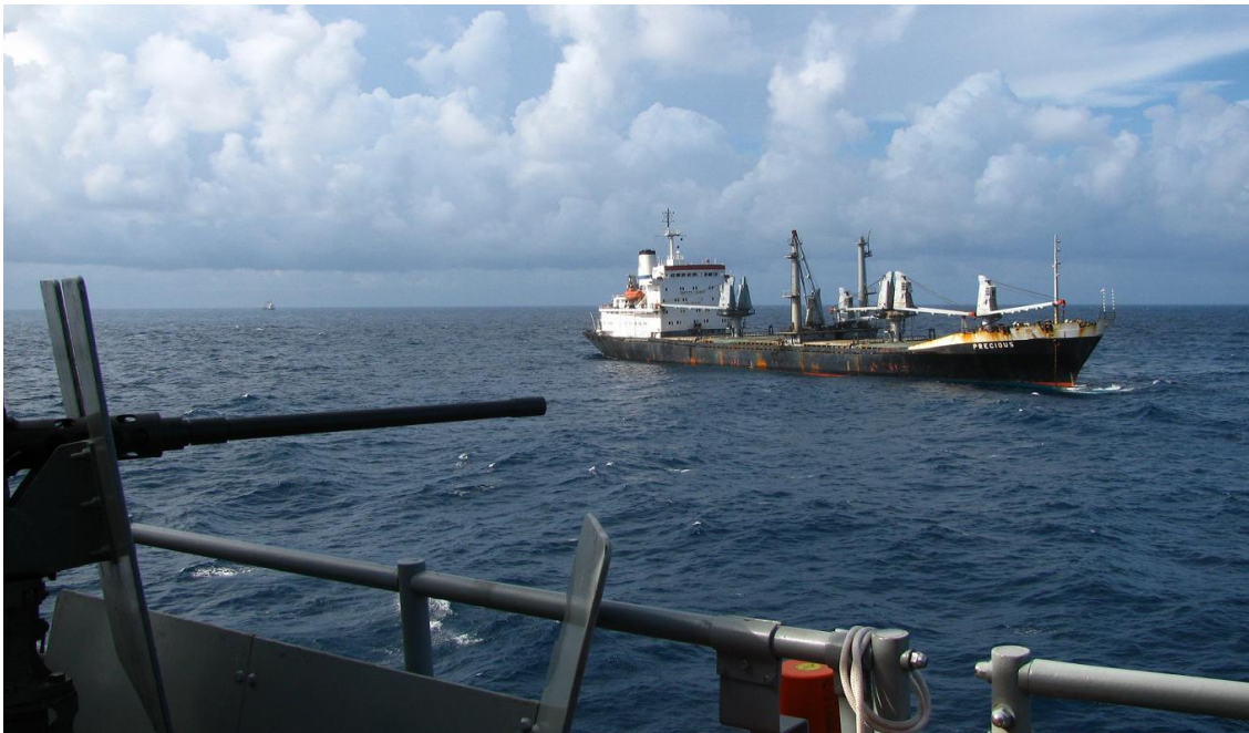
La fragata NUMANCIA escoltando el MV PRECIOS

Estado del pabellón del buque que haya realizado la captura, sea éste un Estado miembro de la Unión Europea o un tercer Estado que previo acuerdo con la Unión Europea participe en la operación. Pero también contempla un punto de conexión subsidiario, de forma que en el caso de que el Estado del buque que realiza el apresamiento no pudiera o no quisiera ejercer su jurisdicción, establece como segunda regla que los presuntos delincuentes y los bienes incautados podrán ser entregados a otro Estado miembro o a un tercer Estado que sí deseen ejercerla, con el requisito de que se hayan pactado con dicho Estado las condiciones de entrega, de manera conforme con el Derecho Internacional, en especial sobre derechos humanos.