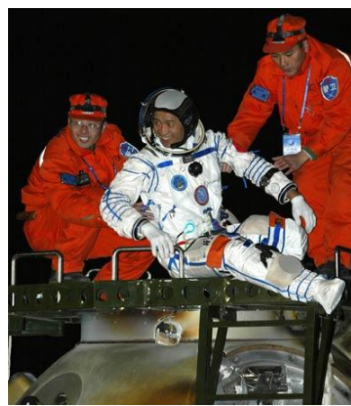
Nie Haisheng, piloto del segundo vuelo espacial tripulado chino

Algunos de éstos avances son el programa de caza indetectable al radar, el Chengdu J20 47 , actualmente en fase de pruebas de vuelo, la carrera espacial china, con la puesta en órbita de su propia estación espacial 48 , así como la construcción de su primer portaaviones, el exVaryag 49 soviético, de la clase Almirante Kuznetsov , comprado a Ucrania a través de una empresa turística domiciliada en Macao en 1998 y que se enmarca en la nueva estrategia china de Operaciones en Mares Lejanos 50 establecida por Hu Jintao para la Armada de la República Popular China. Todo ello nos descubre la genuina naturaleza de