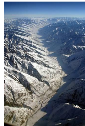
Fragmento del corredor Wakhan en Afganistán

Mención aparte merece Afganistán 91 , recientemente incorporado a la lista de aliados estadounidenses limítrofes con la República Popular China e importante ruta para los recursos energéticos procedentes del mar Caspio y Asia central en su camino hacia la India, Pakistán y China. En la frontera entre la RPCh y Afganistán se encuentra el paso Wakhjir , al Este del corredor Wakhan 92 , nexo físico entre ambos países que actualmente está cerrado 93 , no obstante varias empresas de la RPCh han comenzado a extraer en los últimos años recursos minerales en el país vecino, incrementándose lentamente los vínculos comerciales, a pesar de las dificultades provocadas por la destrucción del tejido productivo durante la última guerra 94 , librada a partir de 2001 95 . Asia-Pacífico es