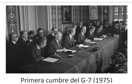
Primera cumbre del G-7 (1975)

Tras la crisis del petróleo de 1973 se hizo patente la necesidad de crear un organismo en el que quedaran representadas las mayores economías del mundo, que dispusiera de influencia financiera suficiente a nivel global como para intervenir en la dinámica económica mundial, con la meta de evitar crisis a nivel internacional.