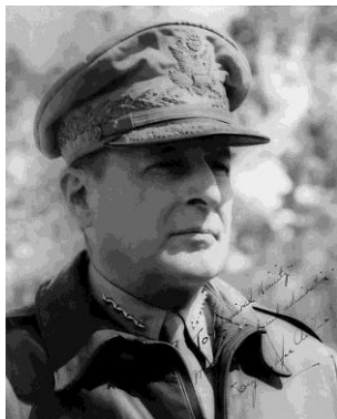
GoA Douglas McArthur con gorra mimetizada. Jefe de la Coalición de NU para Corea de 1950 a 1951

En la zona existen importantes actores tanto a nivel regional como internacional, con la República Popular China y Estados Unidos como actores fundamentales del presente siglo. La total inmunidad de la RPCh a la crisis desatada en 2007 abre una nueva visión positiva de sí misma para la opinión pública china. Los ciudadanos valoran mejor el sistema político-económico de la RPCh frente al tradicional paradigma 96 de desarrollo representado por Estados Unidos desde el comienzo del s. XX. Esto complicaría las posibilidades de la República Popular China de transformarse en una democracia, una vez consolidado un cierto desarrollo. Sin embargo, el Diálogo Estratégico y Económico EEUU-China ha impregnado 97 las relaciones regionales, convirtiéndose en factor de estabilidad 98 .