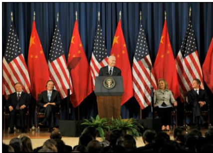
Discurso de clausura de Joe Biden en el Foro Estratégico y Económico de 2011

Del mismo modo que en rondas anteriores, se obtuvieron también resultados concretos en muy diversas áreas, haciéndose un gran esfuerzo por parte de la administración Obama en la determinación de hitos concretos alcanzados durante las conversaciones. Entre los acuerdos más importantes encontramos la creación del programa de becas 100.000 strong 38 para estudiantes estadounidenses y chinos, el impulso a las conversaciones entre militares estadounidenses y chinos, las conversaciones sobre política energética 39 , el compromiso por