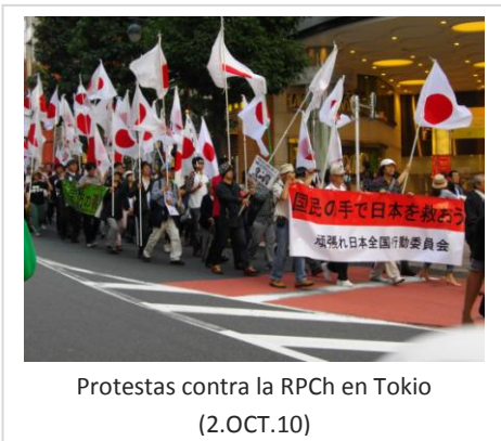
Protestas contra la RPCh en Tokio (2.OCT.10)

El último choque entre los dos países tuvo lugar la mañana del 7 de septiembre de 2010