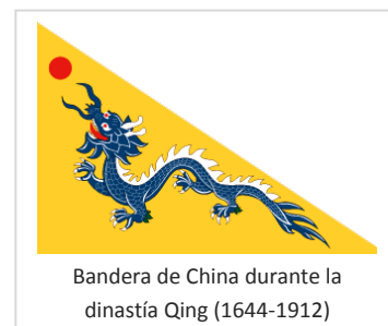
Bandera de China durante la dinastía Qing (1644-1912)

Al finalizar la II Guerra Mundial , La República de China y la finalmente denominada República Popular China se enfrentaron en una guerra civil que se apaciguó en 1949 tras el exilio del partido en el poder, el Kuomintang , a la isla de Taiwán. En ese momento el Partido Comunista de China proclama el gobierno de la República Popular China en Pekín mientras que el Kuomintang establece su capital en Taipéi. Desde entonces hasta 2008 la relación ha sido inestable 56 y marcada por constantes enfrentamientos militares a menor escala 57 .