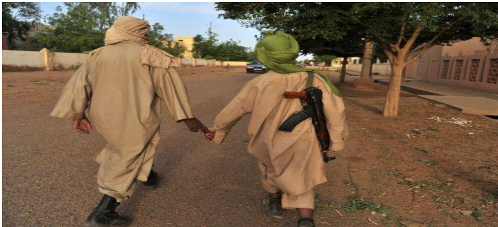
Dos militantes del (MUJAO), en Gao (Mali).

El MUJAO, creado en septiembre del año 2011 como escisión del grupo terrorista Al Qaeda del Magreb Islámico (AQMI), ha estado detrás de violentos ataques terroristas y secuestros en la región, en octubre del año 2011, se dará a conocer con el secuestro de tres cooperantes en Tinduf, en marzo del año 2012, por el ataque suicida contra una base de la policía en Tamanrasset, Argelia, que hirió a 23 personas, y un ataque en el mes de junio de 2012 en Ouargla, Argelia. El MUJAO también fue responsable en abril del año 2012 del secuestro de siete diplomáticos argelinos en Gao, (Mali).