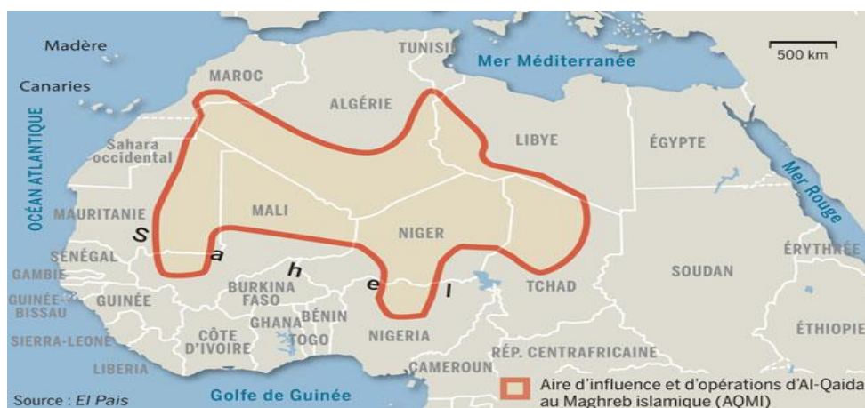
Zona influencia AQMI(Al Qaeda del Magreb Islámico) en la región.

El Sahel ha sido la región donde más han crecido los grupos terroristas islamistas en los últimos años, ha pasado de ser un refugio favorecido por las condiciones geográficas y por la debilidad de un poder efectivo sobre el terreno a convertirse en campo de batalla de los yihadistas salafistas. En la década de los noventa comenzarán a instalarse en el norte Mali los primeros terroristas procedentes de Argelia.