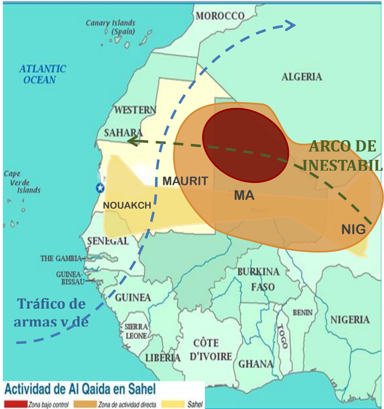
Actuación y zonas de influencia de AQMI, arco de inestabilidad y rutas de tráfico de armas y drogas en la región

(MUJWA, también conocido por MUJAO), y a Hamad el Khairy, y Ahmed el Tilemsi, dos de los líderes de esta organización. 25