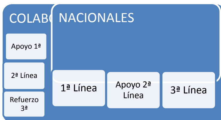
Ilustración 2. Responsabilidad de las medidas en las líneas de defensa

Las medidas presentadas tienen un carácter nacional o colaborativo o internacional más o menos profundo. Basándose en la responsabilidad y la carga de trabajo que supone para un estado o para la comunidad internacional, podemos establecer el cuadro siguiente ( Ilustración 2 ). Los esfuerzos y medidas de la primera línea de defensa son eminentemente nacionales si bien el apoyo de las medidas colaborativas es esencial ya que ciertos estados no podrán lograr alcanzar por ellos mismos el estándar de seguridad exigido. En el caso de la segunda línea de defensa, el control del tráfico ilícito, es el conjunto de la comunidad internacional el que debe dirigir el esfuerzo; ya que solamente la aplicación de las medidas nacionales de manera global permite que el conjunto sea eficaz. En la última línea de defensa, es cada uno de los estados el que tiene la responsabilidad final de garantizar la seguridad de sus nacionales, pero la comunidad internacional establece unas medidas que refuerzan las de los estados, tanto con acuerdos internacionales como con iniciativas