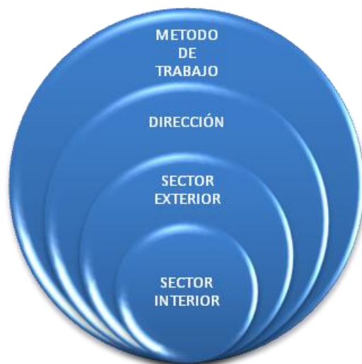
Ilustración 3. Arquitectura de seguridad nuclear

Exteriores y Cooperación que trata los asuntos y que podría constituir el embrión de la que aquí se expone.