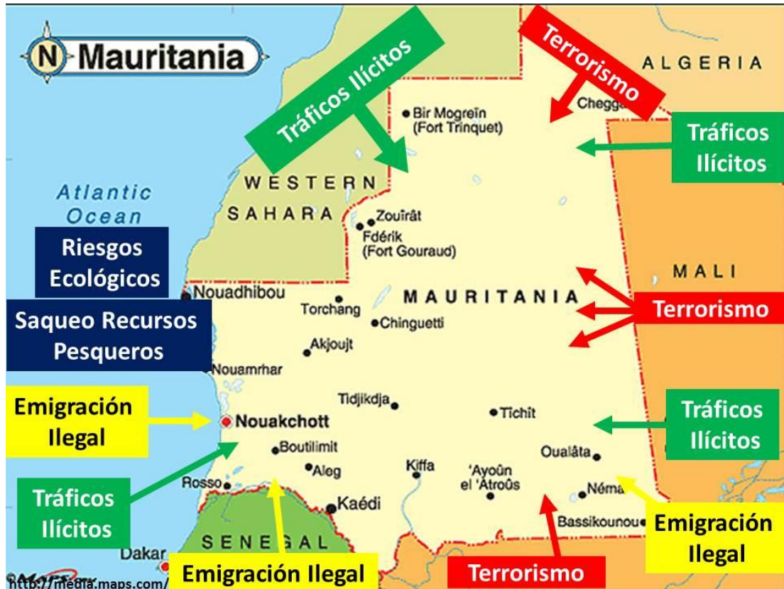
Figura 5 Amenazas