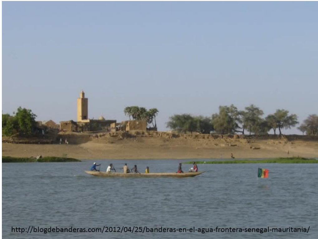
Figura 3 Bandera de Senegal en el punto medio del Río Senegal que marca la frontera entre Senegal y Mauritania. Rosso (Mauritania)

A iniciativa del Presidente senegalés Abdou Diouf se firmó un Tratado (JUL 1991) que ayudó a restablecer las relaciones (ABR 1992) y a abrir la frontera (MAY 1992). Los puntos de paso discontinuos (en barcazas) actuales son : N'Diago, Diama, Rosso, Jerd El Mohguen, Tekane, Lekseiba, Boghe (Brakna), M'Bagne, Kaedi (Gorgol),Tifounde Cive, Maghama y Goraye (Guidimaka). Estos puntos de paso se verán mejorados con la construcción de un puente en Rosso 10 .