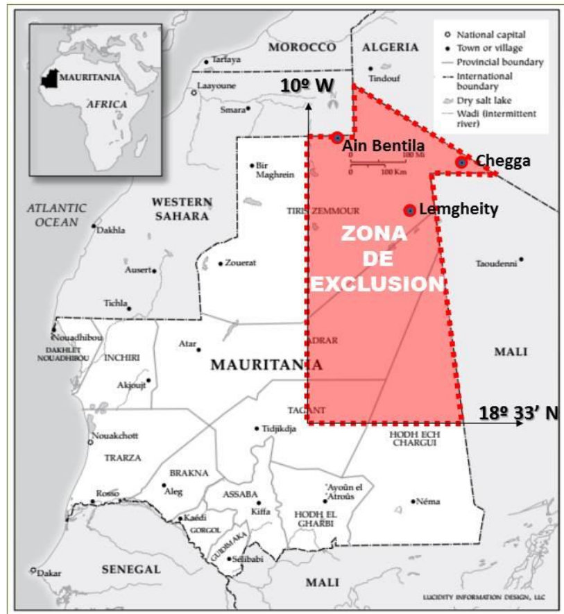
Figura6 Zona Militar de Exclusión

Esta zona militar incluye tres puntos de paso obligatorio: