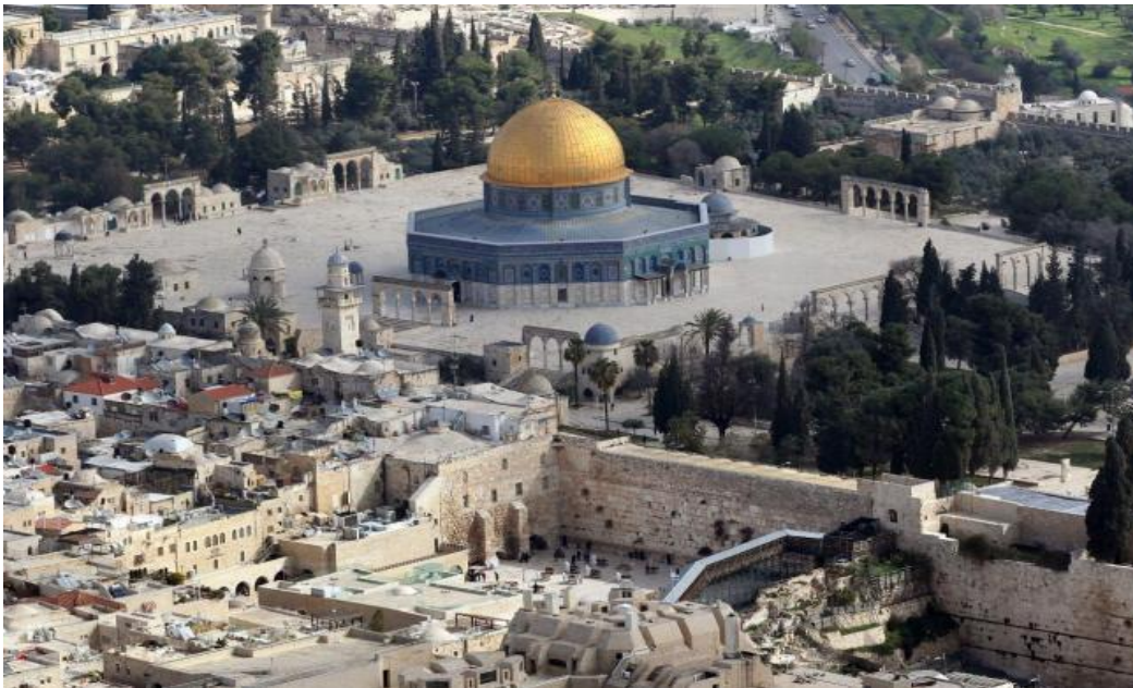
El tercer lugar santo del Islam, el “ Haram al-Sharif ”, donde se encuentran la mezquita de la Roca y la de Al-Aqsa, desde la cúpula dorada de la roca el profeta ascendió a los cielos.

En esta sempiterna confrontación, el factor religioso siempre ha jugado un papel relevante, donde la simbología adquiere una especial importancia, en particular aquella referida al estatus de la famosa explanada de las mezquitas, el “ Haram al-Sharif ” para los musulmanes, y el “ Templo de Sion ”, “ Har Habait ” (en hebreo) para los judíos, uno de los nudos gordianos de este conflicto de más de sesenta años y un lugar que ambas comunidades reclaman como suyo y se niegan a ceder su soberanía sobre este santo emplazamiento para ambas religiones 46 .