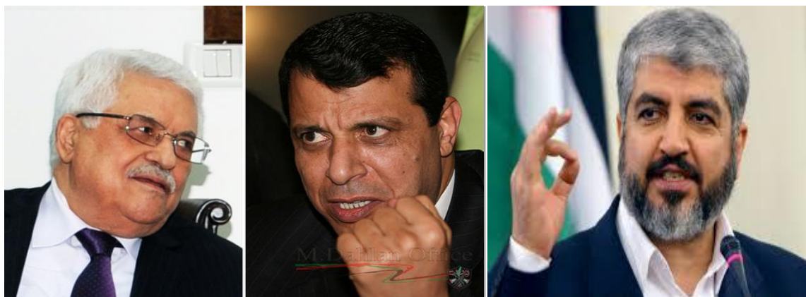
Mahmoud Abbas y Mohamed Dahlan, en el centro, ambos enfrentados por el control político por parte de Fatah en la franja de Gaza, ante el delirio de HAMAS, cuyo líder es Khaled Meshaal, en la foto de la derecha, y que actualmente reside en Doha, Qatar.

Es evidente que la ANP solamente gobierna en Cisjordania, y no en Gaza, pues no está interesada en asumir el control de esta zona tan convulsa, en particular lo que concierne a la seguridad. Abbas teme que si asume dicho control esto le suponga un desgaste que vaya en beneficio de Hamas y esta aproveche para hacerse más fuerte en Cisjordania. A ello se ha de añadir que los israelíes hacen lo posible para alimentar el alejamiento entre las dos subentidades palestinas, ya que ello le conviene al obstaculizar este hecho el establecimiento del estado palestino que tanto quiere impedir Israel.