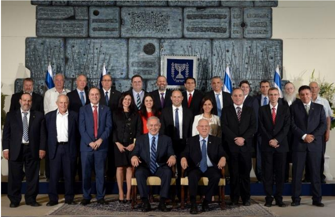
Actual gobierno, formado en marzo de 2015, con Benjamín Netanyahu en el centro junto al presidente Reuven Rivlin.

La narrativa de la derecha israelí, se basa fundamentalmente en la priorización de la seguridad por encima de todo, de modo que las iniciativas para emprender el proceso de paz con los palestinos pasa a un segundo plano, por no decir al último.