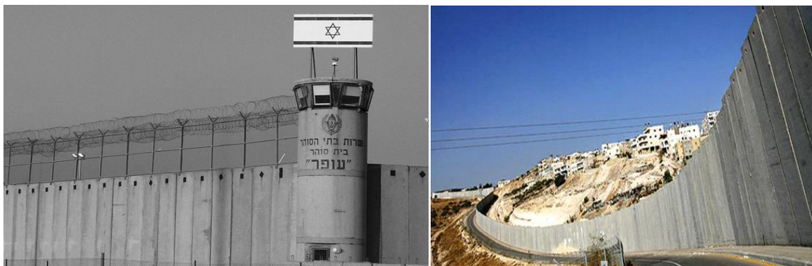
Imágenes del muro de separación entre Cisjordania e Israel, y que no coincide con la “línea verde”.

Sharon, en el 2003, comenzó a plantear un cambio de estrategia, que no fuera incompatible con la “hoja de ruta”, con el objeto de ir adoptando una política de separación de los palestinos para aplicar una serie de medidas unilaterales entre las se encontraba la retirada total de la franja de Gaza, considerada como un lastre para Israel, y el desmantelamiento simbólico de algunos asentamientos de Cisjordania 33 . Con estas acciones Sharon transmitiría a la comunidad internacional, en especial al “cuarteto” 34 , su intención de contribuir decisivamente a la paz al ir retirándose de los territorios ocupados. Además, con ello trasladaba la responsabilidad de la seguridad en Gaza a los palestinos, que ya se sabía que tenían importantes disensiones entre Hamas y la ANP.