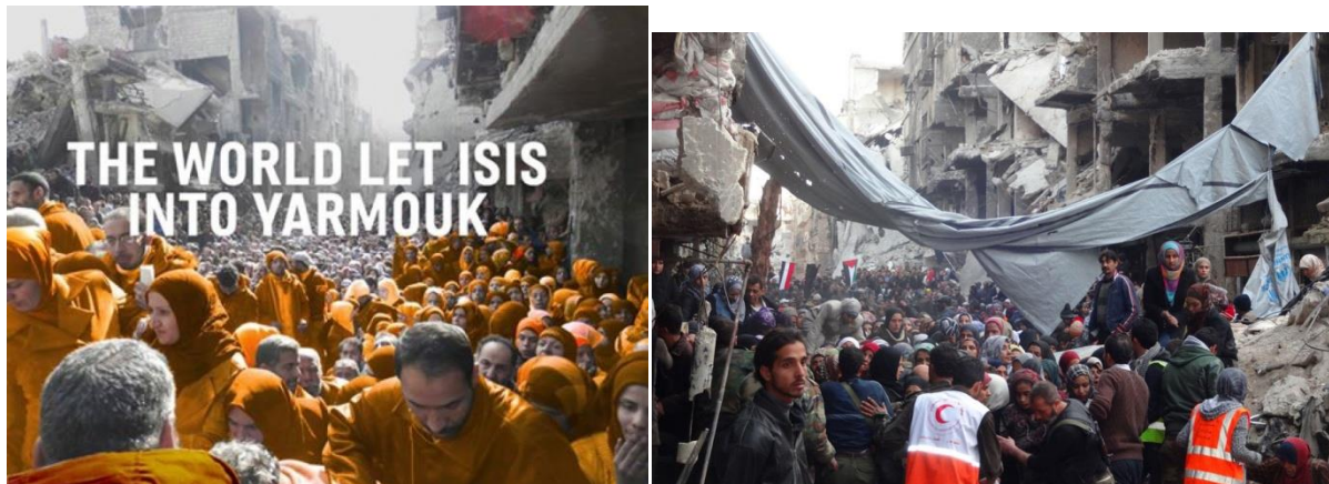
Imágenes del campo de refugiados en Yarmouk, en un barrio en ruinas de Damasco, en la foto de la derecha se puede observar a los miembros de las ONGs.

A ello se añade la diferente percepción de los refugiados en el propio pueblo palestino, entre las poblaciones de Gaza o Cisjordania, y entre la misma diáspora, pues no es lo mismo ser refugiado en Jordania que en Líbano o en Siria 51 , donde están siendo víctimas del largo y terrible conflicto que asola este país y se encuentran en condiciones mucho peores 52 . Opinan de manera distinta los propios refugiados de aquellos que no lo son, pues estos últimos no sienten el prejuicio que supone el hecho de encontrarse en un país y una tierra que no es la suya.