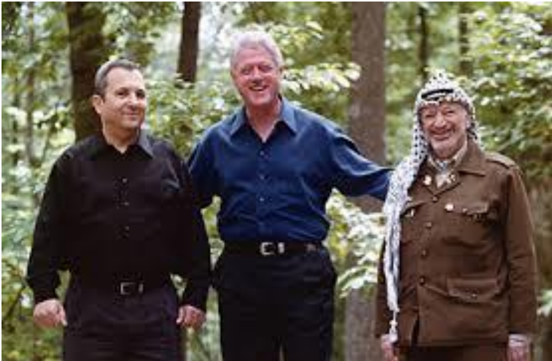
Julio de 2000, cumbre de paz en Camp David entre el primer ministro Ehud Barak y Yassir Arafat, con el presidente Clinton como sponsor e impulsor.

Arafat se mostró totalmente inflexible sobre cualquier posibilidad de concesión de soberanía sobre la explanada 23 , y no aceptaría nada que fuera en contra del total control palestino de Jerusalén este. Clinton era consciente que ello era igualmente inaceptable para el primer ministro.