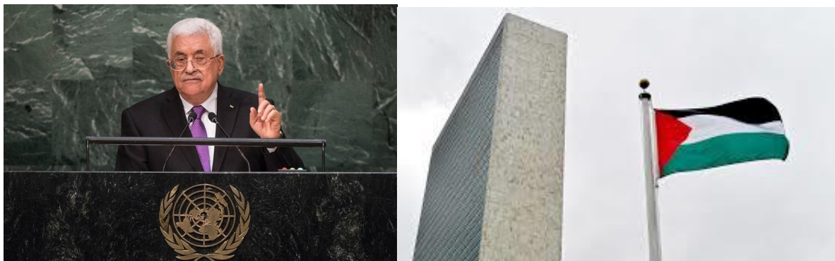
Mahmoud Abbas, en su primer discurso ante la Asamblea General de la ONU, el 30SEP15, y la bandera palestina ondeando por primera vez en la ONU.

de la Haya, aprovechando que también han sido aceptados como miembros en esta institución 74 .