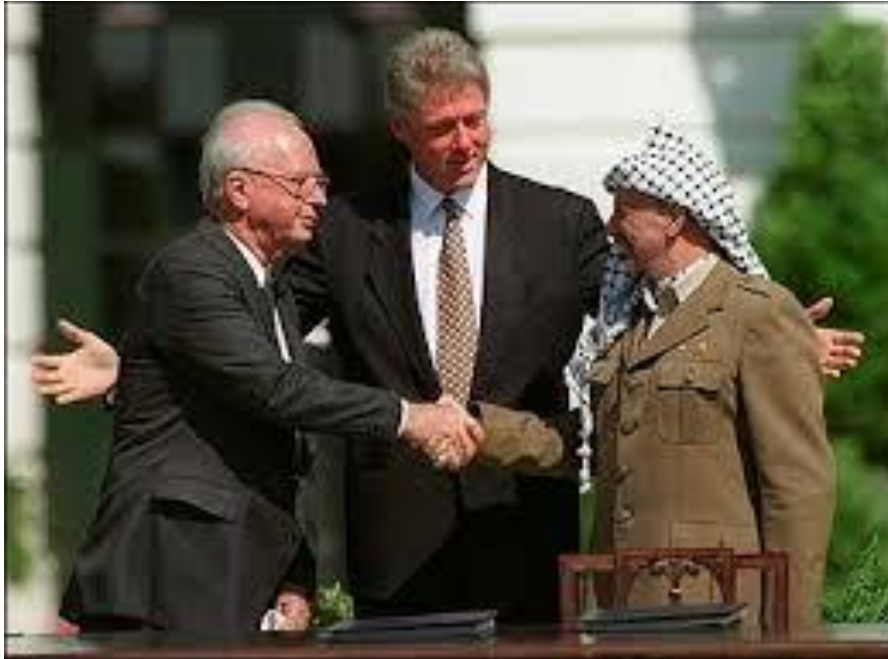
Acuerdos de Oslo, 1993, en la Casa Blanca, bajo auspicio del presidente Bill Clinton, y firmados por el entonces primer ministro israelí, Isaac Rabin, y el líder palestino Yassir Arafat.

final en que tuviera lugar el apretón de manos tradicional, en el que fue el líder árabe el que dio el primer paso en tenderla 12 .