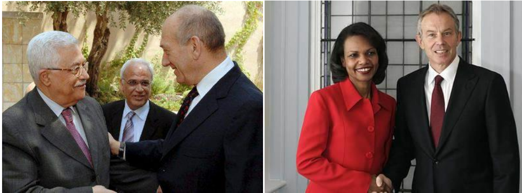
A la izquierda, Mahmoud Abbas y Ehud Olmert en la cumbre de Annapolis, en el centro, Saeeb Erekat, el principal negociador de la ANP. En la foto de la derecha, dos representantes del “cuarteto”, la secretaria de estado norteamericana, Condoleezza Rice, y el representante de la UE para el conflicto palestino - israelí, el ex primer ministro británico Tony Blair.

obtener en esta ocasión 37 . La conferencia despertó muy escaso entusiasmo en la sociedad palestina y son muy pocos en los territorios ocupados los que valoran un proceso de paz interminable, que no acaba de materializarse en la mejora de sus condiciones de vida y que no consolida un estado palestino viable en una Cisjordania totalmente discontinua por el aumento de los asentamientos israelíes, unidos por una red tupida de carreteras vigiladas y controladas por las fuerza de seguridad judías. Además, Hamas ya había establecido un gobierno en Gaza independiente de la ANP, aparte de expulsar de la franja a aquellas milicias afines a Fatah.