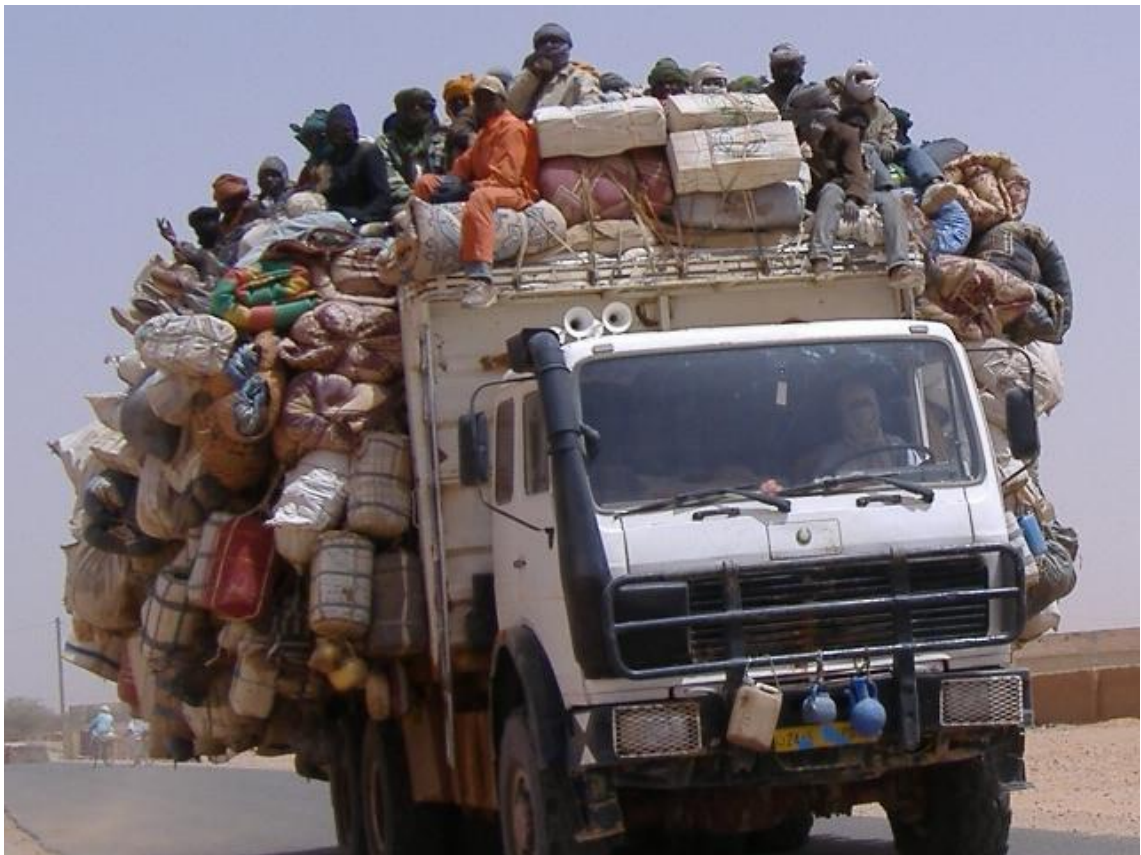
Figura 1. Migrantes irregulares parten de Agadez (Níger) hacia Libia a través del Sáhara.

Desde los años noventa, la pobreza y la violencia han empujado a muchos subsaharianos a buscar una vida mejor en Europa, un continente próspero y seguro. Las rutas que utilizan son herederas de siglos de comercio y viajes a través del Sáhara, pero también de movimientos migratorios más recientes entre el sur del Sáhara y el Magreb, que posteriormente enlazaron con las travesías del Mediterráneo emprendidas por los migrantes magrebíes en las décadas anteriores. 1