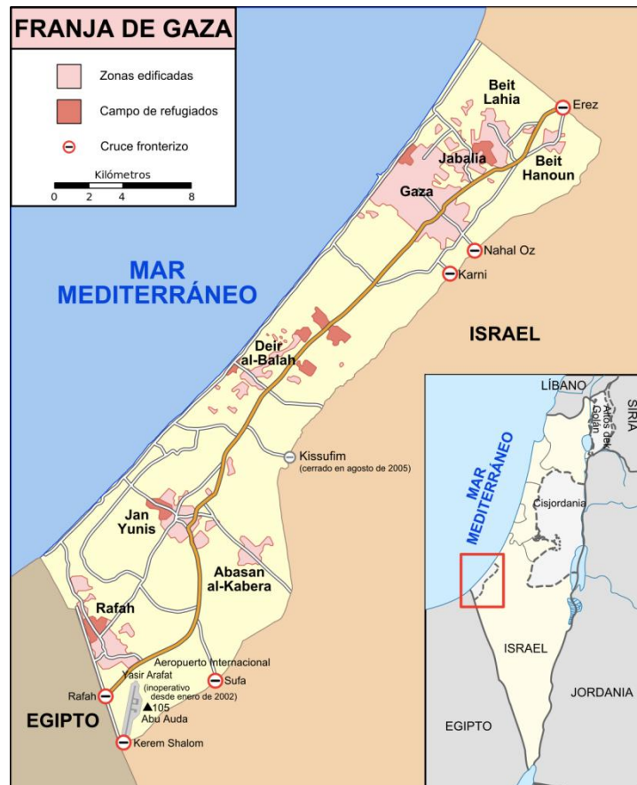
Figura 3: Franja de Gaza y territorios fronterizos.

por los servicios de inteligencia americanos, que ocupaba un alto puesto en las filas de la milicia de Hezbolá 108 . Además, Israel se considera uno de los países con tecnología más avanzada en materia de armas cibernéticas, comparándose con Estados Unidos, China o Rusia. Por eso, y a pesar de que la autoría no llegó a confirmarse, todo apunta a que Israel, junto con la ayuda de Estados Unidos, introdujo al gusano Stuxnet en las máquinas de una planta nuclear iraní en 2010, retrasando los proyectos nucleares durante años 109 .