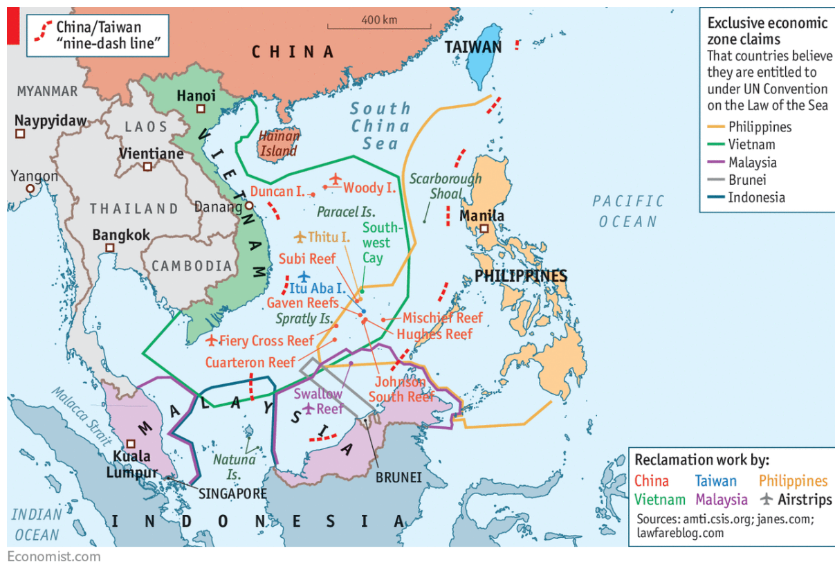
Figura 3: Pretensiones territoriales en el mar de la China meridional.

Tras el compromiso de 1992, en el año 2002 se dio un primer paso con la aprobación de la Declaración de Conducta en cuyo punto décimo 16 se establece que «las Partes concernidas reafirman que la adopción de un código de conducta en el mar de la China meridional promovería la paz y la estabilidad en la región y acuerdan trabajar, sobre la base del consenso, por el eventual consecución de este objetivo».