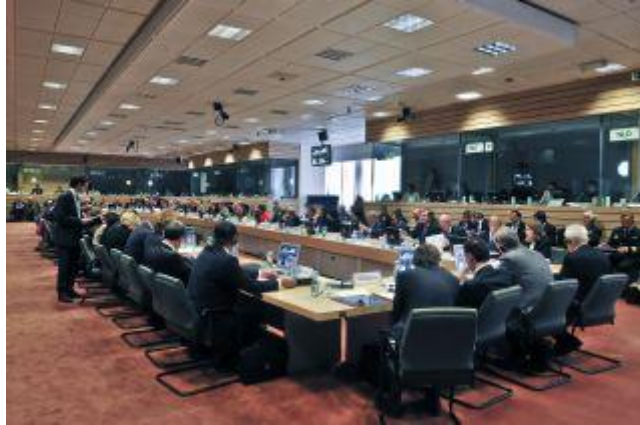
Reunión del SB (“ Steering Board ” o comité directivo) en formato Ministros de Defensa.

de esa manera en el SB (Steering Board o “Comité Directivo”) de Marzo de 2011, y a las que ha adaptado quizás el interés común con el de las naciones participantes, estas son: “ counter-IED, medical support, ISR 11 , helicopters, cyber defense, multinational logistics support, CSDP information Exchange, strategic&tactical airlift mangement, fuel&energy ”.