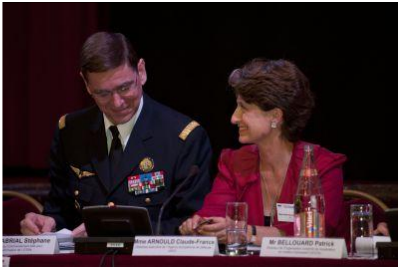
La Presidenta de la EDA Ms Arnould (FR). Fuente: EDA. Bruselas. 2011.

La segunda, la interna, quizás sea más relevante, porque es uno de los instrumentos más importantes para lograr la participación de los pMS 4 en políticas comunes de la Unión (en el campo de la seguridad y defensa); y además proporciona los medios institucionales necesarios para la consolidación de la industria europea de defensa en el mercado armamentístico mundial... Por ello, un análisis sistemático de la actuación de la Agencia puede darnos una idea del pulso de funcionamiento actual de la UE (en este ámbito particularmente).