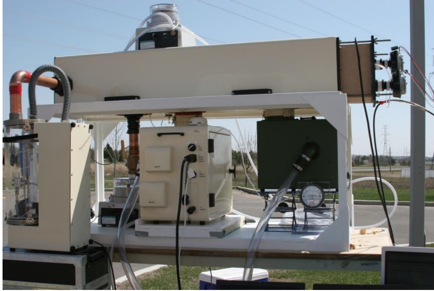
Cámara Diseminación de aerosoles. Fuente Dycor