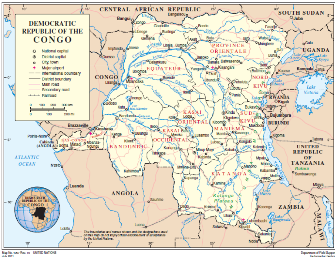
Mapa I: Mapa político de la República Democrática del Congo

odio y rechazo entre las distintas comunidades. Por otra parte, el segundo hecho marcaría el comienzo de la generalización de la violencia que se mantiene hasta hoy en día. Si bien las desigualdades generadas durante la colonización marcarían el preludio del rechazo, el genocidio ruandés sería el incentivo para alcanzar la igualdad deseada de forma sanguinaria.