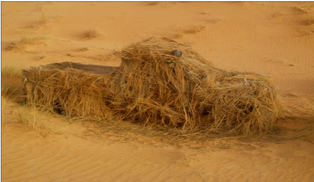
Jeep de un grupo terrorista oculto entre dunas y camuflado en el desierto de Mauritania, localizado por una Unidad del GSI.

En el año 2008 se creó por parte del Ejército de Mauritania el GSI, Agrupamientos Especiales de Intervención (Groupement Special D'intervention), 7 unidades de intervención rápida con un adiestramiento y estructura adaptados a la amenaza terrorista. Entre los objetivos de estos grupos se encuentran, además de la lucha contra los grupos terroristas, el tráfico de drogas, el tráfico de armas y la lucha contra el crimen organizado. Inicialmente, la puesta en marcha de cuatro agrupaciones del GSI, ha sido decisiva a la hora de combatir la amenaza terrorista y la infiltración de estos grupos por las extensas y permeables fronteras mauritanas.