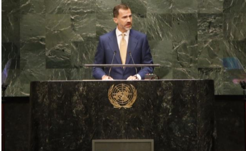
Don Felipe durante su intervención en la Asamblea General de Naciones Unidas

a veto, y participar activamente tanto en los trabajos que se llevan a cabo, como en la toma de decisiones, es una de las mayores aspiraciones que puede tener un país en la esfera internacional. El último respaldo a la candidatura española ha venido de la figura de SM. el Rey Felipe VI, que intervino el miércoles 24 de septiembre en la Ceremonia de Apertura del Debate General del 69.º Período de Sesiones de la Asamblea General de Naciones Unidas, siendo la primera ocasión en la que se dirige como Rey ante el Plenario de Naciones Unidas 4 .