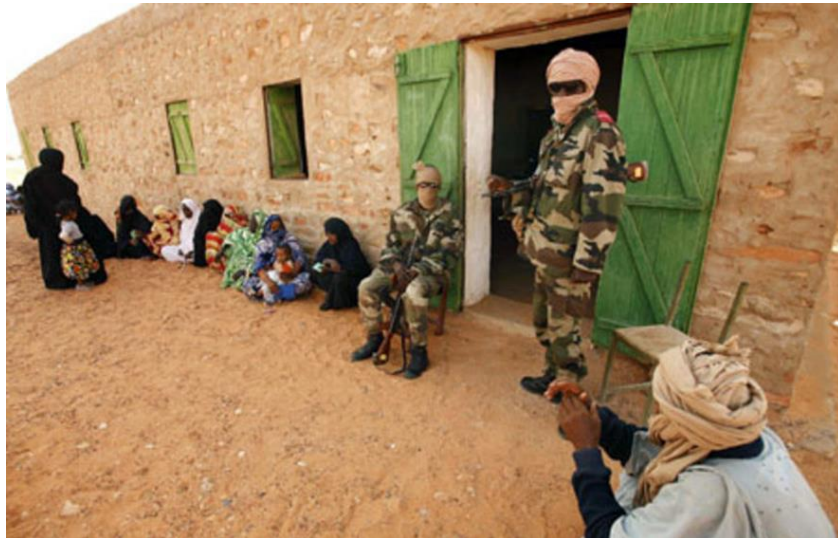
Colegio electoral en el interior del país

El FNDU continuó con las protestas y movilizaciones, denunciando la incapacidad del gobierno para proporcionar unas garantías mínimas de transparencia electoral, así como por la decisión unilateral de seguir adelante con las elecciones a pesar del colapso del proceso de diálogo con las fuerzas opositoras denunciando, al igual que en las elecciones parlamentarias y municipales de 2013, el carácter "dictatorial" de la política del Presidente Abdel Aziz y llamando a boicotear los comicios, a los que consideraban "una mascarada electoral" organizada de forma "unilateral".