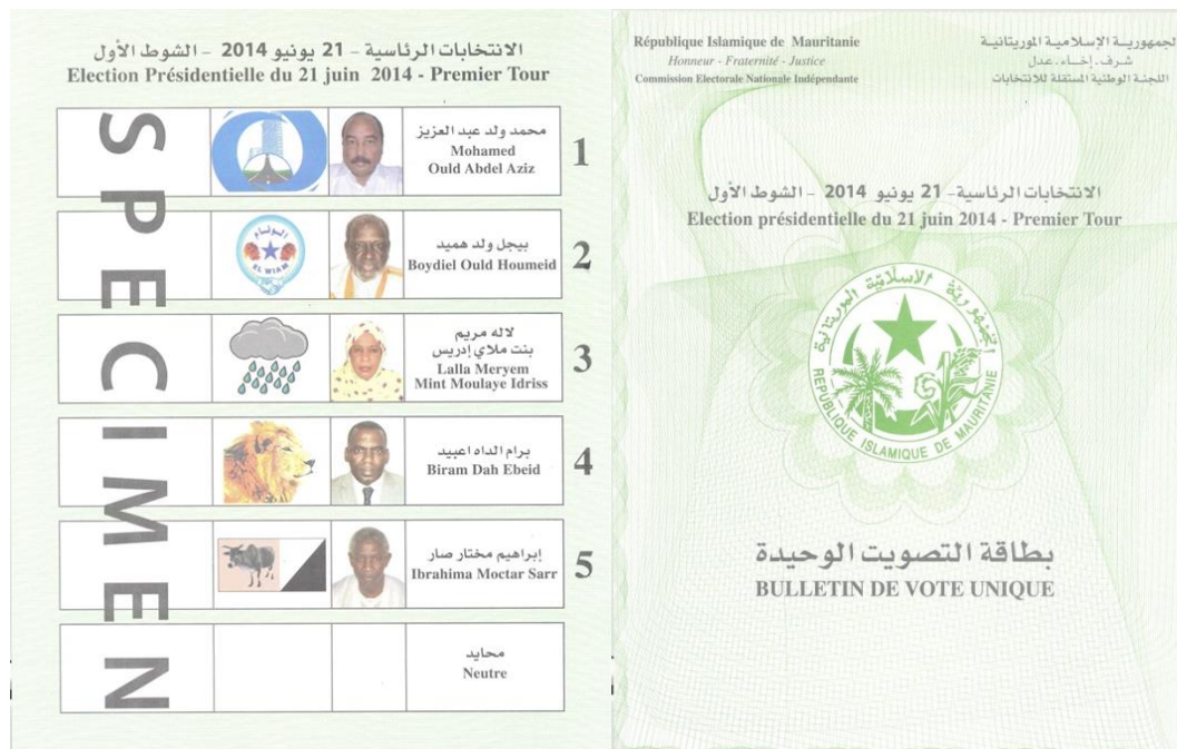
Papeleta de votación elecciones Presidenciales RIM 2014