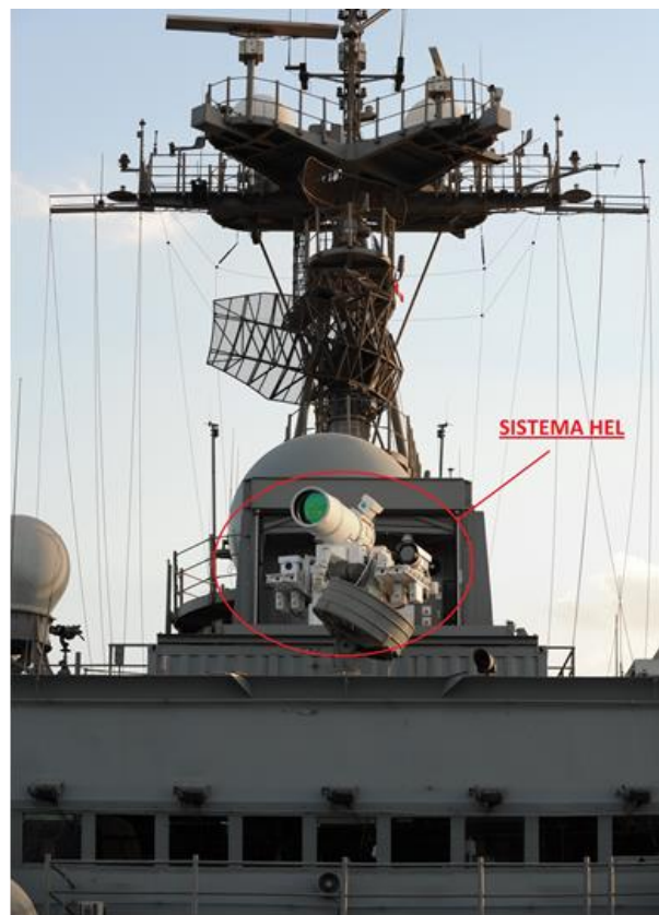
Sistema HEL de 33 kW, instalado a bordo del USS Ponce .

En definitiva, algunos de los nuevos sistemas HEL se mueven en cifras que suponen un peso máximo de 750 kg, para un volumen máximo de 2 m 3 , lo que implica que claramente puedan ser instalados sobre una gran variedad de plataformas, fijas o móviles. 7