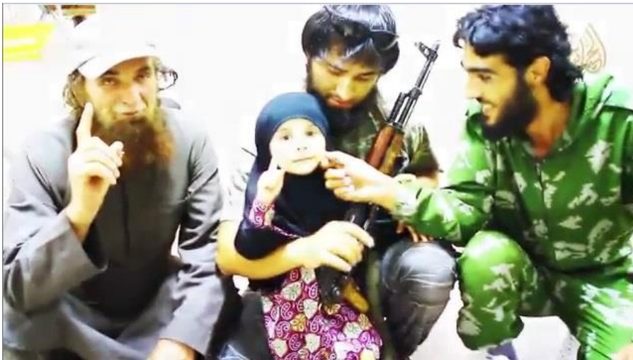
Imagen 9: “Mujatweet Episode 8”, Al Hayat Media Center , 2014, disponible en https://archive.org/details/HMC_MJT8

El comportamiento de los combatientes experimenta un cambio drástico en estas piezas. Aunque adornados siempre con su fusil al hombro, los muyahidines sonrían a la cámara, juegan con los niños, les regalan caramelos y dan de comer a sus propios hijos en un comedor colectivo. La imagen de despiadados luchadores que construye el aparato propagandístico a través del nashid es sustituida por el modelo de amables protectores de la sociedad, gracias a la inocencia e indefensión que encarna la presencia de los niños (imagen 9).