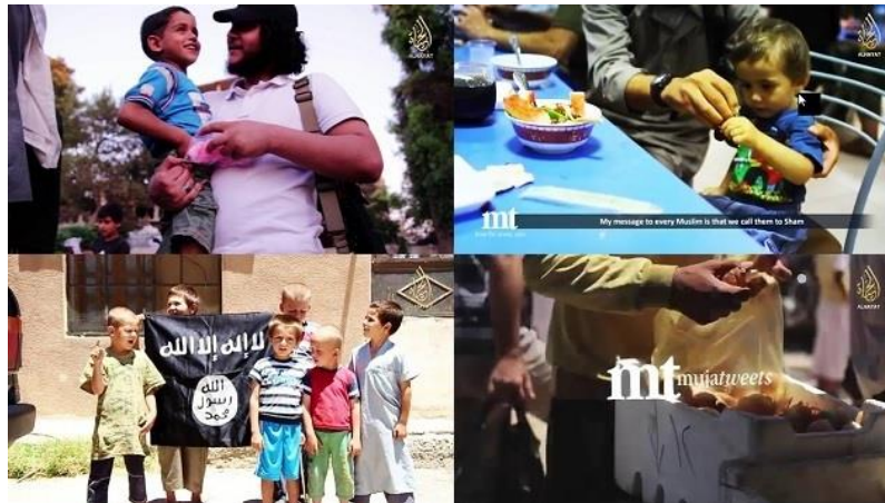
Imagen 8: Fotogramas de diferentes mujatweets .

El nombre que identifica estos vídeos nace de la fusión de los términos mujahedeen y tweet , nombre que describe a la perfección la naturaleza de estas piezas. Con una duración que oscila entre los treinta segundos y un minuto y medio, estos videos tuits tratan de mostrar breves pinceladas de la vida cotidiana que se desarrolla dentro de los territorios dominados por el DAESH (imagen 8). Estas piezas, carentes de título, se identifican por un número precedido del término Episode .