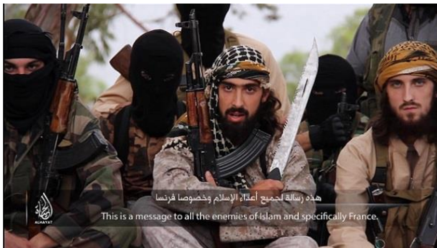
Imagen 3: “What are You Waiting For”, Al Hayat Media Center, 2014, disponible en https://archive.org/details/WhatAreYouWaitingFor_354

En un escenario en el que el discurso juega un papel clave y predominan los planos cortos, la interpretación de los actores adquiere una importancia crucial a la hora de imprimir a la actuación el tono adecuado. En este sentido, se observa una acertada labor por parte tanto de la dirección como de los actores, que adaptan con gran eficacia la expresión de sus rostros al carácter de sus mensajes. Por ejemplo, cuando amenaza a la audiencia, el rostro del actor adquiere un aire de severidad que se acentúa al quedar enmarcado entre las armas, como vemos en la imagen 3, en la que el orador se dirige a los “infiel” franceses antes de proferirles amenazas.