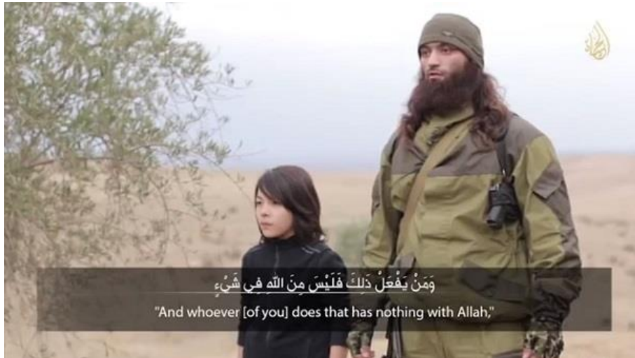
Imagen 6: Uncovering an Enemy Within , Al Hayat Media Center, 2015, disponible en https://archive.org/details/UncoveringAnEnemyWithin_alhayat

Por último, los oradores se muestran impasibles durante los asesinatos de rehenes, como vemos en la imagen 6, segundos antes de que éstos maten de un tiro en la nuca a dos víctimas acusadas de espionaje.