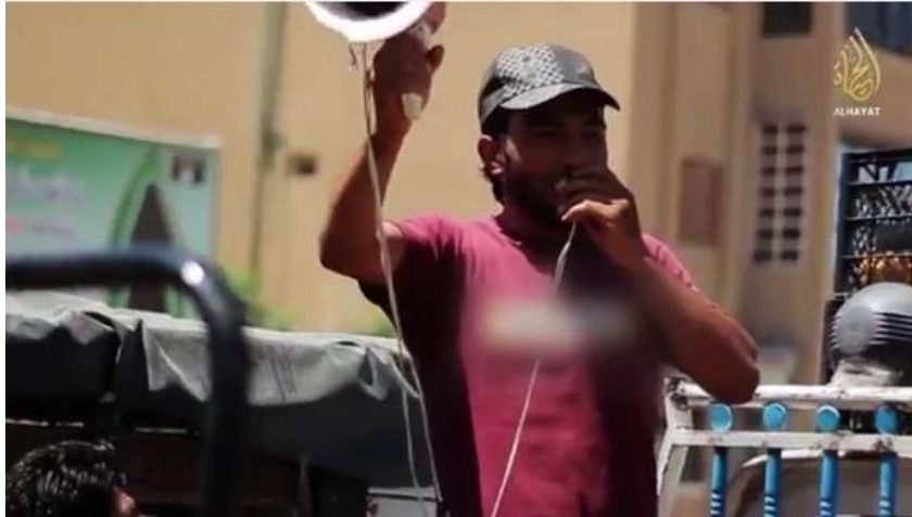
Imagen 10: “Mujatweet episode 7” , Al Hayat Media Center , 2014, disponible en https://archive.org/details/HMC_MJT7

Como se ha visto, el objetivo que persigue el aparato propagandístico con los mujatweets es similar al de los reportajes: presentar una imagen idealizada de los territorios que domina el DAESH para incitar a sus seguidores a emigrar a sus territorios y a su vez tratar de evitar la huida de la población local.