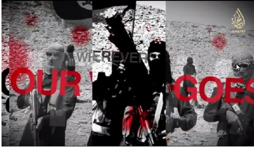
Imagen 1: Oh Soldiers of Truth Go Forth , Al Hayat Media Center, 2014, disponible en https://archive.org/details/HMC_ind

continuación se le añade un efecto que simula salpicaduras de sangre. Se aplica asimismo zoom en algunas franjas, o bien éstas aparecen desenfocadas (Imagen 1).