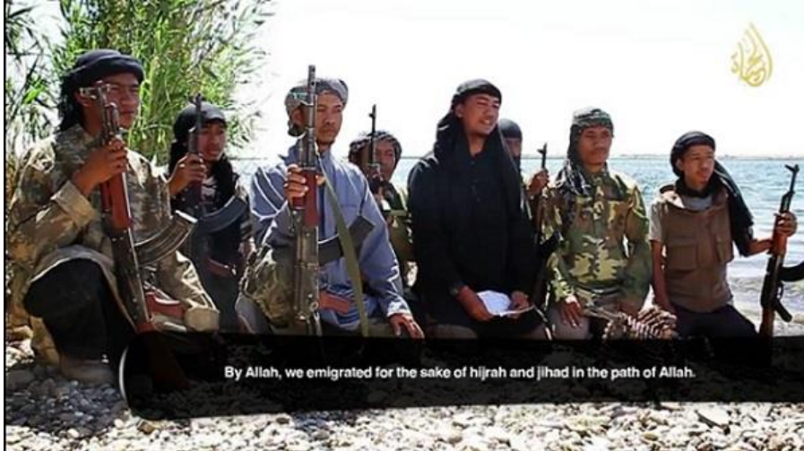
Imagen 2: Join the Ranks , Al Hayat Media Center, 2014, disponible en https://ia802509.us.archive.org/12/items/HMC_ranks/Join_the_Ranks.mp4

planos del orador. Con frecuencia se intercalan planos de recurso 14 , que proporcionan diversidad visual y mantienen la atención del espectador.