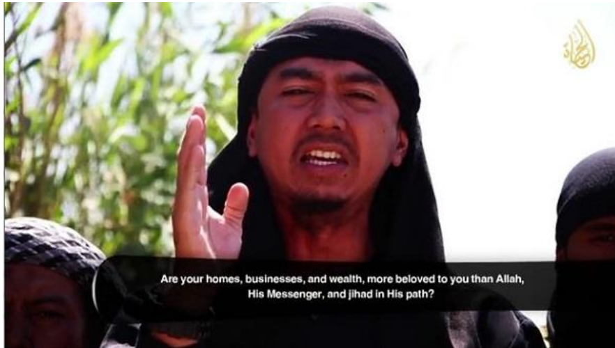
Imagen 4: Join the Ranks , Al Hayat Media Center, 2014, disponible en https://ia802509.us.archive.org/12/items/HMC_ranks/Join_the_Ranks.mp4

En otras ocasiones, el orador emite un mensaje más intimista mientras narra experiencias personales o discursos de carácter más espiritual. Tal es el caso de la imagen 5, en la que se puede apreciar el rostro de un narrador relajado mientras lleva a cabo una disertación de carácter teológico acerca de la legitimidad de la implantación del califato. Su rostro aparece iluminado con luz de relleno, mientras la imagen del paisaje de fondo aparece desenfocada para así centrar la atención del espectador en el discurso del orador, en este caso más abstracto de lo habitual.