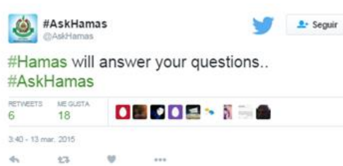
Ilustración 3: Perfil en Twitter de la campaña #AskHamas

A finales de junio de 2015, el grupo rebelde sirio Jaish al-Islam, vestido de naranja (color con el que Daesh viste a sus prisioneros para asesinarles delante de la cámara), publicó en Internet un vídeo en el que aparecían combatientes de Daesh encadenados y vestidos de negro, a los que más tarde ejecutarían. 11