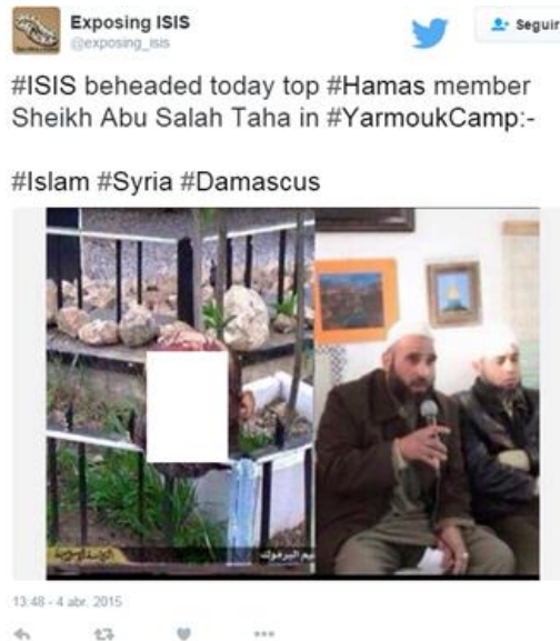
Ilustración 13: Imágenes de la decapitación de un líder de Hamas en Yarmuk circulan por Twitter. Fuente: https://twitter.com/exposing_isis/status/584457507692814338

Por otro lado, esta vez Daesh tampoco ha perdido la ocasión de hacer uso de la expectación que generan ciertas imágenes en la red, pues ha clavado cabezas de residentes palestinos en Yarmuk (incluidos algunos miembros de Hamas) en picas por el campo de refugiados, que han sido difundidas a través de Internet. 33