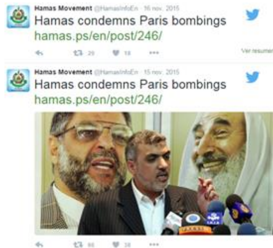
Ilustración 14: Hamas condena el atentado de París.

Si bien la comunidad internacional, así como las dos autoridades de los territorios palestinos (Al Fatah y Hamas), han condenado estos actos, nadie ha podido proteger a la población de Yarmuk de la guerra siria ni de Daesh.