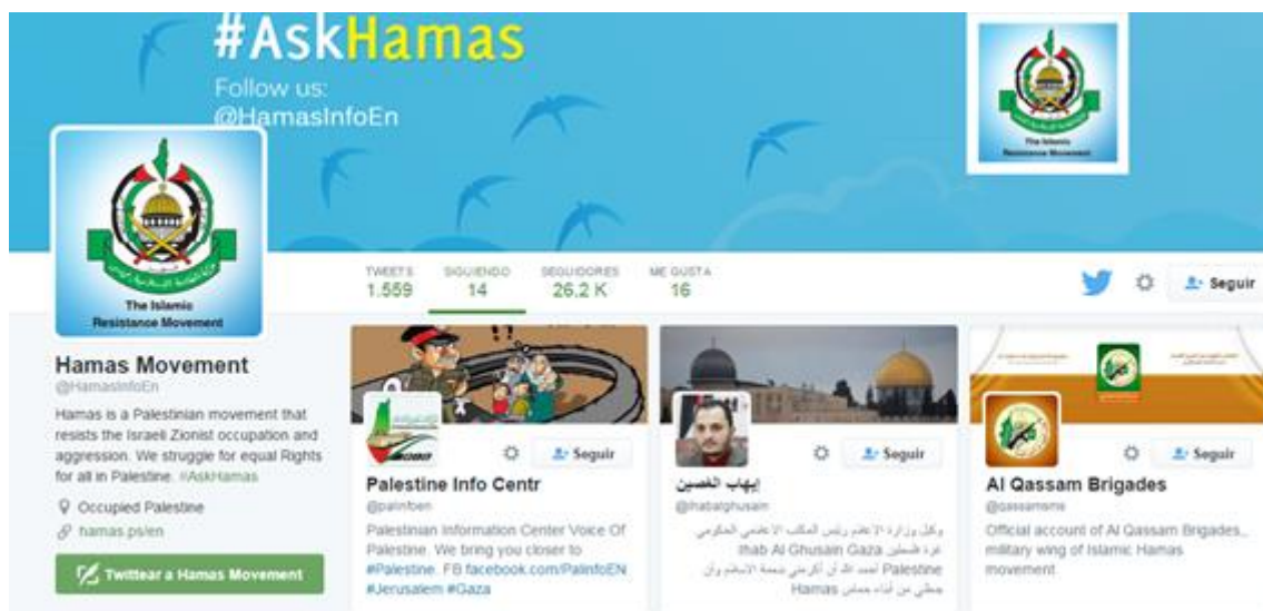
Ilustración 5: Twitter de Hamas

Hamas, “Movimiento de Resistencia Islámico”, es una organización militar y política sunita que controla la Franja de Gaza. Fundada en 1987 durante la primera intifada como escisión de los Hermanos Musulmanes de Egipto, es considerada organización terrorista por Estados Unidos y la Unión Europea. El brazo militar de Hamas está compuesto por las Brigadas de Ezzeldin Al Qassam, cuyo objetivo es derrotar a Israel mediante tácticas asimétricas como el lanzamiento indiscriminado de misiles, secuestros y atentados suicidas.