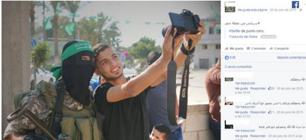
Ilustración 6: un joven se fotografía con un militante de Hamas.

(principalmente mezquitas) en los que rellenan un documento con sus datos personales. Mientras tanto, algunos se hacen selfies con los militantes de Hamas que luego suben a las redes sociales. 19