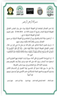
■ A joint statement from the militant factions - Publish date : 2015-06-30

Miles de ciudadanos musulmanes recurren a las redes sociales virtuales para apoyar la ideología de los grupos terroristas e insurgentes con los que se identifican, como se observa en Twitter , Facebook , Youtube , Instagram o Telegram , entre otras. De estas, las plataformas más populares entre los terroristas son Twitter y, más recientemente, Telegram , 3 desde donde dirigen a los usuarios hacia contenidos ubicados en otras redes sociales. 4 Aunque las grandes compañías han suspendido numerosas cuentas vinculadas a organizaciones terroristas, esta medida ha resultado ser ineficaz, pues rápidamente vuelven a surgir perfiles –capaces de alcanzar miles de seguidores en menos de 24 horas– que sustituyen a los eliminados. 5 A través de frases y hashtags , los usuarios de las redes sociales respaldan las acciones de Daesh, Al-Qaeda, Hamas o Hezbollah, opinan sobre distintos sucesos y publican las últimas novedades de los conflictos a través de comentarios e imágenes, manteniendo una presencia virtual constante. 6