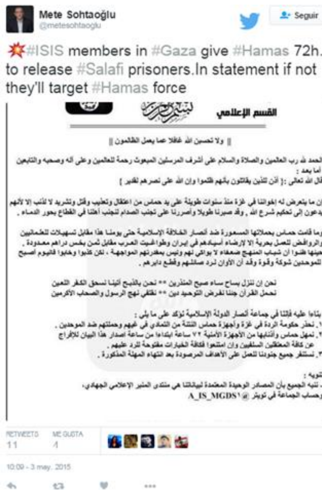
Ilustración 10: Comunicado de Daesh contra Hamas.