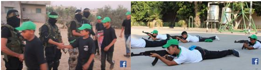
Ilustraciones 7 y 8: Campamento de verano de Hamas (2015).