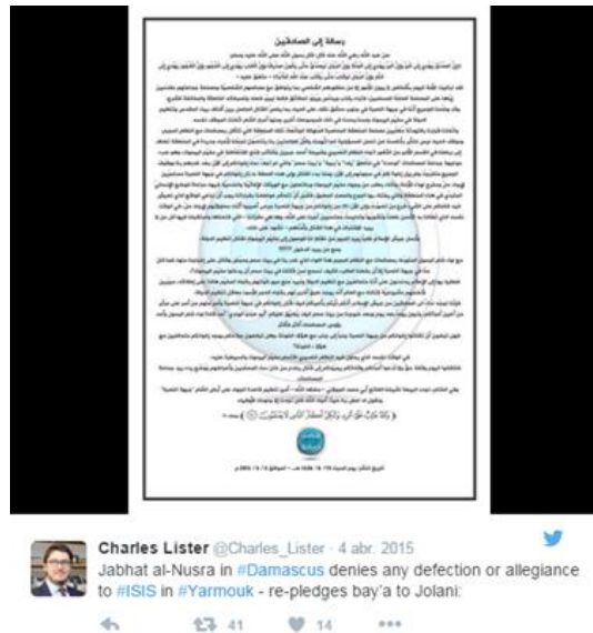
Ilustración 12: Comunicado de Al-Nusra.