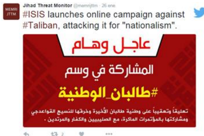
Ilustración 1: Daesh lanza una campaña virtual contra los Talibanes acusándoles de nacionalistas

Desde el estallido de la Primavera Árabe, el uso de las redes sociales virtuales ha aumentado de forma exponencial en Oriente Medio. Esta situación ha sido aprovechada por numerosos actores no-estatales que, conscientes de la oportunidad de hacerse oír ante millones de personas de forma rápida y sencilla, se han lanzado a conquistar estas plataformas. Más concretamente, muchos grupos terroristas e insurgentes ya no utilizan Internet simplemente para buscar medios de financiación, reclutar nuevos militantes, hacer propaganda de sus actos e incluso realizar ciberataques. 1 Aunque el empleo de Internet por parte de grupos terroristas no es algo nuevo, la gran diferencia es que ya no sólo utilizan el anonimato en la red, sino que también buscan tener la mayor presencia pública posible. 2 En la actualidad, las redes sociales virtuales han ampliado su papel como vectores de comunicación hasta el punto de que los propios terroristas las usan para amenazarse abiertamente unos a otros o para reclamar la autoría de un atentado.