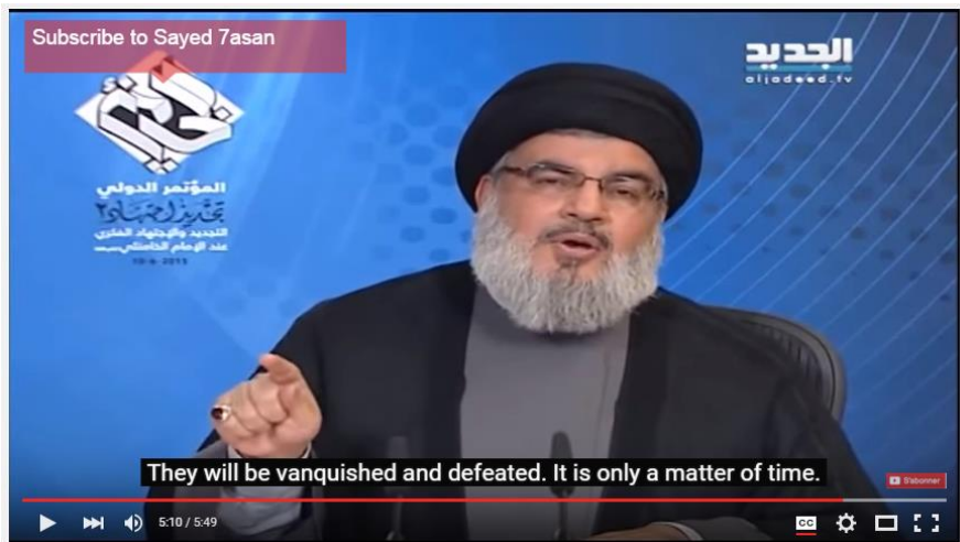
Ilustración 15: Discurso de Hassan Nasrallah.

ocasiones, ha anunciado que algunas cuentas de Twitter supuestamente asociadas a la organización eran falsas. 41