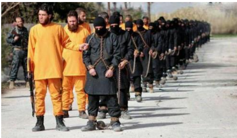
Ilustración 4: Puesta en escena de la ejecución de los prisioneros de Daesh

A finales de junio de 2015, el grupo rebelde sirio Jaish al-Islam, vestido de naranja (color con el que Daesh viste a sus prisioneros para asesinarles delante de la cámara), publicó en Internet un vídeo en el que aparecían combatientes de Daesh encadenados y vestidos de negro, a los que más tarde ejecutarían. 11