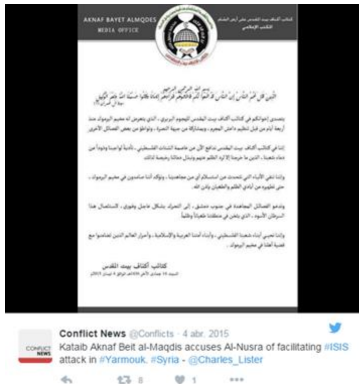
Ilustración 11: Comunicado de Aknaf Beit al Maqdis.

La lucha entre ambos grupos traspasa las fronteras de la Franja de Gaza hasta llegar a golpear a los palestinos que han huido a Siria. A raíz de la masacre en el campo de refugiados palestinos en Yarmuk 31 , el jefe de Aknaf Beit al Maqdis, pequeña milicia afiliada a Hamas, acusó en Twitter a Al-Nusra de ser cómplice de Daesh.