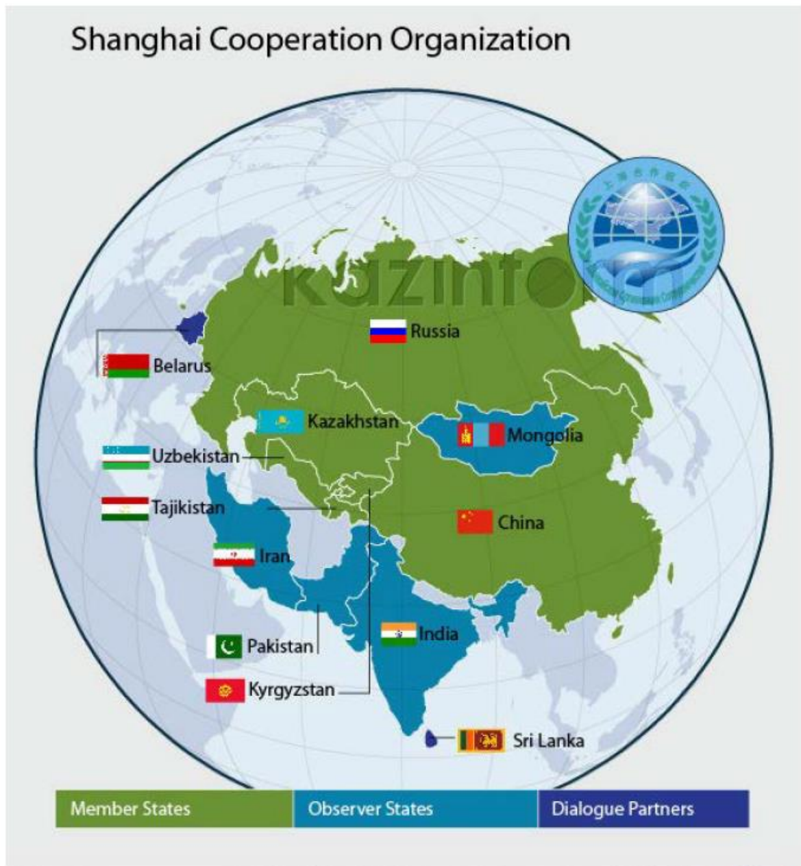
Figura 3: Organización para la Cooperación de Shanghai