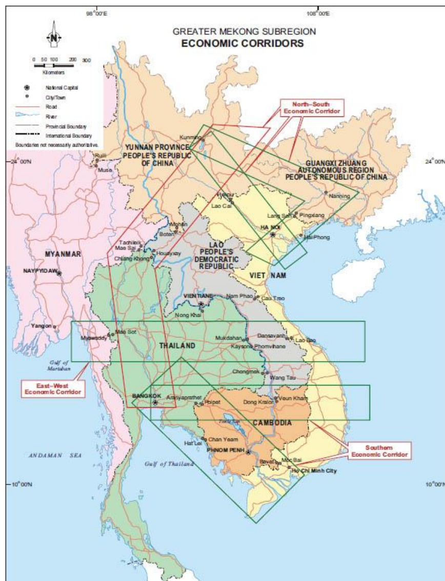
Corredores económicos en la región del Mekong.

Finalmente, los dos últimos pilares que completan la nueva estrategia Tokyo 2015 están dedicados a la consecución de la visión del Mekong verde mediante una serie de acciones dirigidas a asegurar el desarrollo sostenible y la seguridad humana de los habitantes de la región. La implementación de esta estrategia se lleva a cabo a través del Foro para el Mekong Verde y está enfocado a una serie de ámbitos como la reducción de los riesgos de desastre en línea con la Declaración de Sendai y el Marco de Sendai para la reducción de los riesgos de desastre 2015-2030.