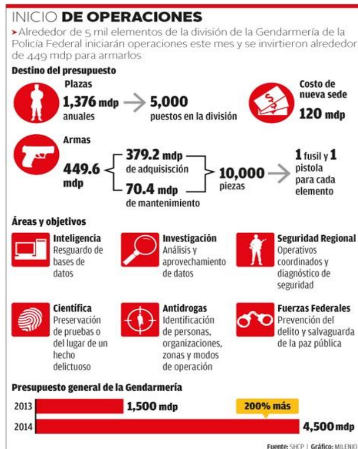
Figura 1. Inicio de operaciones de la Gendarmería 12 .

Comenzando por el segundo proceso, cabe resaltar que el Ejército ha ido imponiéndose a la Policía como el garante de la seguridad pública. Lejos de ser una solución temporal, esta situación se está postergando en el tiempo y está generando mucha controversia y descontento incluso en el propio Ejército. El general Salvador Cienfuegos Zepeda, persona que se encuentra al frente de la Secretaría de la Defensa Nacional de México (SEDENA), expuso públicamente su queja en diciembre de 2016, manifestando que la función del Ejército no era perseguir delincuentes 10 . A esto añadió la incertidumbre con la que las tropas afrontan su tarea de seguridad pública, dado que no hay una ley que regule esta situación, que deje claras las responsabilidades del Ejército en labores de seguridad pública 11 . De alguna forma, el representante de la SEDENA reivindicó una mejora de la seguridad jurídica a la hora de actuar.