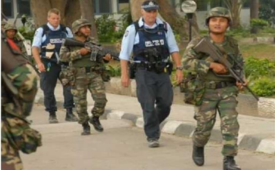
Figura 5: Tropas malayas y policías australianos patrullan Phnom Penh en vísperas de las elecciones de 1993.

zonas tan alejadas de esa región como el litoral costero y la frontera oriental. Ciertamente, en Camboya la paz no la impuso la UNTAC y, de manera efectiva, tampoco la mantuvo.