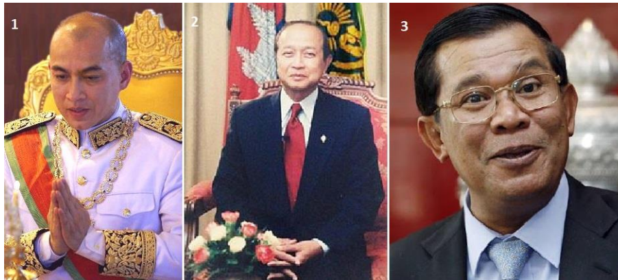
Figura 7: Norodom Sihamoni (1), primogénito de Sihanouk, fue coronado en 1998 tras la abdicación de su padre. Su hermano menor, Ranariddh (2) huyó al exilio en París tras el golpe de 1997. Hun Sun (3), líder del CCP desde 1985 y co-primer ministro junto a Ranariddh entre 1993 y 1997, continúa siendo el primer ministro de Camboya hoy en día.

El Gobierno de reconciliación salido de las elecciones de 1993 fue tan endeble que los fuertes no tardaron en aprovechar la coyuntura nacional para volver al poder por medio de un golpe en julio de 1997. Si bien el FUNCINPEC contaba con la mayoría de votos, el CCP de Hun Sen contaba con la mayoría de tropas. No hacía falta decir más.