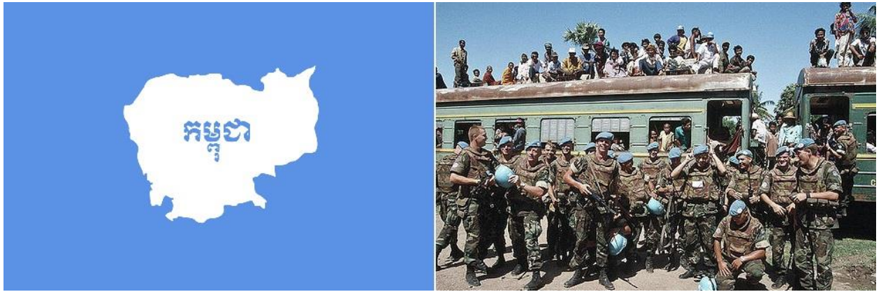
Figura 1: Soldados holandeses de la UNTAC escoltando un tren de refugiados.

La Autoridad Provisional de las Naciones Unidas en Camboya ( United Nations Transitional Authority in Cambodia , UNTAC por sus siglas en inglés) fue una de las operaciones más peculiares de la organización y, sin embargo, una de las menos conocidas. Por un lado, fue la primera vez que la ONU se hacía cargo de un estado independiente y de su correspondiente administración durante un período de transición; y posteriormente, organizaba y supervisaba unas elecciones democráticas con el bagaje traído de África, velando así por el cumplimiento de los Acuerdos de París de 1991 1 . Para muchos fue una operación de manual, vendida como un gran éxito, pues logró el cumplimiento de los objetivos principales de su agenda, dejándola enmarcada como el ejemplo quasi-ideal de Operación de Segunda Generación 2 . Para muchos camboyanos, no obstante, la UNTAC no despejó todos los nubarrones que se venían cerniendo sobre el país e incluso, en más de un par de casos, dejó alguno que otro nuevo.