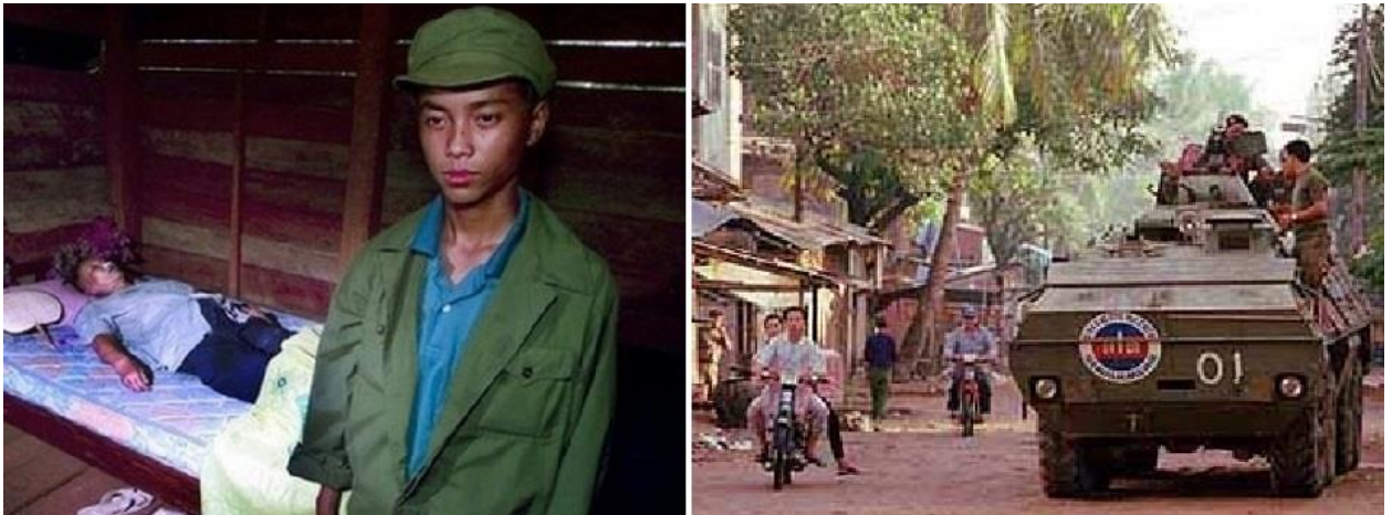
Figura 6: El cadáver de Pol Pot custodiado por uno de los últimos guerrilleros del Jemer Rojo, en abril de 1997 (izda). Soldados camboyanos leales al CCP de Hun Sen toman las calles de Phnom Penh en el golpe de julio de ese mismo año (dcha).

El desminado del país, la creación de un contingente enormemente efectivo especializado en la desactivación de explosivos, y el retorno de los refugiados fueron, indiscutiblemente, los mayores éxitos de una misión que llegó tarde y duró poco; y cuyo legado envenenado fueron el mercado de la carne 42 , el auge de la corrupción y la devaluación galopante 43 .