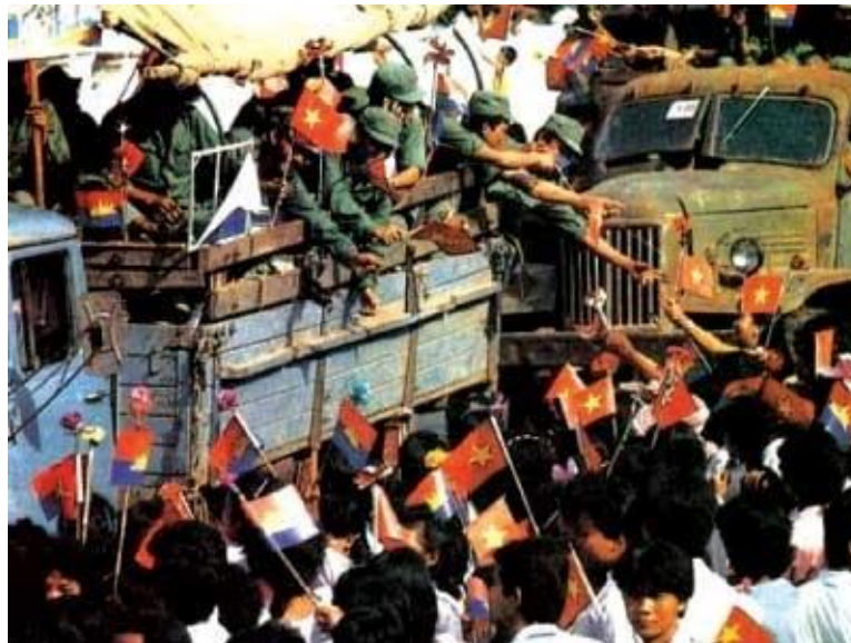
Figura 3: Tropas vietnamitas abandonan Camboya en septiembre de 1989.