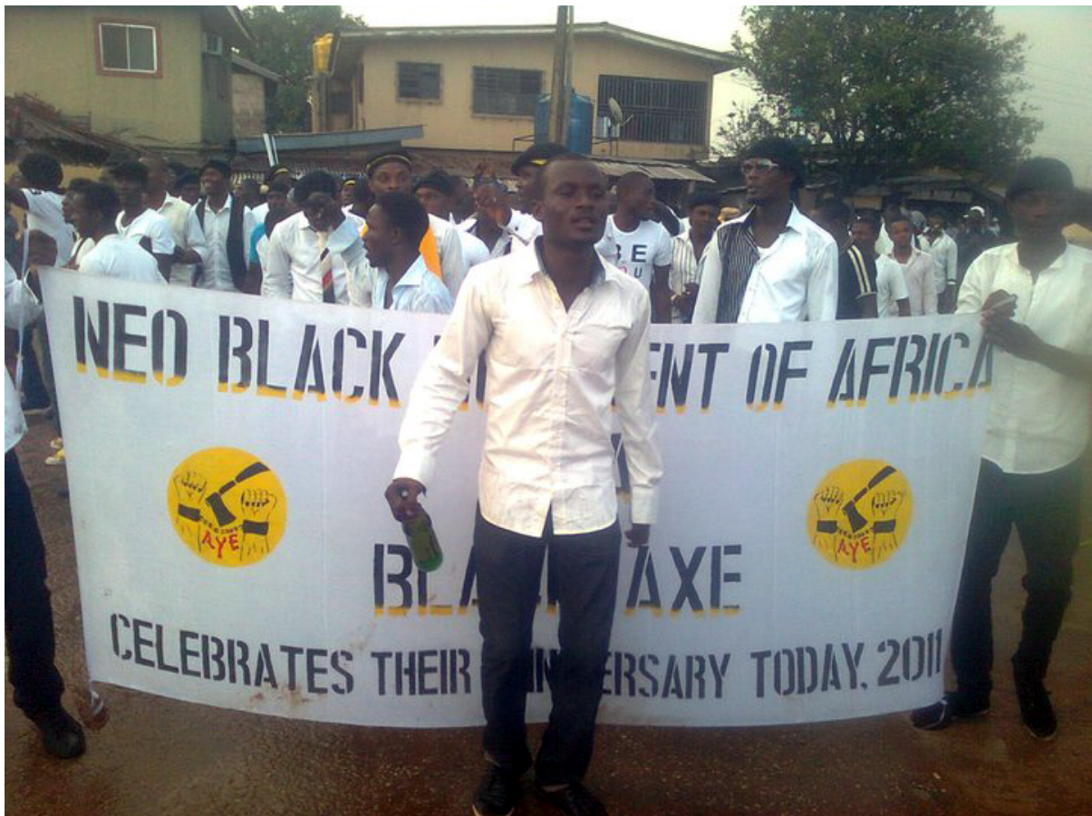
Figura 3: Miembros del grupo Black Axe - Aye

Estos grupos prestan especial atención a los aspectos de adoctrinamiento, captación de nuevos miembros y el entrenamiento en técnicas militares y de combate, generalmente llevado a cabo en zonas boscosas y alejadas de las áreas pobladas. Es por ello que exigen a los nuevos miembros el pasar por pruebas muy duras y prestar un juramento de lealtad, debido a las peculiares condiciones en que van a desempeñar sus acciones criminales. Una vez dentro del grupo se incentiva atacar y eliminar a todo elemento que se oponga o constituya una amenaza para los intereses del grupo.