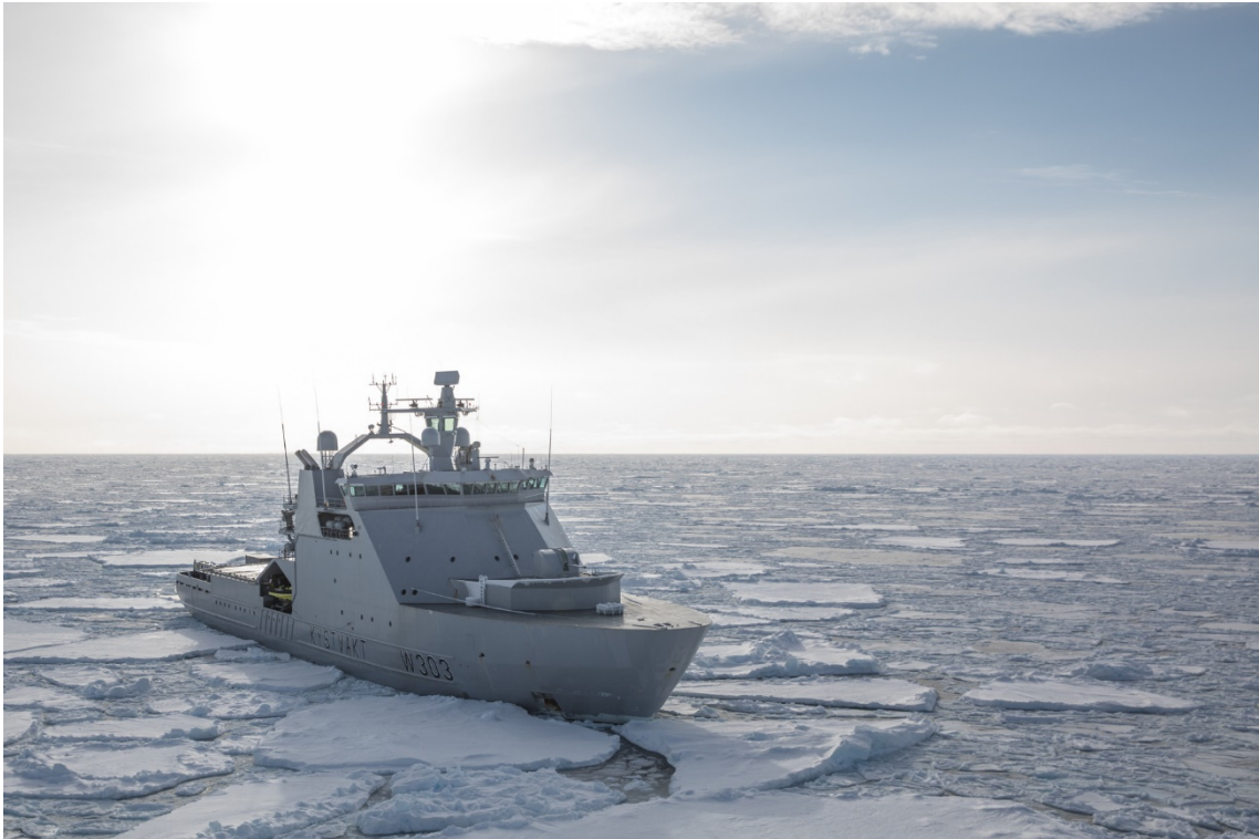
Figura 5: buque patrulla en el mar de Barents

ciertamente fácil responder en su frontera con Noruega ante, las que pudiera considerar, acciones inamistosas en otros teatros.