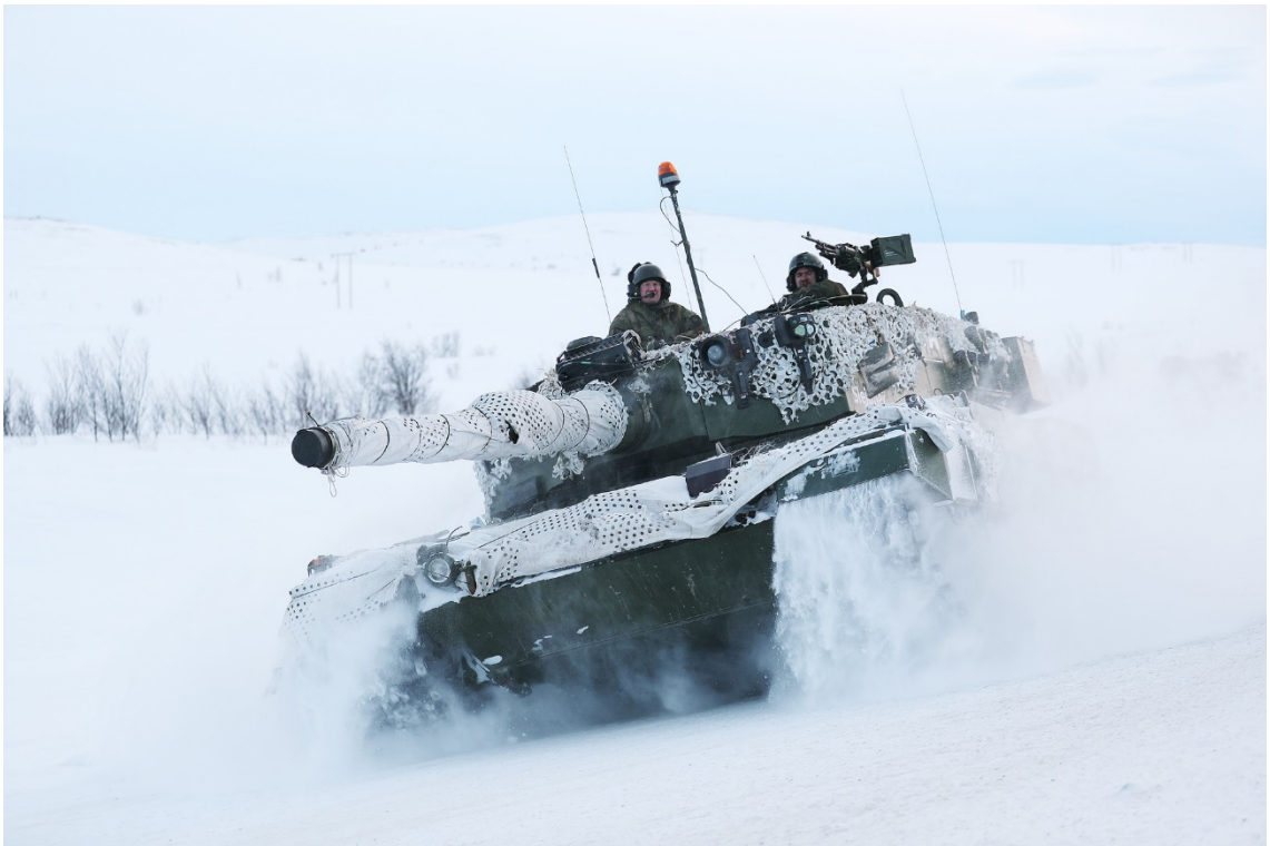
Figura 6: Leopard 2A4 noruego ‘Joint Viking 2017’

armas pesadas y el refuerzo en una compañía adicional de la Guardia de Fronteras, a la que también se dotaría de armamento de guerra 14 . Dadas las características de la región, su geografía y clima, es muy improbable que sin un despliegue militar de mayor entidad en el área de Finnmark, Noruega pueda hacer frente a una contingencia militar en el norte del país. Por mucho que ahora mismo esa sea una situación improbable, el futuro está lleno de sorpresas y dadas tanto la actual debilidad militar noruega en la región, como la incertidumbre que están produciendo las acciones de Rusia, la prudencia aconsejaría reforzar significativamente las proximidades de Sør-Varanger, ya que por mucho que se mantenga una política de buena vecindad con Rusia en el Ártico, las consecuencias de una crisis en otro lugar de Europa bien podrían tener un reflejo inmediato en el norte de Noruega. Sin embargo esa es una decisión que pudiera tener importantes repercusiones en la geopolítica regional y por lo tanto requerirá un meditado y detallado análisis de implicaciones.