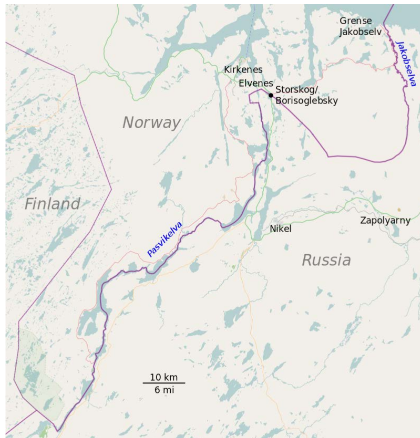
Figura 1: frontera ruso-noruega.

unos 1 500 kilómetros en línea recta desde Oslo y sobre los 70° norte de latitud, lo que hace que sea parte de la región ártica. El relieve de la zona es suave, hacia el interior está ocupada por bosque de pinos y abedules, similares a la taiga rusa, que se expanden por los valles fluviales hacia el sur. Mientras que la costa está conformada por fiordos de origen glacial, todavía helados a mediados de abril, que se extienden hacia el mar de Barents desde colinas de escasa elevación, un paisaje de tundra ártica con vegetación escasa. Sin embargo, el perfil exterior de la costa está libre de hielos todo el año debido a la Corriente del Golfo, la temperatura de la mar en aguas abiertas nunca baja de 4° C, incluso durante los más crudos inviernos. Un clima y orografía que se extienden a la inmediata península rusa de Kola y el norte de Finlandia, partes todas ellas de una misma región geográfica.