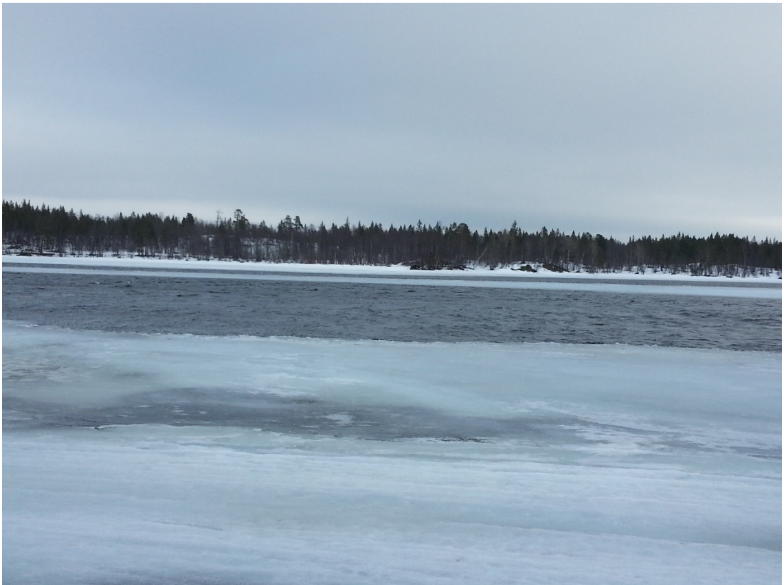
Figura 2: río Pasvik, al fondo Rusia.

que desemboca en el mar de Barents. En total, Noruega y Rusia comparten una frontera de unos 190 kilómetros, que separan el municipio noruego de Sør-Varanger del área de Pechenga, antiguo Petsamo finlandés. Como consecuencia del Tratado de Tartu de 1920 Rusia cedió el área de Petsamo a Finlandia y Sør-Varanger dejó de tener frontera con Rusia, hasta que Finlandia tuvo que retroceder Petsamo a la Unión Soviética en 1944, a raíz del armisticio que puso fin a la guerra de Continuación (1941-44). Por otra parte, la frontera con Finlandia arranca en el valle del río Pasvik, desde el límite con Rusia y se extiende unos 200 kilómetros hacia el noroeste. Así el carácter fronterizo constituye un determinante principal de Sør-Varanger, definiendo su economía, relaciones con los países vecinos y naturalmente, como se verá, las necesidades de seguridad de toda el área del norte de Noruega.