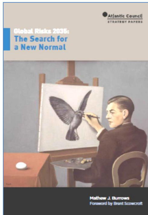
Figura 7. Global Risks 2035 . The Atlantic Council (2016)

y gobernanza y sus estudios e informes siempre son de gran interés. Además sus reuniones son un encuentro habitual entre jefes de Estado y de Gobierno, así como de líderes militares o personalidades de ambos lados del Atlántico. En septiembre de 2016 el Consejo Atlántico también publicó un informe sobre los riesgos a los que debería enfrentarse el mundo en el año 2035. Su título fue Global Risks 2035: The Search for a New Normal 9 . En su introducción, el teniente general (R) Brent Scowcroft, después de señalar los principales riesgos e inestabilidades actuales, nos indica que el mundo puede estar lleno de riesgos, pero que existen muchas oportunidades. Por ello sugiere que sería conveniente prepararse para un continuo proceso de cambio y buscar la manera de obtener ventaja.