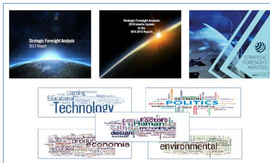
Figura 3. Tendencias mundiales analizadas en los Informes de OTAN 2013, 2015 y 2017.

En cuanto a la tecnología se analiza la implicación del dominio de la tecnología por las marcas comerciales así como la dependencia de ciertas tecnologías entre otros factores.