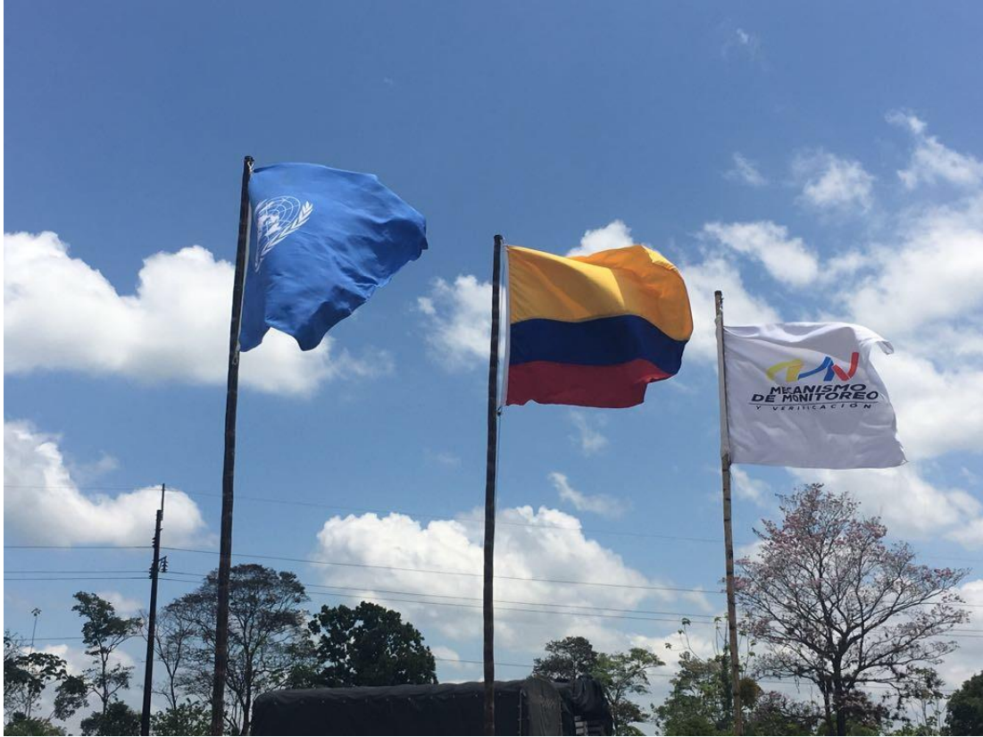
Figura 4: Banderas de la ONU, Colombia y el MM&V, en una Sede Local

La incorporación del personal fue progresiva desde junio de 2016 hasta junio de 2017, llegándose a 450 observadores internacionales 30 , de los que el 80 % tenían procedencia militar, mientras que 20 % venía de cuerpos policiales. Junto a ellos trabajaron 70 Voluntarios civiles de NNUU (UNV). En el Mecanismo trabajaban también 322 representantes del Gobierno y 322 representantes de las FARC. El despliegue contaba con el apoyo de una policía específica para la misión 31 con 2 303 efectivos y 11 102 militares colombianos encuadrados en Batallones de operaciones terrestres (BATOT) para dar seguridad a las zonas.