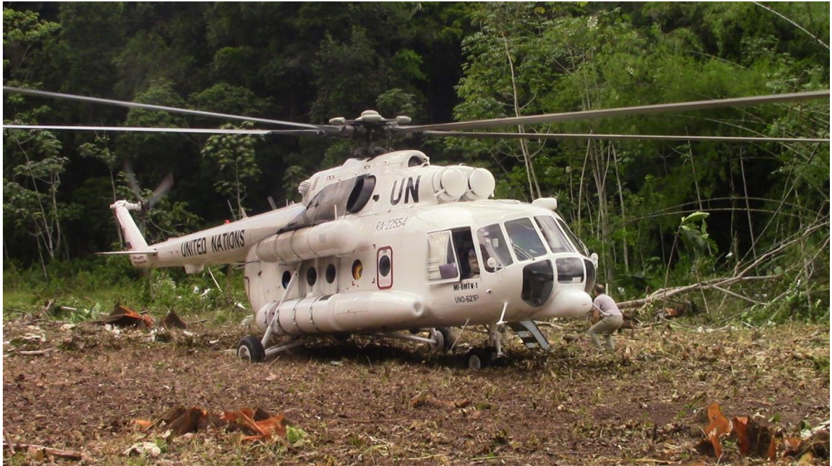
Figura 8: Uno de los dos helicópteros MI8 rusos contratados por NNUU para la MNUC

caletas, de las cuales se neutralizaron 750. Sobre las 277 que no se llegaron a inhabilitar, se entregó la información obtenida al Gobierno de Colombia para que sean alcanzadas posteriormente.