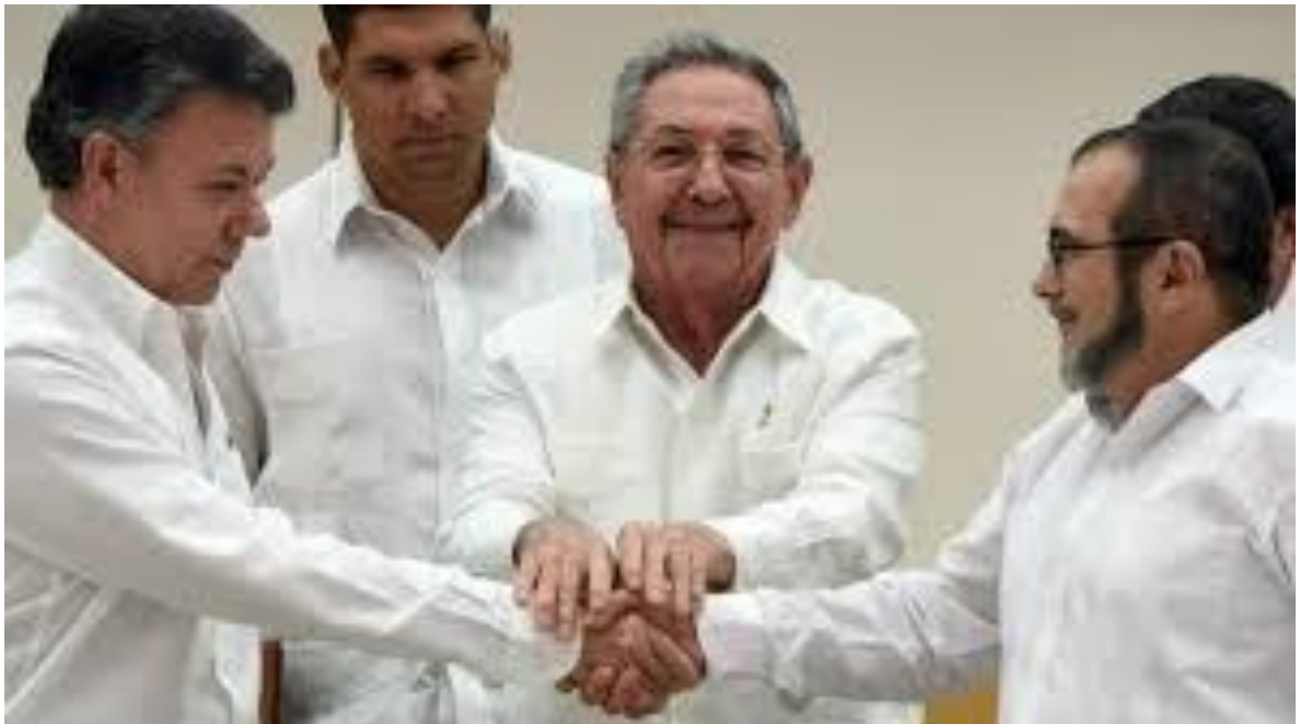
Figura 2: Acuerdo de paz en La Habana

definitivo con la guerrilla de las FARC-EP. En las negociaciones se designaron Cuba y Noruega como países garantes y Venezuela y Chile como facilitadores.