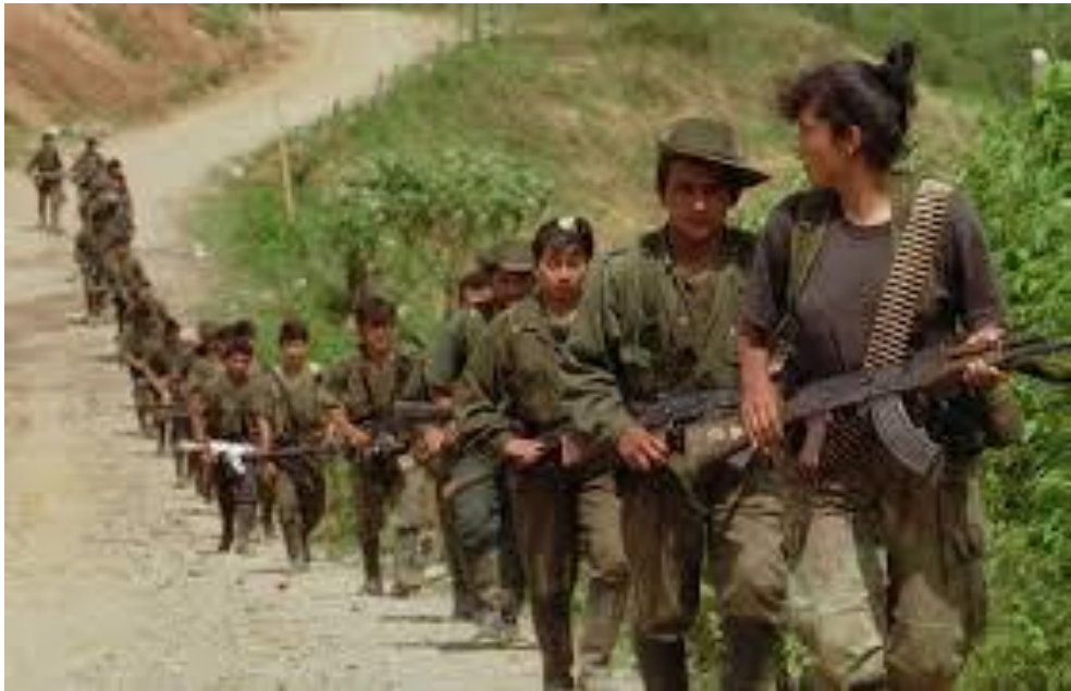
Figura 1: Columna de las FARC en marcha

Inicialmente las actividades realizadas por las FARC fueron la autodefensa y la guerra de guerrillas contra el Estado con el objetivo de alcanzar el poder. Pero en la década del 80 se iniciaron en el narcotráfico para obtener fondos, inicialmente cobrando la llamada «vacuna» 17 a los narcotraficantes en el sur del país y luego a partir de los años 90 18 , gestionando en las zonas que tenían bajo su control el cultivo de hoja de coca, la producción de pasta base y de cocaína, así como las rutas del tráfico de drogas. También participaron en otras actividades ilícitas, incluyendo el uso de minas antipersonas, el asesinato de civiles, miembros del Gobierno, policías y militares, el secuestro con fines políticos o extorsivos así como atentados con bombas y armas no convencionales (cilindros de gas, animales bomba).