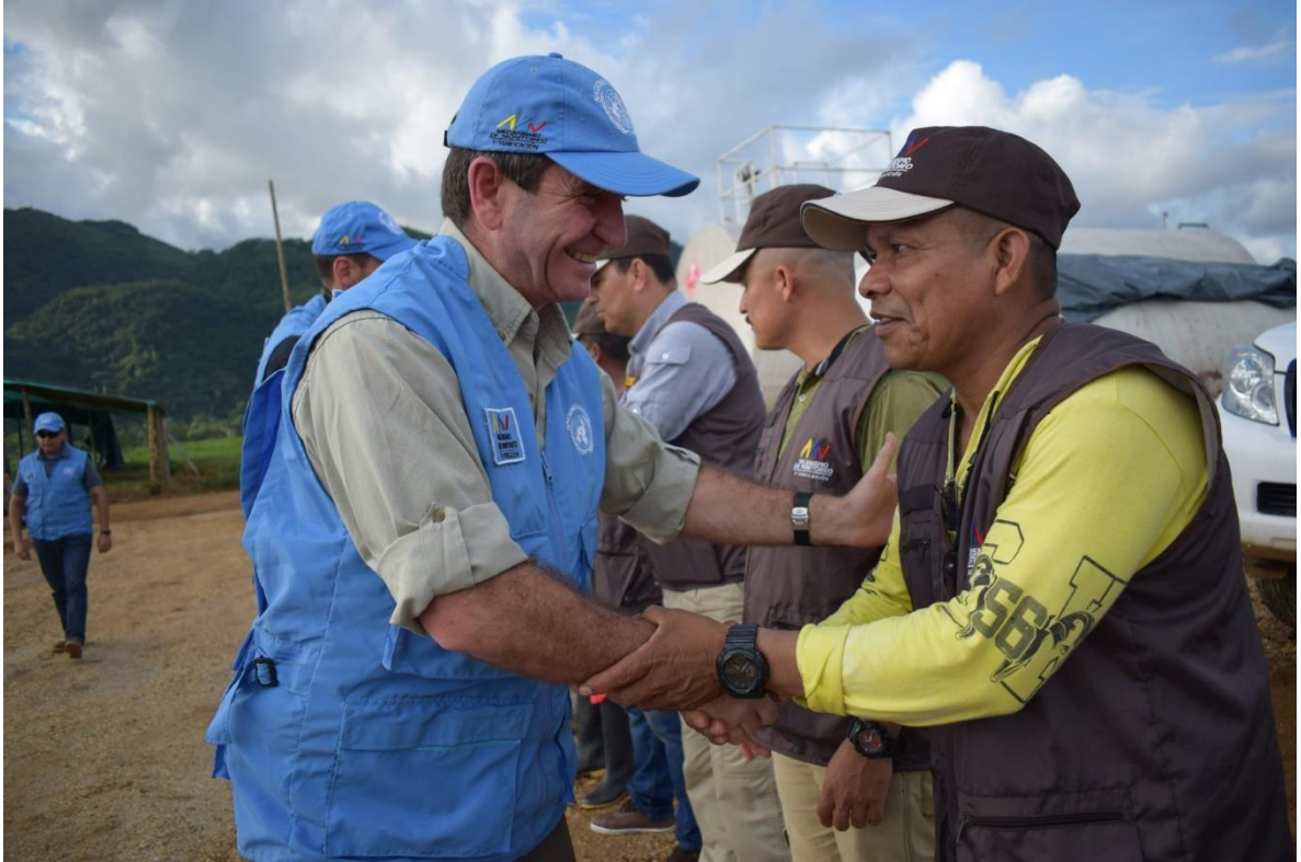
Figura 6: el general Javier Pérez Aquino, Jefe de Observadores, saluda a un miembro de las FARC integrado en el mecanismo

Con respecto a la construcción de las instalaciones de las 26 sedes locales del MM&V para permitir el despliegue del personal, significó que los observadores se alojaron en tiendas junto a los guerrilleros y miembros del Gobierno integrados en el mecanismo. En algunos casos, los observadores han permanecido 10 meses alojados en tiendas sometidos a las duras condiciones meteorológicas de Colombia, lo que nos hace una idea de la dureza de la misión.