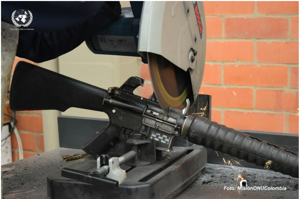
Figura 9: Corte de arma en el proceso de destrucción

El 25 de septiembre del 2017, se finalizó la inhabilitación de la totalidad del armamento almacenado en Bogotá. Tras ello fueron traspasados al Gobierno, con fecha 13 de octubre, en calidad de chatarra, 69 034 kilogramos de material resultado de la inhabilitación y destrucción de todo el armamento y munición de las FARC-EP recogido. Con ese material está previsto que se construyan tres monumentos en recuerdo del conflicto que se ubicarán en la sede de la ONU en Nueva York, La Habana y Bogotá.