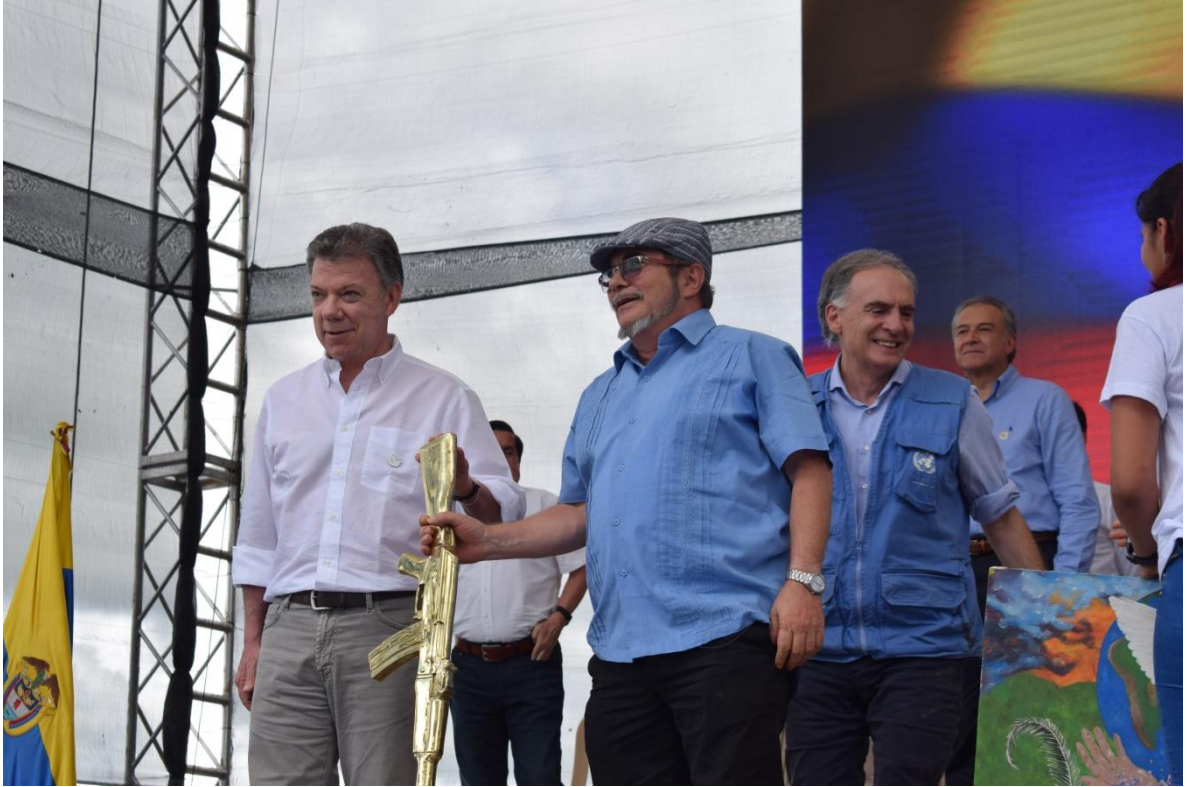
Figura 7: Timochenko, líder de las FARC, entrega al presidente Santos una réplica de un fusil, como muestra de la finalización del proceso de dejación (tras ellos, Arnaut SRSG).

se extendió hasta el día 27 del mismo mes, dejando un 10 % del armamento de cada campamento en poder de la guerrilla para efectos de seguridad, en tanto finalizaba el proceso.