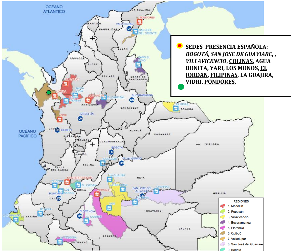
Figura 5: Despliegue en Colombia

logísticos como de cambios políticos. Es de destacar que la Misión tuvo que adaptarse constantemente a estos cambios, lo que dificultaron especialmente las operaciones logísticas.